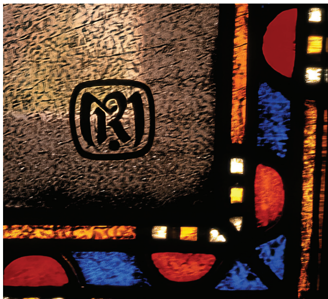
18. kép. Róth Miksa keretezett szignatúrája a marosvásárhelyi Kultúrpalota 1913-ban készült ablakán

aprók, és jelentéktelennek tűnhetnek, mégis iránytűként szolgálnak az alkotások azonosításában, elemzésében és kutatásában, a helyszíni vagy a laboratóriumi műszeres vizsgálatokat megelőzően a szakemberek számára.