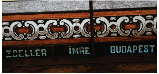
14. kép. Zsellér Imre aláírása a kalocsai Főszékesegyház északi ablakán