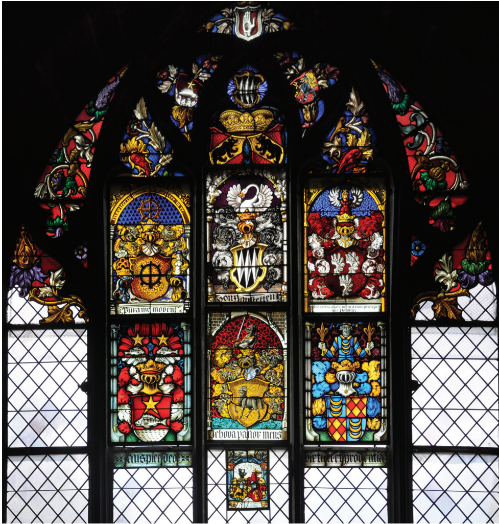
7. kép. A berni Münster címerüvegekkel telezsúfolt északi ablaka