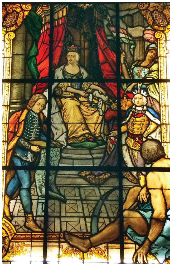
1. kép. Az Állambiztonsági Szolgálatok Történelmi Levéltárának Székházában a szellőzőakna elé rejtett Mária Terézia üvegfestmény

Az 1990-es évek elején a rendszerváltással az ingatlanok sok esetben gazdát cseréltek, és jelentős funkcióváltáson mentek keresztül. Budapest belvárosában a VI. kerületi Eötvös utca 7. szám alatti ingatlan ma az Állambiztonsági Szolgálatok Történelmi Levéltárának a székháza. 1 Az egykori főúri, műemlékileg védett neoreneszánsz palota felújításakor került elő 1998-ban a rejtettség ho-