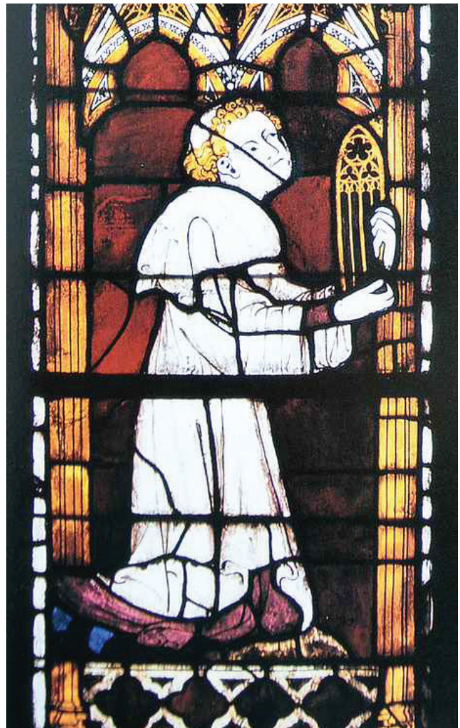
6. kép. Az evreuxi katedrális színes ablakán látható az imázsá-molyon térdeplő donátor, kezében a támogatott ablak mérműves kökeretével

Az adományozók címereik megjelenítésével is jelezhetők pénzadományait az adott templomban az ablakok elkészítésénél, vagy más tárgyak, és az épület különböző részeinek létrehozásában. A nagy svájci katedrálisokban, amelyeket Európa más országaihoz képest elkerülték a háborús pusztítások, szép számmal maradtak fenn korabeli címerek a kökeretes ablakokban. Ezek jelölhettek céheket, magasrangú egyházi méltóságokat, nemesi családokat vagy akár a várost, ahol a templom állt. Egész csokorra valót találunk ezekből a berni Münsterben (7. kép). A legtöbb címer mellett az adományozó neve az évszámmal együtt látható.