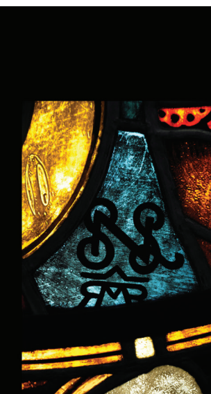
16. kép. A temesvári Papnevelde Nyolc boldogság üvegfestmény-sorozatának szignált ablaka

A lipótmezei kápolna 1914-ben készült szentély üvegfestményén Nagy Sándor jelzése hangsúlyosabban szerepel, mint a kivitelező üvegfestő Róth Miksaé. A templomhajó ablakain a két betűjelzés azonos méretű (15. kép). Nagy Sándor felesége, Kriesch Laura is részt vett a munkában, ami egy apró jelöletből látszik. 20 Hasonló arányokat találunk a temesvári Papnevelde Nyolc boldogság üvegfestmény-sorozatának egyik ablakán (16. kép).