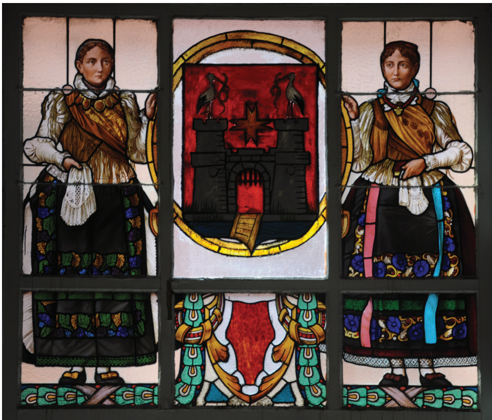
13. kép. Viseletbe öltözött hölgyek a kalocsai városháza fölépcsőházi ablakán

írás: Palka József Bpest. 1905. A templom iratanyagában, a Historia Domus ban egyáltalán nem említik a nevét.