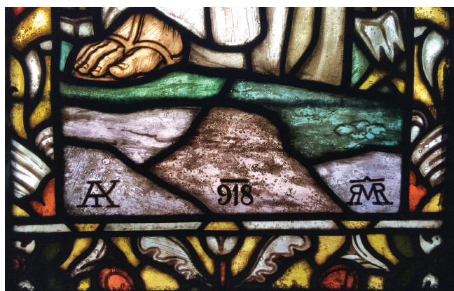
17. kép. A budapesti Központi Papnevelő Intézet oratóriumának Jó Pásztor üvegfestményén a tervező és a kivitelező külön-külön szerepel saját szignatúrával

A 19. és 20. század századfordulójára már kialakul az együttműködés az iparművészetet képviselő üvegfestők és a figurális kompozíciók tervezeteit készítő festőművészek között. A magyar üvegfestészet fénykora jön el, ami-