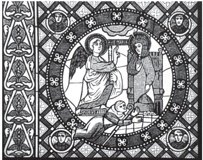
2. kép. Suger apát fekvő helyzetű, szalagfeliratos grafikai ábrázolása a Saint Denis székesegyház Boldogságos Szűz kápolnájából

üvegfestményein beáramló színes fény ragyogóvá teszi a templomot, amelyet lelkesen versekben is megénekel. Az egyház dicsőségét előtérbe helyező főpap szerénysége ellenére fontosnak tartja önmagát is megfestetni. A Boldogságos Szűz kápolnájában, a bal oldali ablak sarkában „Sugerius Abbas” egyszerű barna szerzetesi ruhában, mezítláb, leborotvált fejtetővel látható. Alázatosan leborulva, fekvő helyzetben, pásztorbottal a kezében ajánlja fel az általa megújított templomot Szűz Máriának (2. kép 4 ). Az első ismert adományozó személye a szalagfelirat – SVGERIVSABAS – alapján azonosítható.