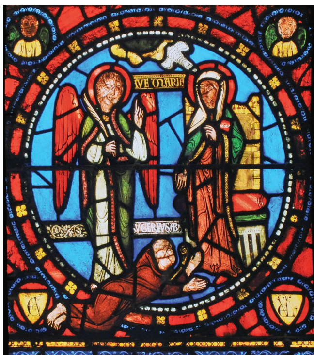
3. kép. Suger apát ma látható alakja a székesegyház üvegfestményén

éves üvegfestményeket. Nemcsak indulattól fűtve, de az ólomsínnek miatti puszkagolyók gyártásához is. A széles néptömegekre ebben az időben a tájékozatlanság és műveletlenség volt jellemző. Az ablakok maradványai szét-szóródtak, többségüket eladták. A megmaradtakat később restaurálták, rajzok és nyomatok felhasználásával részlegesen rekonstruálták. Ma ezek alapján lehet fogalmunk az egykori remekművekről és magáról az adományozóról (3. kép 6 ). 7