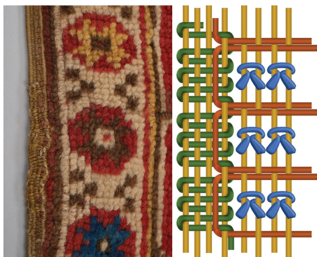
6. kép. Ún. beakasztós oldalszél. „Erdélyi szőnyeg”, ltsz.: 24460, Iparművészeti Múzeum

eredőnek tekinthető, akkor lemérjük, mert mérete adaléket szolgáltat a szőnyeg eredeti hosszára vonatkozó feltételezésekhez. A rojtok színét külön meg kell határozni, mivel az eltérhet a láncfonal színétől.