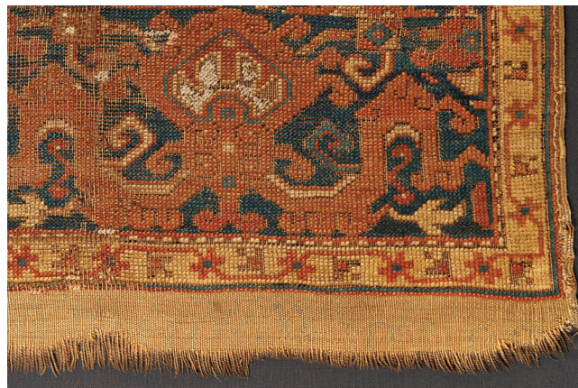
7. kép. Egy Lotto-szőnyeg részletfotója látható fényben. Lotto-szőnyeg, 17. század, magántulajdon