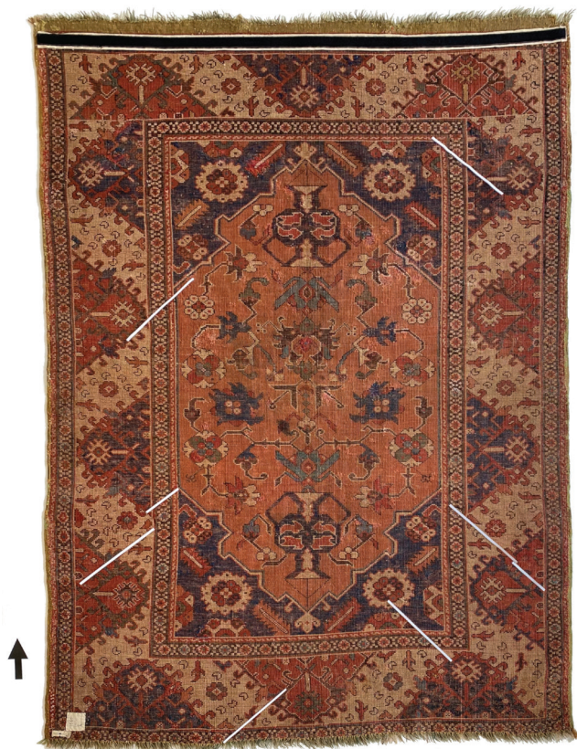
3. ábra. A „lusta vonalak” helyzetének és formájának jelölése a szőnyeg fonákoldalán. „Erdélyi szőnyeg”, 17. század második fele, ltsz.: 7960, Iparművészeti Múzeum

eredőnek tekinthető, akkor lemérjük, mert mérete adaléket szolgáltat a szőnyeg eredeti hosszára vonatkozó feltételezésekhez. A rojtok színét külön meg kell határozni, mivel az eltérhet a láncfonal színétől.