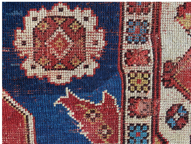
5. kép. A szőnyeg színoldalán látható a „lusta vonal”, amit a csomókhöz felhasznált különböző színek közötti eltérések is jól hangsúlyoznak. „Erdélyi szőnyeg”, 17. század utolsó harmada, ltsz.: 74.52.1., Iparművészeti Múzeum