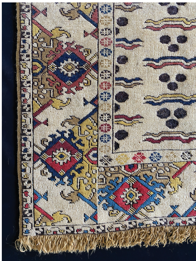
2. kép. Ün. Tuduc-szőnyeg, csintamáni típusú szőnyeg, 1925–1940-es évek, részletfotó. Magántulajdon

Az adatbázist megalapozó kutatásunk a 15–18. századi oszmán-török szőnyegek gyűjteményi csoportjára koncentrálódik. Feltételezésünk szerint, ha a szőnyegek részletes, szemrevételezéssel, valamint optikai és polarizációs mikroszkóp használatával történő technikai felméréseinek eredményeit az adatbázisunkban tároljuk, akkor – kellő adatmennyiség rendelkezésre állása esetén – az adatok szűrésével készítési helyeket, korszakokat határozhatunk meg.