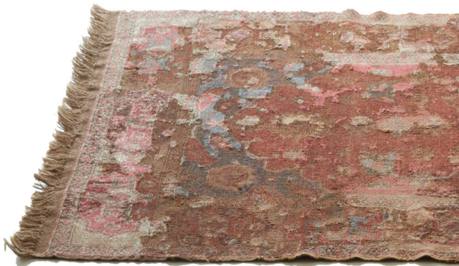
3. kép. A világosabb területeken láthatók a szőnyeg nagymértékű kiegészítései, részlet. „Erdélyi szőnyeg”, 17. század utolsó harmada, ltsz.: 63.731.1., Iparművészeti Múzeum

Fontos szempont, hogy csak az eredeti szőnyegrészek felmérését végezzük el, vagyis a korábbi restaurálások során alkalmazott kiegészítéseket nem tekintjük a technikai felmérés tárgyának. A méret felvétele is ennek megfelelően történik, így külön jelöljük, hogy egész-e a szőnyeg, vagy csupán töredékről (3. kép) van szó.