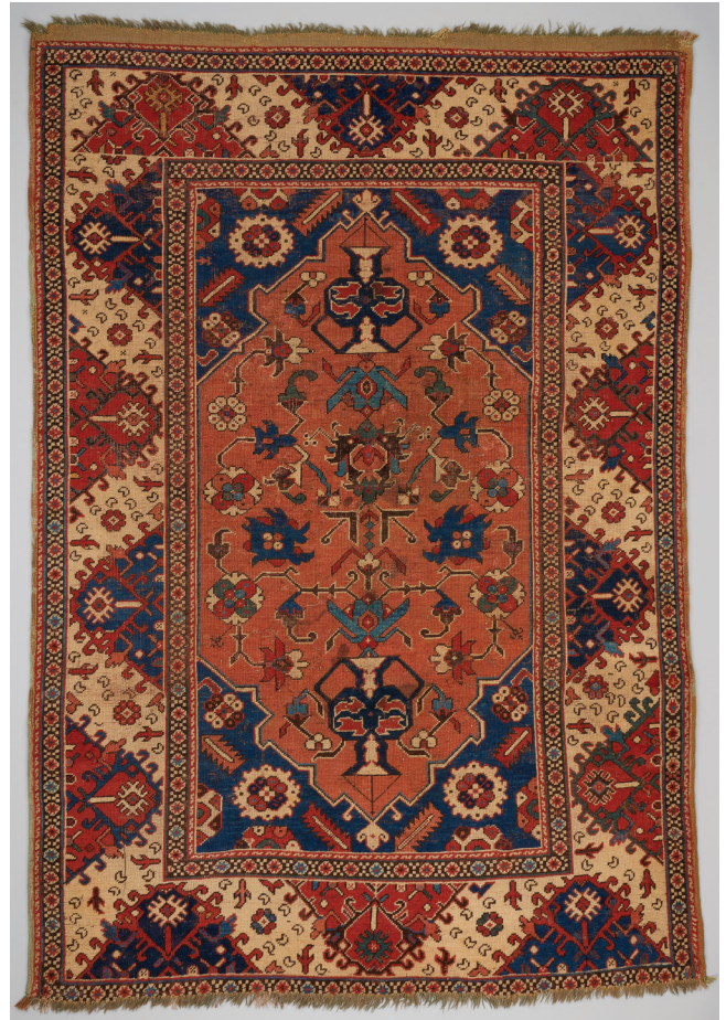
1. kép. „Erdélyi szőnyeg”, 17. század második fele, ltsz.: 7960, Iparművészeti Múzeum

Az adatfelvételi folyamat során a restauráláshoz kapcsolódó történeti vonatkozások is kirajzolódnak. A szőnyegek technikai felmérése azonban mást jelent, mint