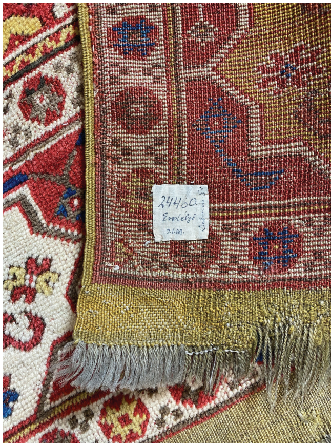
4. kép. A szőnyeg fonákoldala jól szemlélteti a szőnyegek részeit (csomózott rész, oldalszél, előszövés, rojt), az eredeti részt és a sarkkiegészítést. „Erdélyi szőnyeg”, 17. század eleje, ltsz.: 24460, Iparművészeti Múzeum

elsősorban az oszmán-török szőnyegekre jellemző – (5. kép, 2. ábra). A felmérés során a „lusta vonalak” feltérképezése is megtörténik, elhelyezkedésükről, formájukról rajz készül (3. ábra).