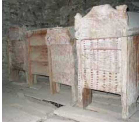
12. kép. Ácsolt ládák a hégeni templom padlásán.

Az Iparművészeti szakirány 2003-ban az Erasmus felsőoktatási program keretén belül négy egyetem – a hildesheimi HAWK, a helsinki EVTEK, 5 a nagyszebeni Univer-