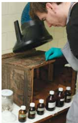
8–9. kép. Diplomamunkán dolgozó hallgatók a farestaurátor műteremben.