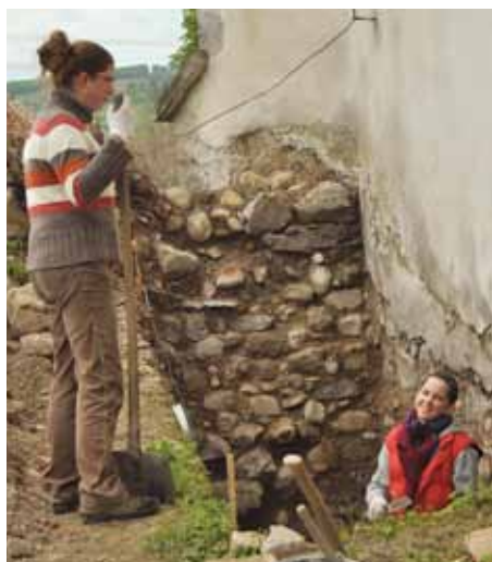
17. kép. Ásatási gyakorlat a székelyudvarhelyi Haáz Rezső Múzeum régészeinek vezetésével.

harmadik rendezvényére Hildesheim (2011) és Amsterdam (2012) után 2013-ban Magyarországon kerül sor. Szakirányunk több oktatója meghívottként speciális kurzusokat ad a bécsi „die Angewandten” és a helsinki Metropolia egyetemen.