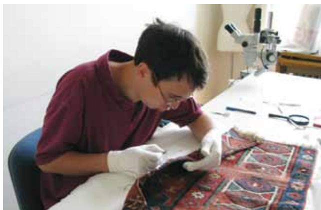
7. kép. Textilkonzerválás gyakorlat, Iparművészeti szakirány III. évfolyam.