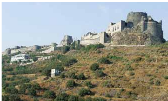
15. kép. A Margati vár, a Szír–Magyar Régészeti Misszió helyszíne.