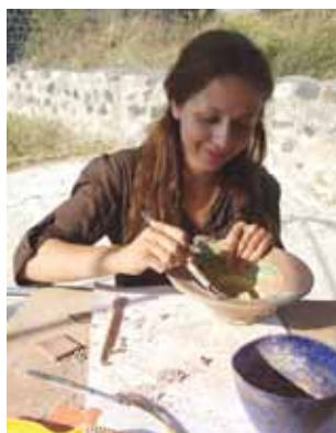
16. kép. Ásatási és restaurálási gyakorlat a margati vár feltárásánál.

megalapításuk óta oktatóink rendszeres előadói, illetve szerzői.