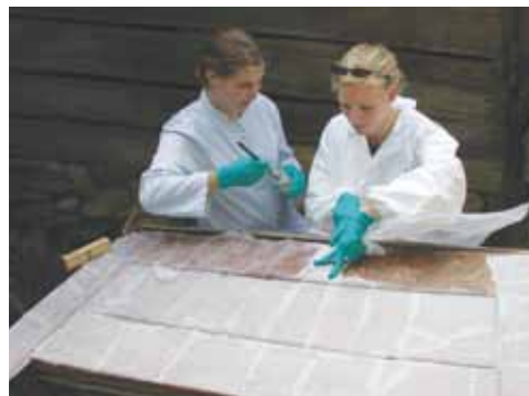
14. kép. Hégeni ácsolt láda felvált festékrétegeinek rögzítése, Segesvár, 2003.

sitatea Lucian Blaga és az MKE – hallgatóinak rendezett intenzív projektet „Conservation of Transylvanian Saxon Furniture” címmel (11. kép). 6