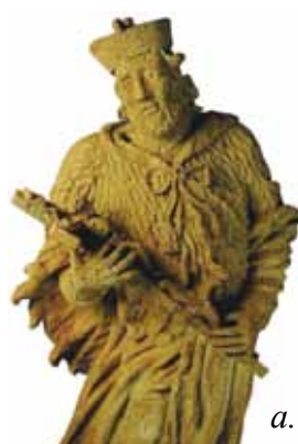
5. a-b. kép. Ismeretlen mester 1778. Nepomuki Szent János szoborcsoport. Kőszobor, Mád, Önkormányzat. Restaurálta: Hering Zoltán, 2008–2009.