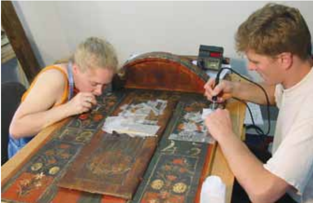
11. kép. Finn és magyar bútorrestaurátor hallgató szász falitékát restaurál Erasmus intenzív projekt keretében. Nagyszeben, 2003.