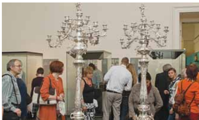
10. kép. Megmentett műkincsek 2010. Diplomamunka kiállítás a Magyar Nemzeti Múzeumban.

oldásait és konzerválásuk módszereit ismerik meg, elméletben és gyakorlatban egyaránt (6–7. kép). Ezek mellett szervetlen és szerves kémia, fizika, anyagtan, anyagvizsgálat, műtárgykörnyezet, technikatörténet, általános művészettörténet, művelődéstörténet, restaurálástörténet és etika tantárgyakat tanulnak. Az első három közös év után a hatodik szemesztertől szétválik az évfolyam és az utolsó két évben az elméleti és gyakorlati tantárgyak egyaránt a választott specializációt szolgálják.