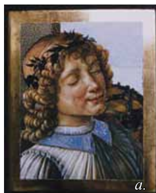
1. a-d. kép. S. Botticelli: Madonna gyermekkel és egy anyuval, részlet. Másolta: Bendel Judit, 1995.

Magyarországon ez az egyetlen intézmény, amelyben restaurátorművész diplomát lehet szerezni. A képzés mind nappali, mind levelező tagozaton öt év. 1999 óta