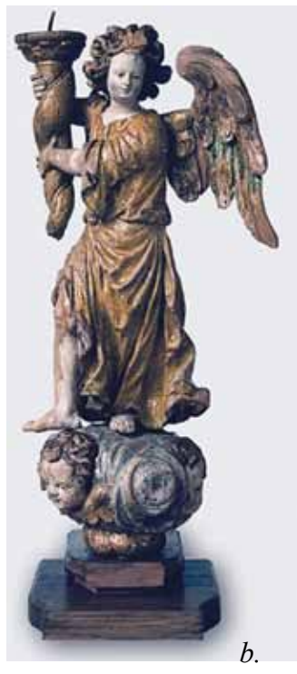
4. a-b. kép. Ismeretlen mester 17. század: Gyertyatartó angyal. Polikróm faszobor, Néprajzi Múzeum, Restaurálta: Samu Erika, 2006–2007.