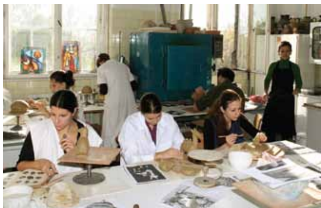
6. kép. Szilikát készítőtechnika gyakorlat, másolat készítés, Iparművészeti szakirány I. évfolyam.