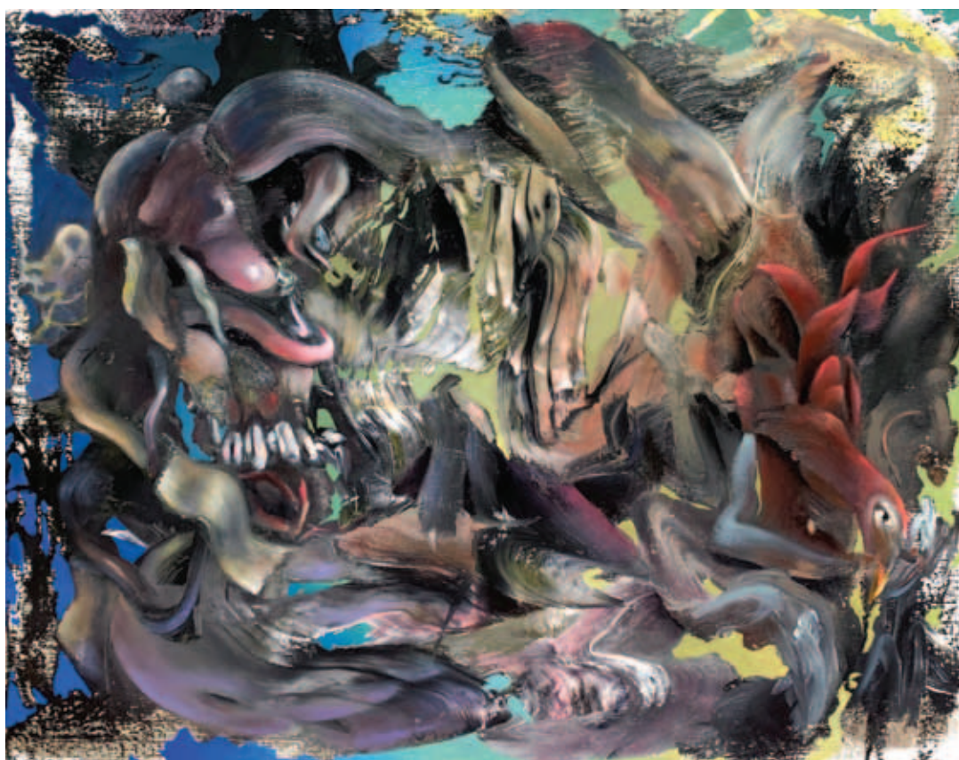
TODOR TAMÁS, Lények 2., 2022, olaj, vászon, 70x90 cm; Vadászat, 2021, olaj, vászon, 80x100 cm