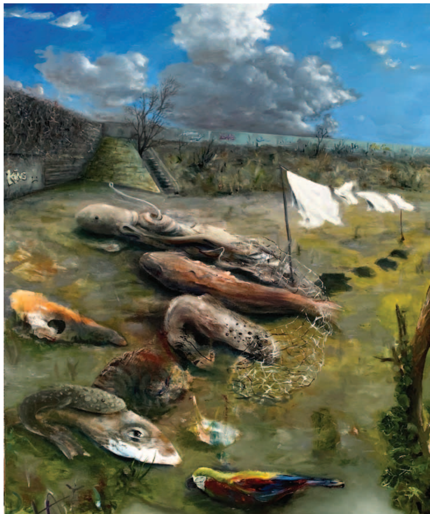
TODOR TAMÁS, Hátsóudvar, 2021, olaj, vászon, 120x100 cm