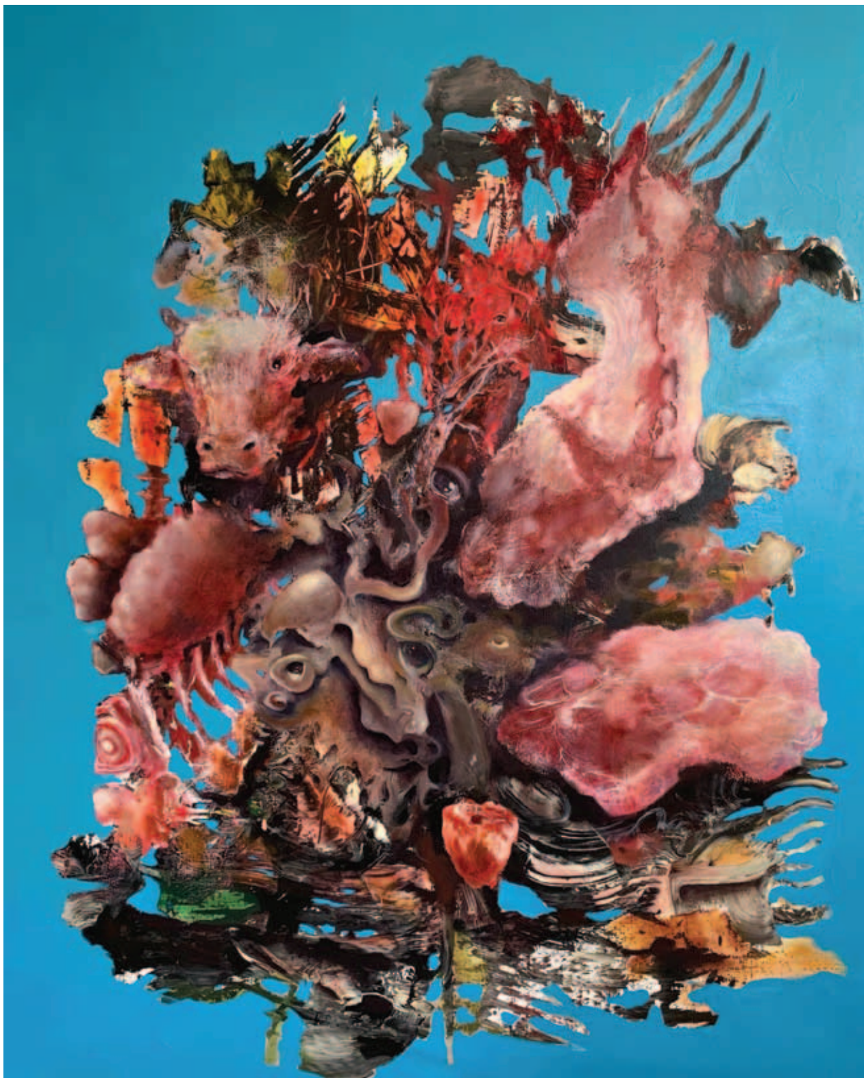
TODOR TAMÁS, Húst hússal, 2022, olaj, vászon, 180x150 cm

◀ TODOR TAMÁS, Ince pápa portréja, interpretáció, 2022, olaj, vászon, 180x150 cm