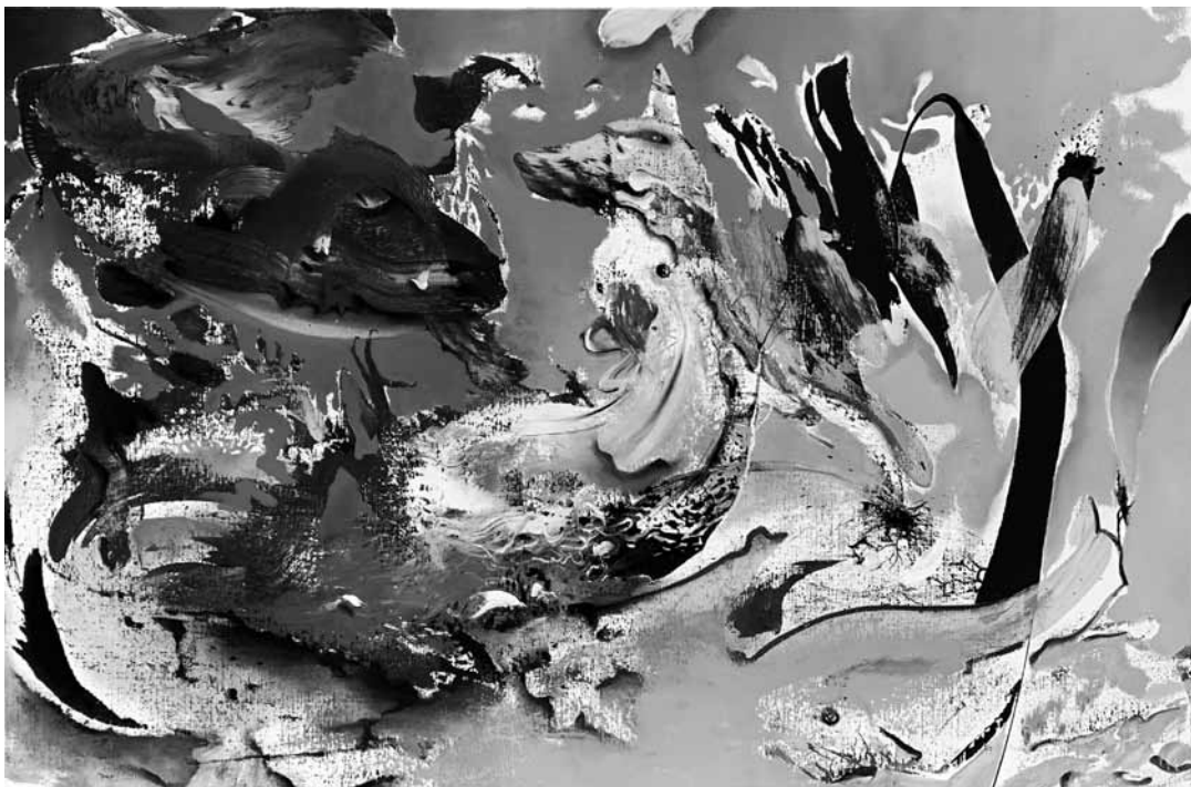
TODOR TAMÁS, Élő Lények , 2021, olaj, vásznon, 70x120 cm

Egy ilyen megközelítés nem egyszerűen kiegészíti, hanem átértelmezi a tanítási folyamatot: ez az a tér, amelyben a tudomány tanításának értelme is megmutatkozik. A kérdés persze továbbra is megmarad: pedagógiai utópia mindez? Van-e rá esély, amikor az életünk felgyorsulása a kultúra más területein is háttérbe szorítja a narratívákat? Van-e rá valódi szükség? És ha igen, a sűrű órarend és a tantervi kényszerek közepette nem érdemes-e inkább egy karikatúrát mutatni a tudományból – a realitások jegyében, a gyorsaság és tömörség kedvéért? De azt se feledjük, ha csak utópia is lenne mindez, miként Kotakowski meggyőzően megmutatta, gondolkodásunknak akkor is irányt mutathat.