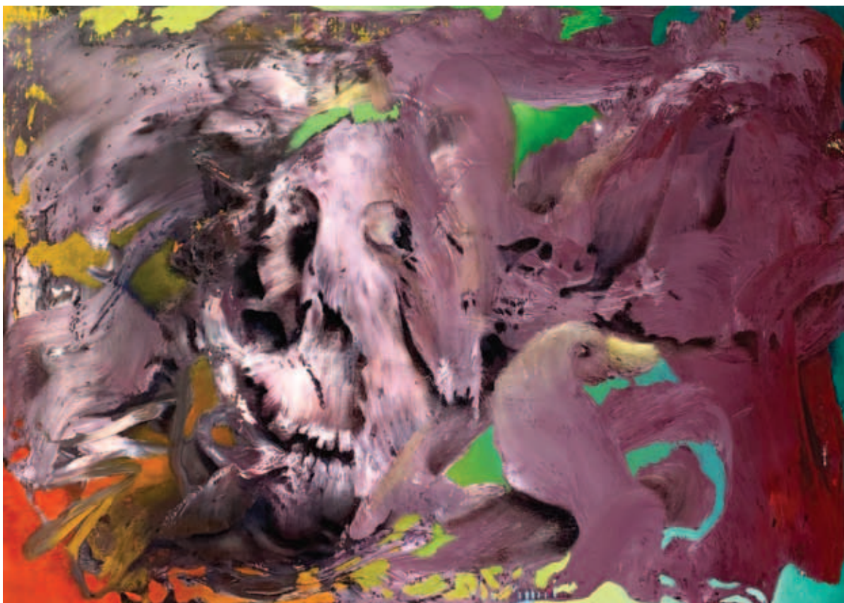
TODOR TAMÁS, Lények, 2022, olaj, vászon, 70x90 cm; Portré, 2021, olaj, vászon, 50x70 cm