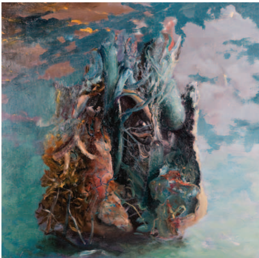
TODOR TAMÁS, SORA 2., 2019, olaj, vászon, 70x50 cm; SORA 1., 2019, olaj, vászon, 50x50 cm