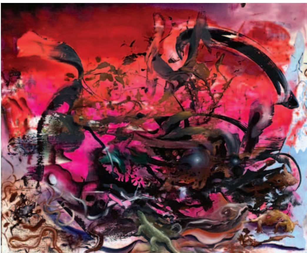
TODOR TAMÁS, Körtorgás, 2021, olaj, vászon, 130x130 cm; Éjszakai lények, 2021, olaj, vászon, 100x120 cm