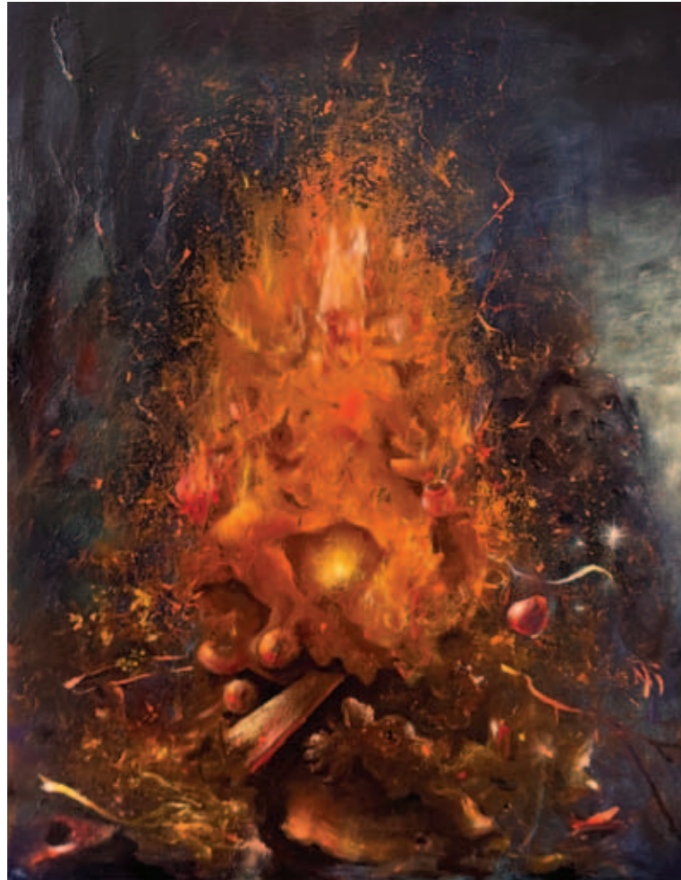
TODOR TAMÁS, Családi idill, 2025, olaj, vászon, 150x140 cm; Húság pokla 1., 2025, olaj, vászon, 50x35 cm