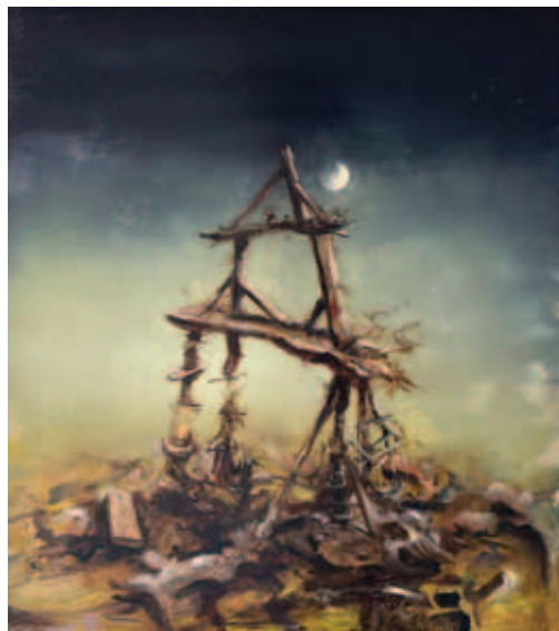
TODOR TAMÁS, Trón 6–7., (2x) 2025, olaj, alumíniumlemez, 23x12 cm; Prométheusz, 2025, olaj, alumíniumlemez, 36x33 cm; Struktúra, 2025, olaj, alumíniumlemez, 36x33 cm

◀ TODOR TAMÁS, Trón 2–5., (4x) 2025, olaj, alumíniumlemez, 23x12 cm