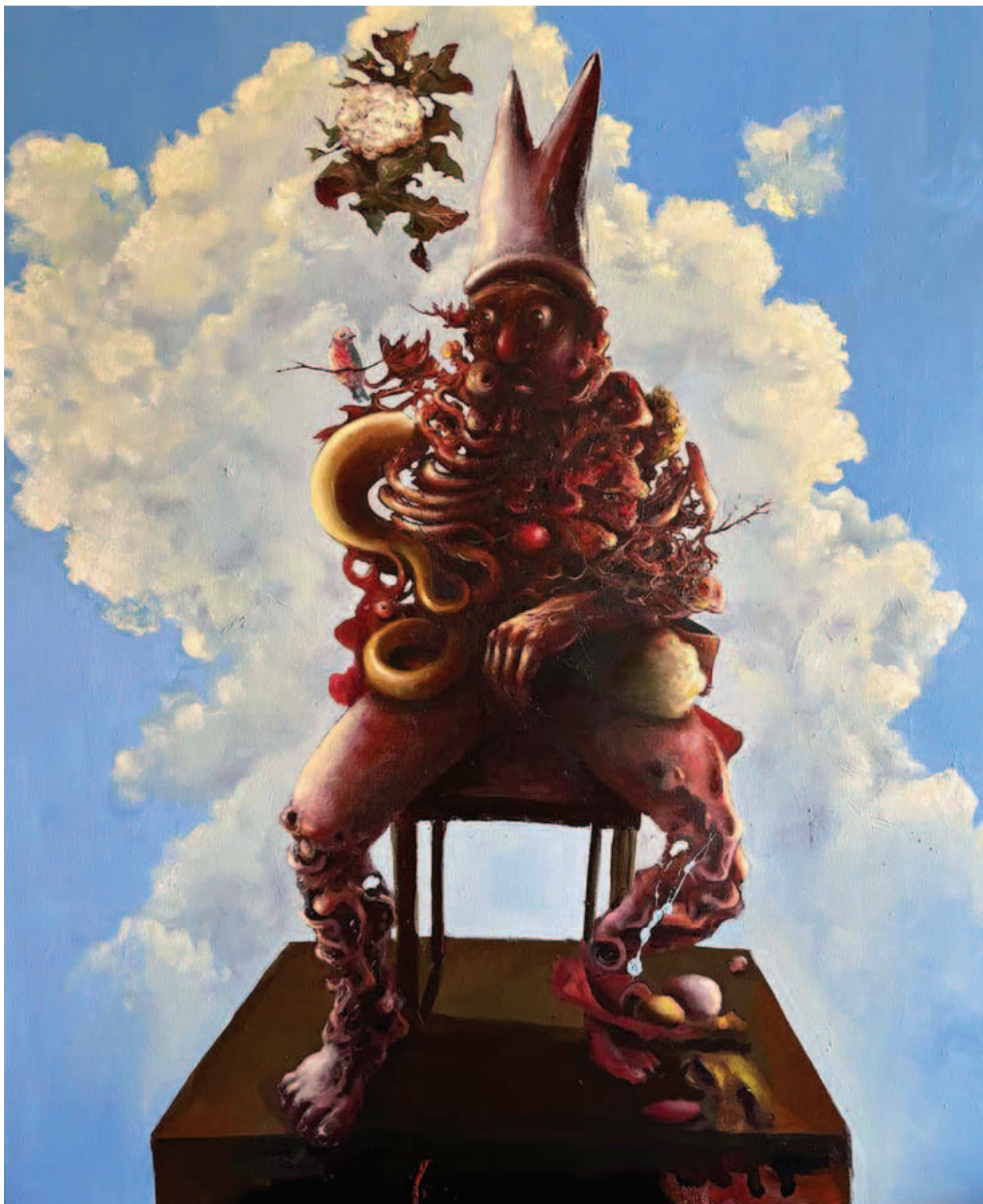
TODOR TAMÁS, Halandóságra ébredés, 2024, olaj, vászon, 120x100 cm