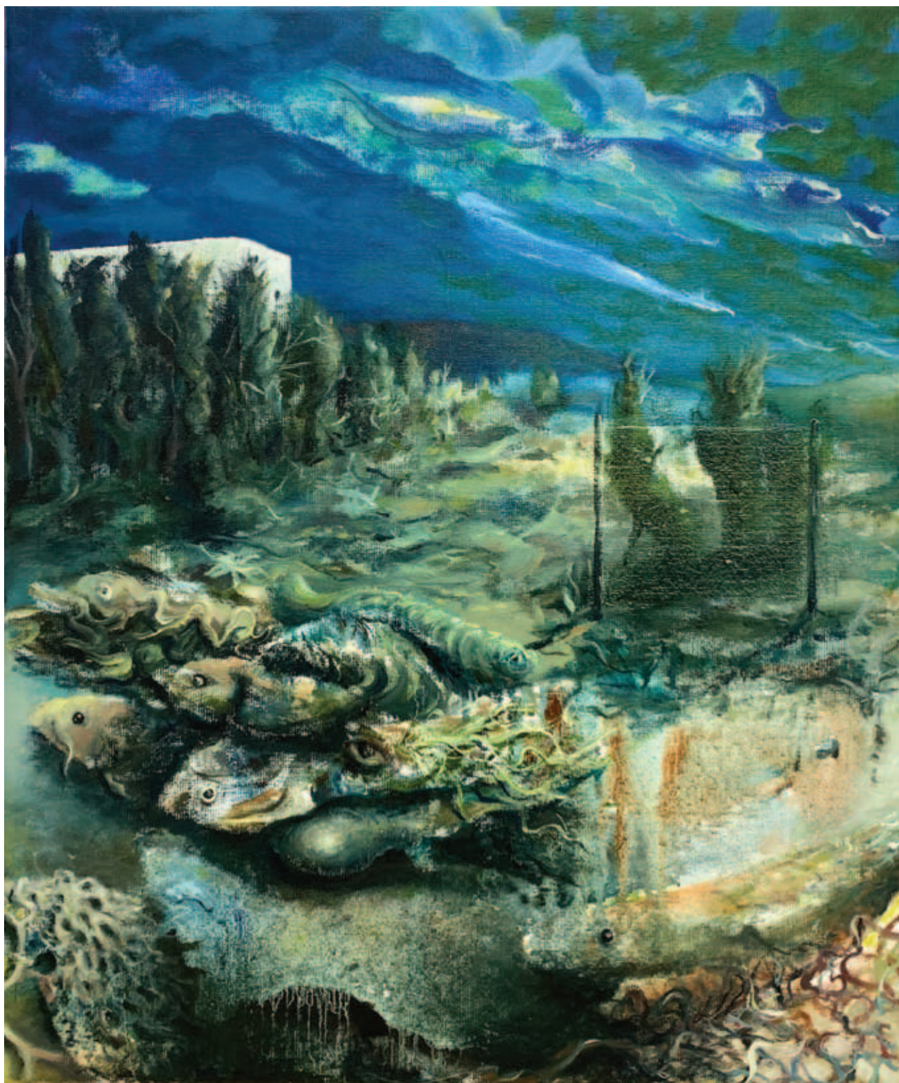
TODOR TAMÁS, Urbán idill, 2020, olaj, vászon, 50x40 cm