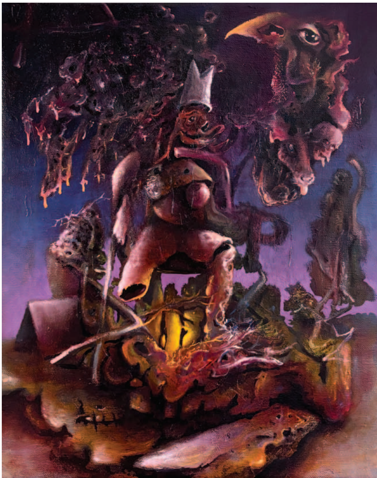
TODOR TAMÁS, Felemészt , 2025, olaj, vászon, 50x35 cm