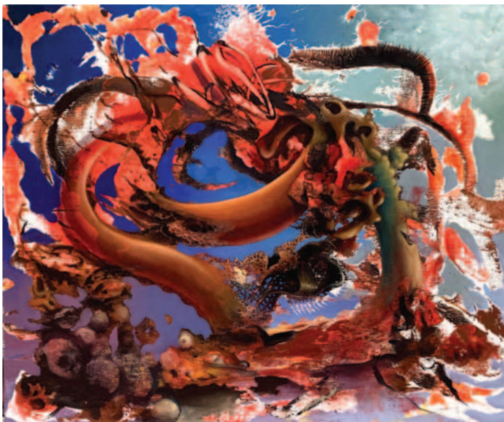
TODOR TAMÁS, Lovas, 2021, olaj, vászon, 140x140 cm; Sárkány halála, 2021, olaj, vászon, 100x120 cm