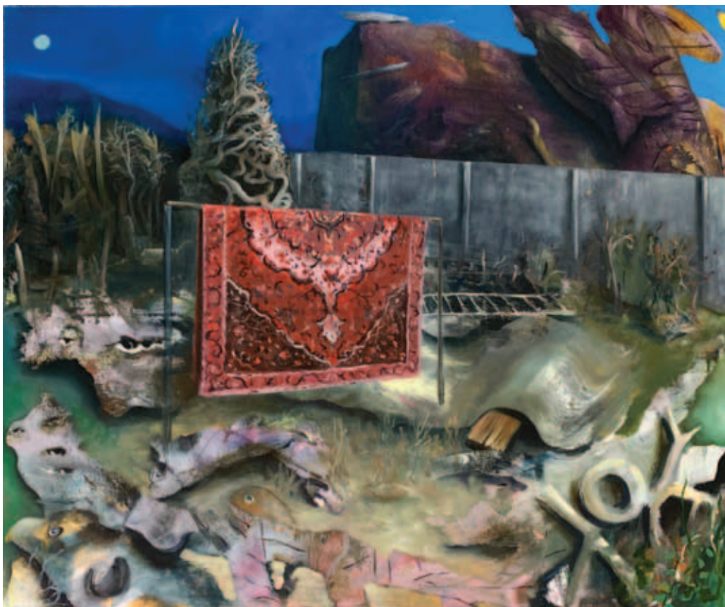
TODOR TAMÁS, Hátsóudvar 2., 2021, olaj, vászon, 140x120 cm; Szőnyegporoló, 2021, olaj, vászon, 110x130 cm