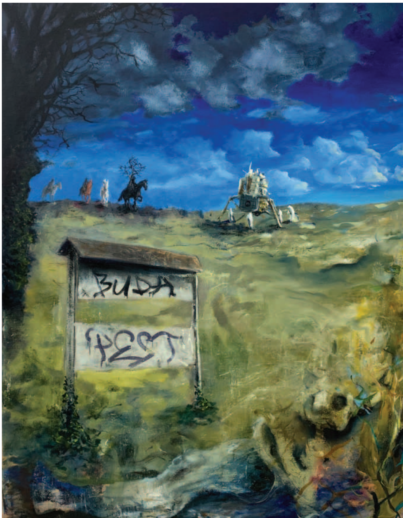
TODOR TAMÁS, Budapest, 2020, olaj, vászon, 80x60 cm