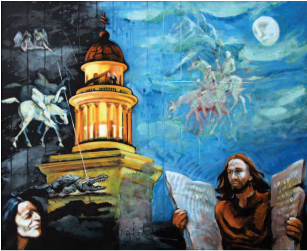
KOPÓCS TIBOR, György lovag kalandja holdfényben a Pannonhalmi Főapátság körüli, 2009, akril, vászon, 90x110 cm; Rekviem – Lelőttek egy huszárt, 2013, akril, vászon, 80x100 cm