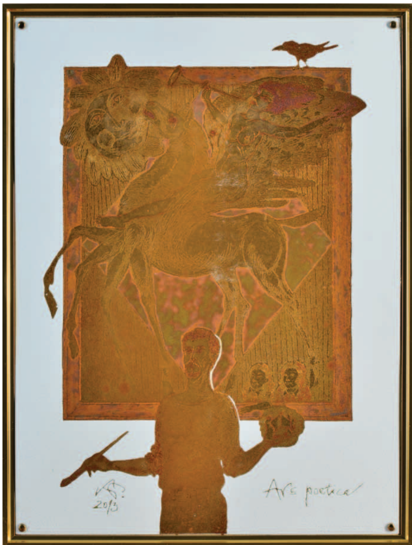
KOPÓCS TIBOR, Ars poetica , 2013, tűzzománc, 47x35 cm