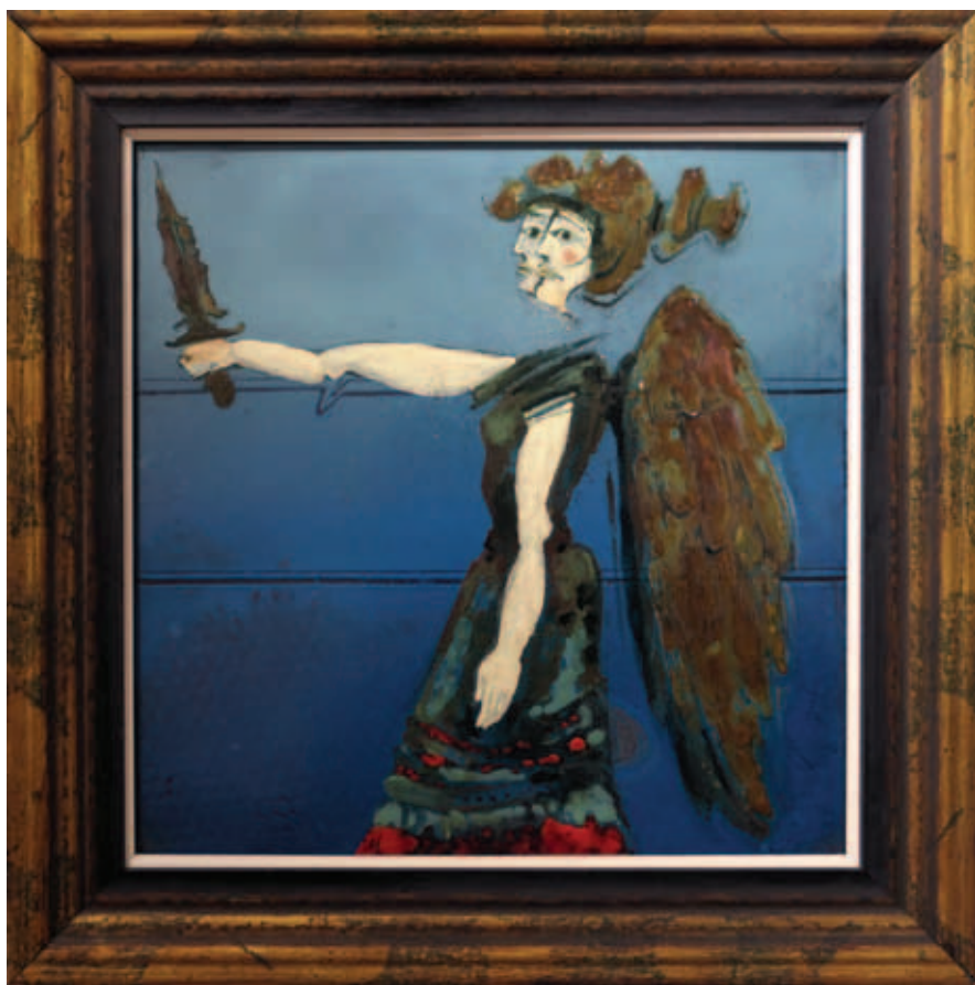
KOPÓCS TIBOR, Militáns angyal, 2006, tűzzománc, 40x40 cm; Szent Antal megkísértése, 2006, tűzzománc, 40x40 cm