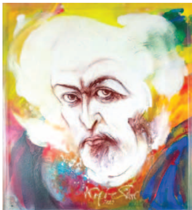
KOPÓCS TIBOR, Nagy [Szent] Szajha – Jelenések Könyvéből, 2024, akril, vászon, 90x90 cm; Teremtő tekintet, 2023, akril, vászon, 85x77 cm; A Teremtés algoritmus, 2023, akril, vászon, 90x120 cm