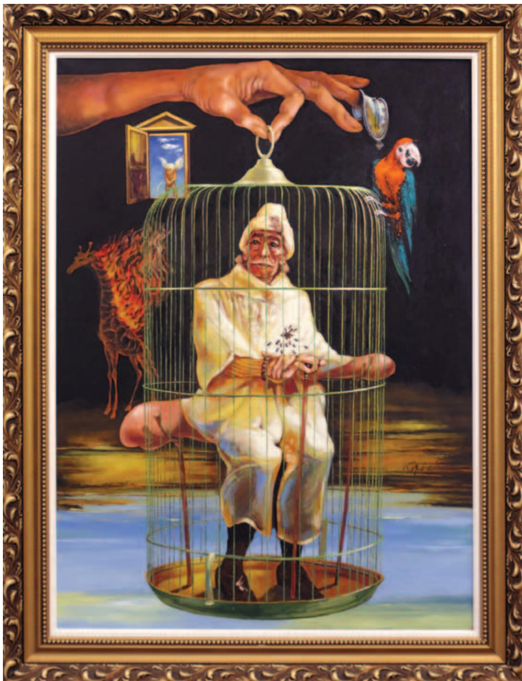
KOPÓCS TIBOR, Szegény Salvador [Dalí] sorsa beteljesedett, 2010, olaj, vászon, 110x80 cm