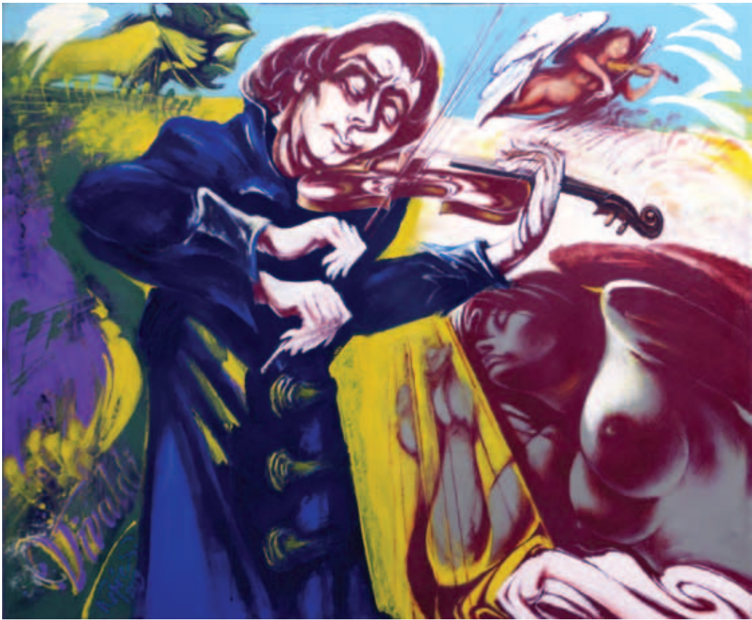
KOPÓCS TIBOR, Antonio Vivaldi, Tavasz, 2019; Tél, 2025, (2x) akril, vászon, 90x110 cm