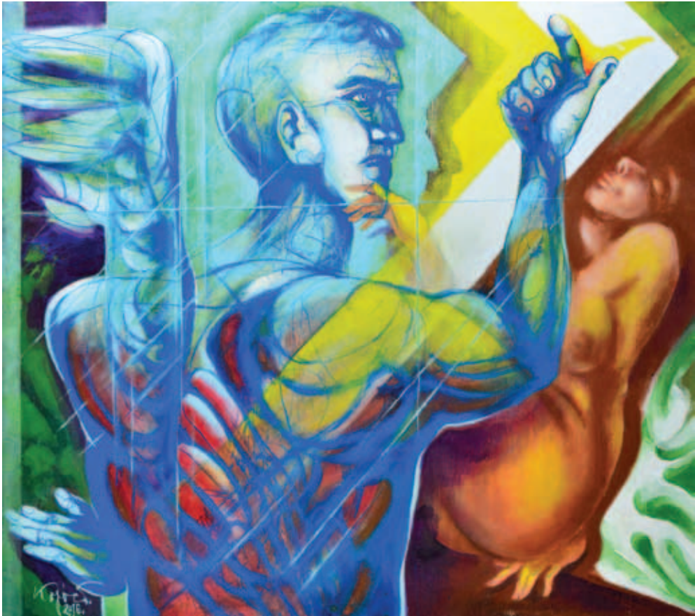
KÓPOCS TIBOR, Az angyal érintése I-II. – Tisztelet Szalay Lajosnak, (2x) 2016, akril, vászon, 80x90 cm