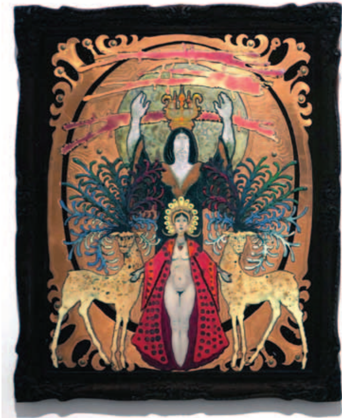
KOPÓCSY TIBOR, Mária gyermekkel, 2000, tűzzománc, 37x25 cm; Ösmítoz, 1997, tűzzománc, 49x39 cm