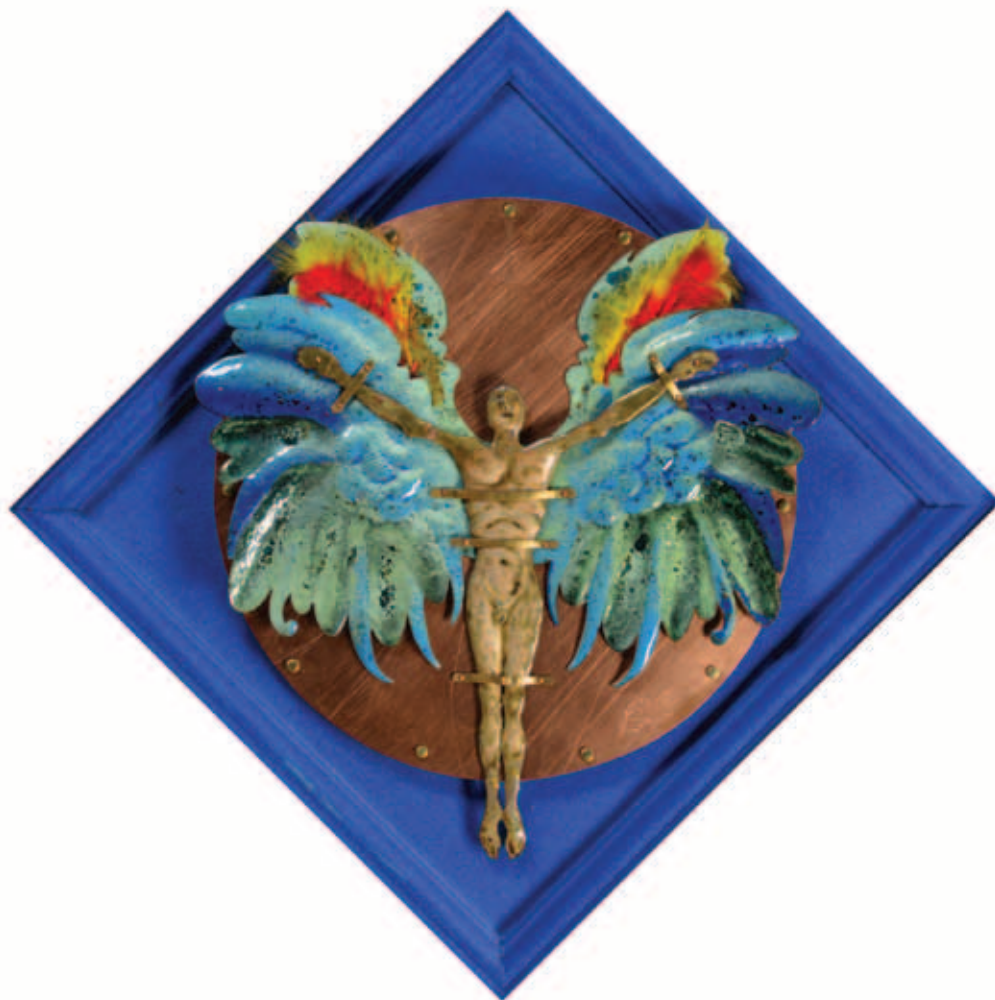
KOPÓCS TIBOR, Madárember I. és III., 1997, tűzzománc, 46x36 cm; 40x37 cm