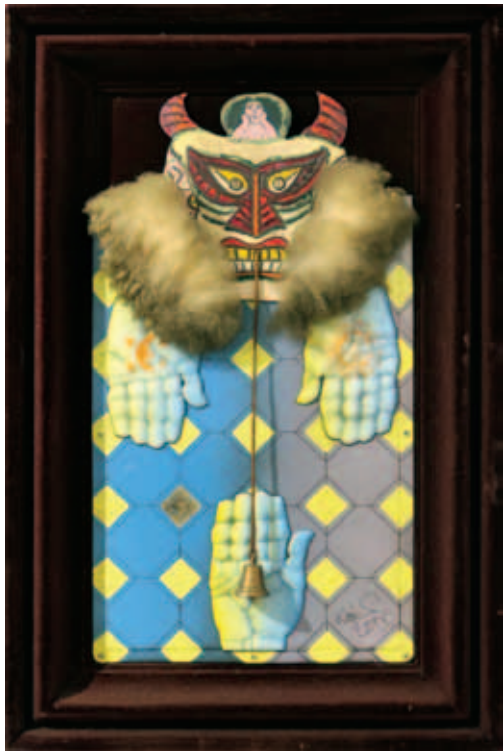
KOPÓCS TIBOR, Utolsó vacsora – Lőcsei Pál Mester tiszteletére, 2000, 57x57,5 cm; Busó I-II., (2x) 1999, tűzzománc, 50x33 cm; 50x31 cm