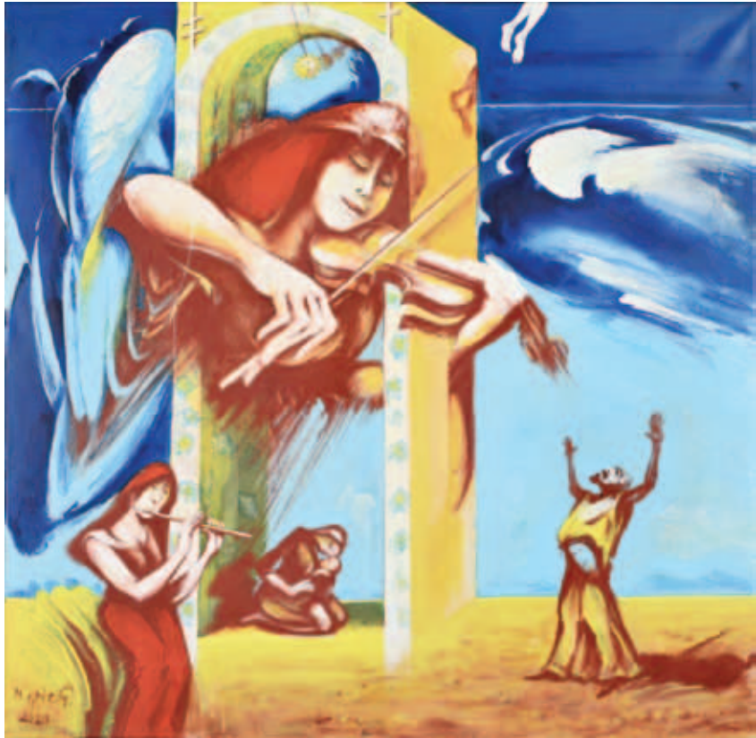
KORPÓCS TIBOR, Csillagkapu – Psalmus, 2020, akril, vászon, 80x80 cm; Csillagkapu – Halleluja, 2022, akril, vászon, 50x60 cm