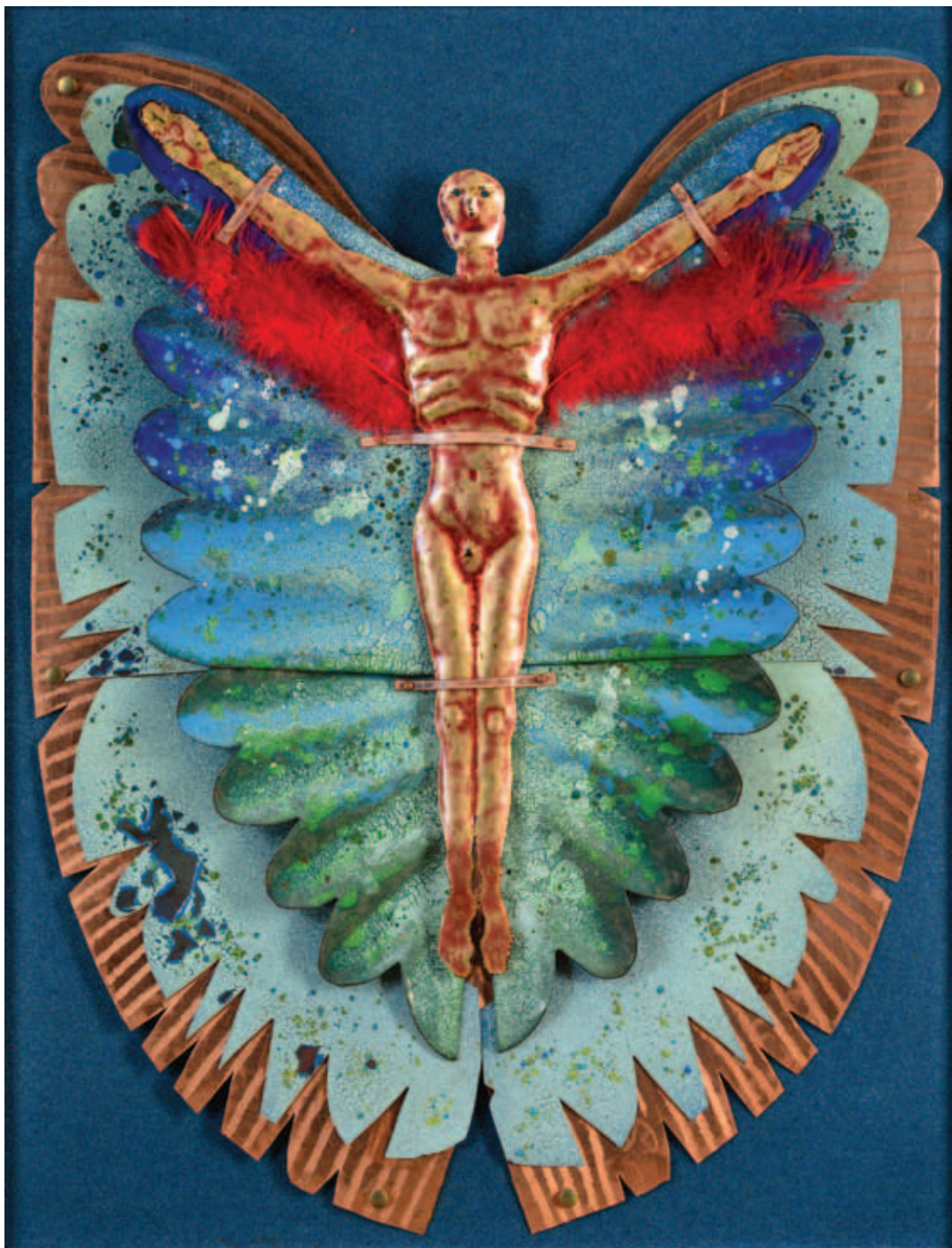
KOPÓCS TIBOR, Madárember II., 1997, tűzzománc 40x36 cm