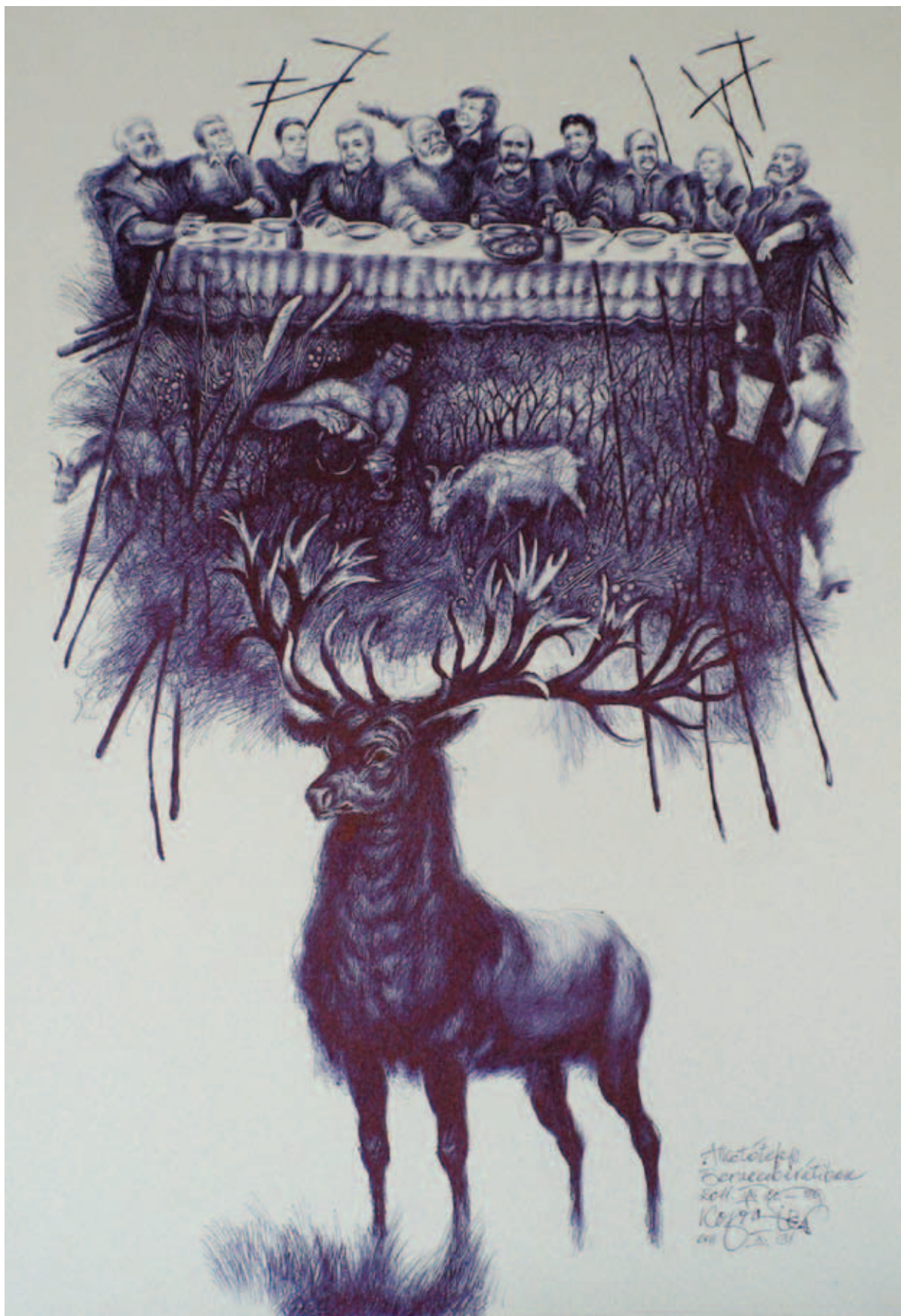
KOPÓCS TIBOR, „Utolsó vacsora” – Bernecebaráti alkotótelepen, 2011, golyóstoll, papír, 61x43 cm