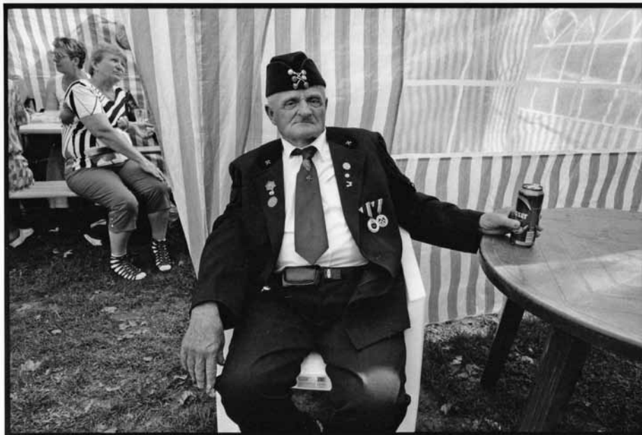
Majális, Budapest, 2013

A kezdeti időszakban a forma érdekelt nagyon, a viszonylag egyszerű formatanulmányok. Ez mai szemmel már nem olyan nagy dolog, de nekem mindig az volt a célom, hogy a fotográfiának minden részét megismerjem – kicsit nagyképpően a totális fotográfia érdekel, amiben benne van a kép szerkezetének rafináltsága, sokfélesége, és legfontosabbak persze azok az emberi megnyilvánulások, amikkel valamit jelezni szeretnék. Ez az, ami érdekelt: az ember és környezetének sajátos, dokumentatív ábrázolása.” 6