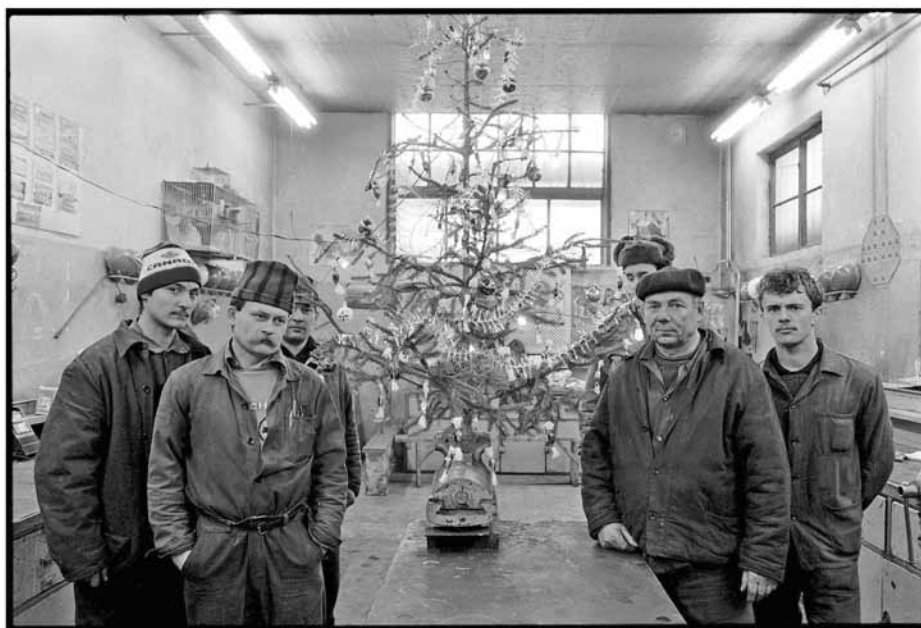
BENKŐ IMRE, Csőszereelő műhely, Ózd, 1989

A rétyi kép egyszerre szimmetrikus – minden fotós, művész tudja, hogy a szimmetriával óvatosan kell bánni – és aszimmetrikus. Ez adja a feszültségét. És ez sok Benkő-képre érvényes, de az alábbira különösen.