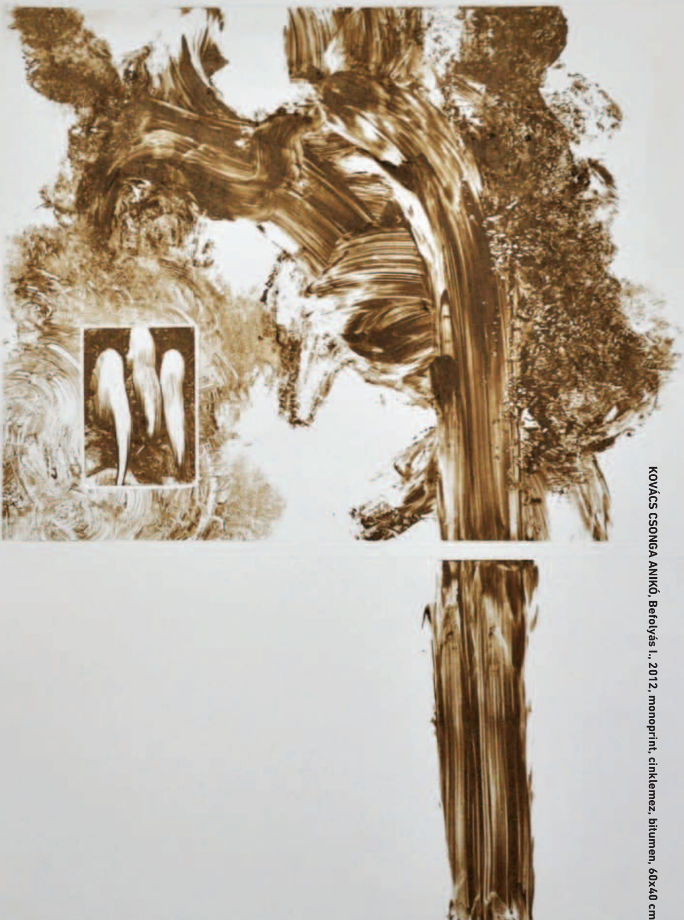
KOVÁCS CSONGA ANIKÓ, Befolyás I., 2012, monoprint, cinklemez, bitumen, 60x40 cm