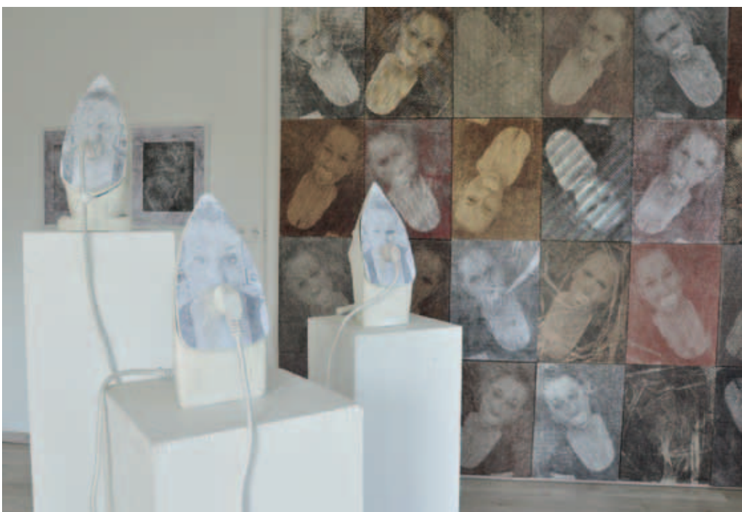
KOVÁCS CSONGA ANIKÓ, Identitás, 2023, kombinált technika, linómetszet, monotíпия, geotextília, ruhafogasok, állvány, 150x100x50 cm; Vekerdy megmondta!, 2023, installáció, elektromos vasalók három grafikai objektummal és csatlakozó zsinórral, kb. 150x100x80 cm (részlet)