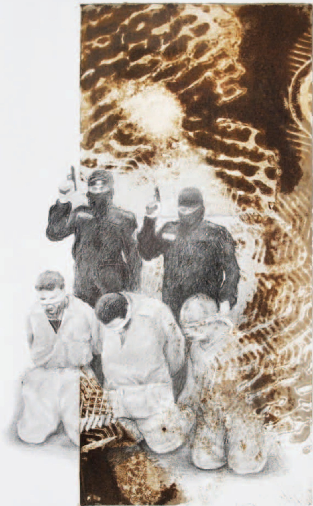
1/1 "ISIS" - "MIGRÁNS-SÓKK" Bonyházi