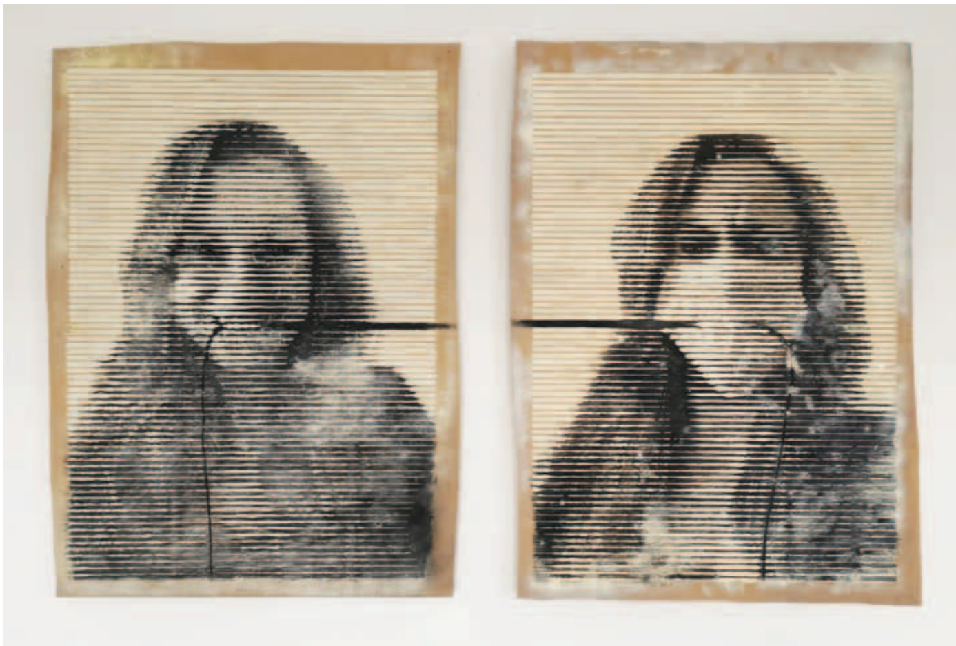
KOVÁCS CSONGA ANIKÓ, Változás (Diptichon), 2022, linómetszet-objektum, spray, szén, (2x) 109x78; Deformációk (Triptichon), 2021, linómetszet, transzparens hordozóanyagok vakramákra feszítve, (3x) 100x70 cm