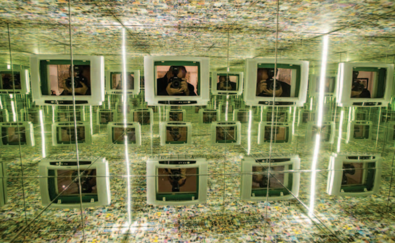
KOVÁCS CSONGA ANIKÓ, A média ereje – Manipuláció, 2013, tükrök, digitális grafikai kollázs, tv-monitordoboz, bútorlapok, 100x100x200 cm (belső tér); Konsumtársadalom – Egzisztencia, 2016, installáció, számlapapírok, ruhák, öltözködési kellékek, ragasztóanyagok, kb. 150x120x70 cm; Konsumtársadalom – Pazarlás, 2016, installáció, akril, péksütemények, számlapapírok, bevásárlókosár, kb. 120x120x150 cm