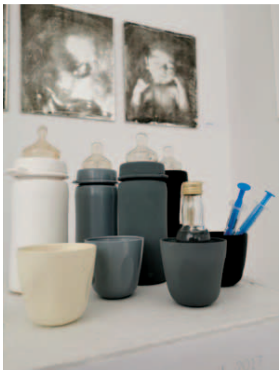
KOVÁCS CSONGA ANIKÓ, Anyaság – Post siparium (Függöny mögött), 2017, grafikai installáció, textilpelenkák, toluén nyomatok vakrámára feszítve, (4x) 56x50 cm Anyaság – Toxikózis, 2017 (részlet); Anyaság – Toxikózis, 2017, installáció, eredeti tárgyak, tej, kávé, cigaretta, alkohol, gyógyszerek, fecskendők tűvel, imitált kábítószer, kb. 30x50x20 cm