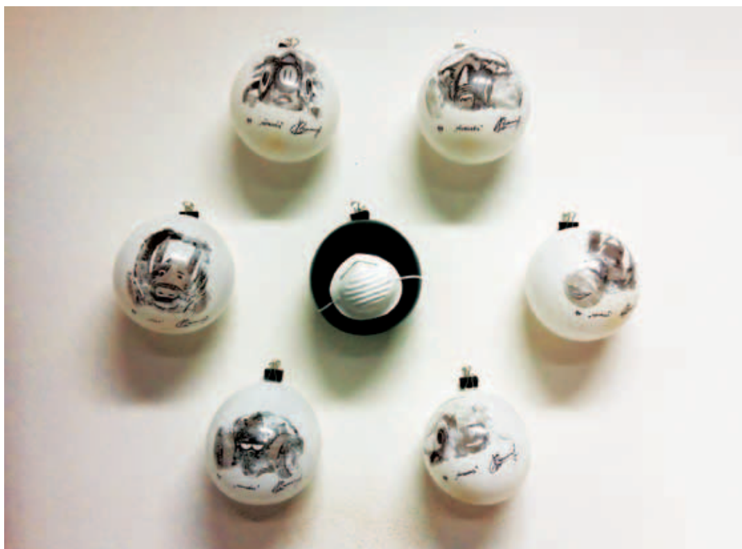
KOVÁCS CSONGA ANIKÓ, Levegő I., 2018, grafikai installáció, szerzői technika, toluén nyomatok léggömbökön, szájmaszk, kb. 120x140x30 cm; Levegő II., 2018, grafikai installáció, gumiabroncsok, toluén nyomatok léggömbökre, kb. 120x220x100 cm