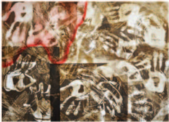
KOVÁCS CSONGA ANIKÓ, Bring back our girls! (Hozzátok vissza lányainkat!) I., 2015, többszöri monoprint, cinklemez, (4x) 57x77 cm; Bring back our girls! (Hozzátok vissza lányainkat!) II., 2015, többszöri monoprint, cinklemez, 60x79 cm