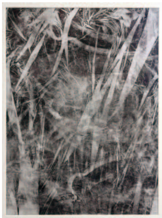
KOVÁCS CSONGA ANIKÓ, Viselet I–II.; V–VI., (4x) 2023, linómetszet, gyermekruhanymatok, papír, geotextília, buborékfólia, fólia keretben 53x43 cm