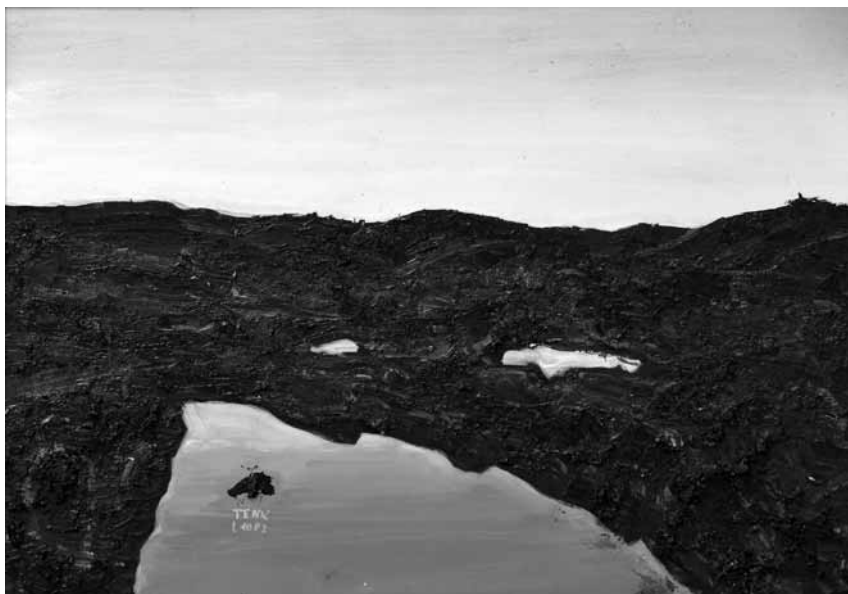
TENK LÁSZLÓ, Alkony II. (Varacszkos kép); 2008, olaj, tempera, farost, 70x100 cm (Mezőtúr Művészeti Közalapítvány)

A megvédett doktori viszonylag gyors nyomdába adásából és a szerkesztetlenségéből számos apró hiba, értelmetlen tagmondat származik (csak példaként egy: „[a nyugat-boszniai Carinban még 1950-ben is kitört a parasztok fegyveres éhséglázadása tört]”; az irodalomjegyzékből hol hiányzik egy-egy adat, hol meg éppen duplán szerepel, bár a visszakereshetőséget ez nemigen nehezíti meg. Az sem zavarja talán az irodalomjegyzéket is végigböngésző olvasót, hogy Vajda Gábor kétkötetes művénel a jegyzékben mindkét helyen (hogy még föltűnőbb legyen, egymás alatt) eszemtörténet szerepel eszmetörténet helyett. Az ilyen hibákat a recenzens hajlamosabb elnézni, mint az esetleges értelemzavaró-megtévesztő elírásokat. ( Társadalomtudományi Kutatóközpont-Kalligram, 2021 )