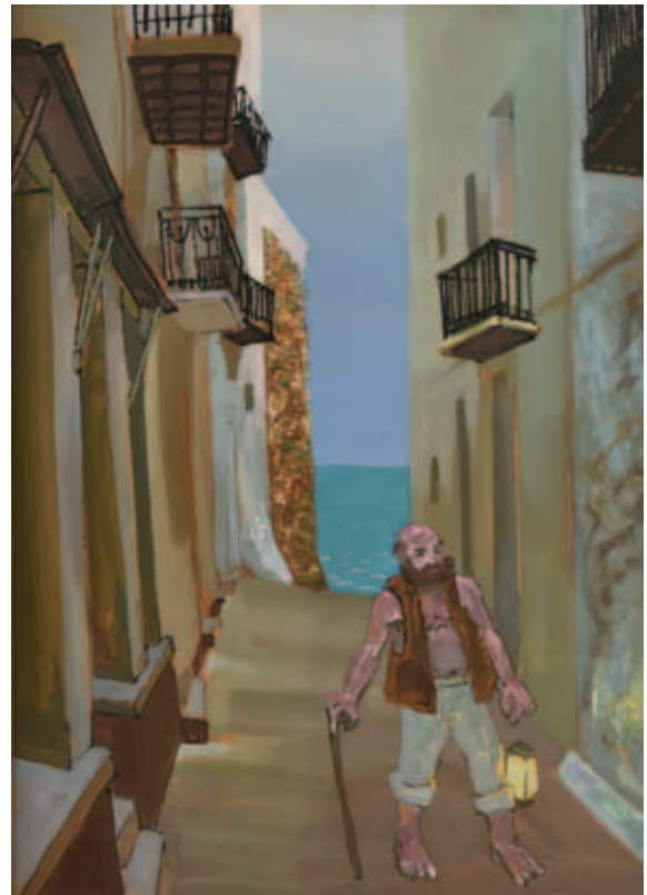
TENK LÁSZLÓ, Akiért verekednek, 1988, olaj, tempera, farost, 83x68 cm (mt.);

Ember lámpással, 1988, olaj, farost, 140x100 cm (Tornyai János Múzeum Képzőművészeti Gyűjteménye, ltsz. 88.30.);