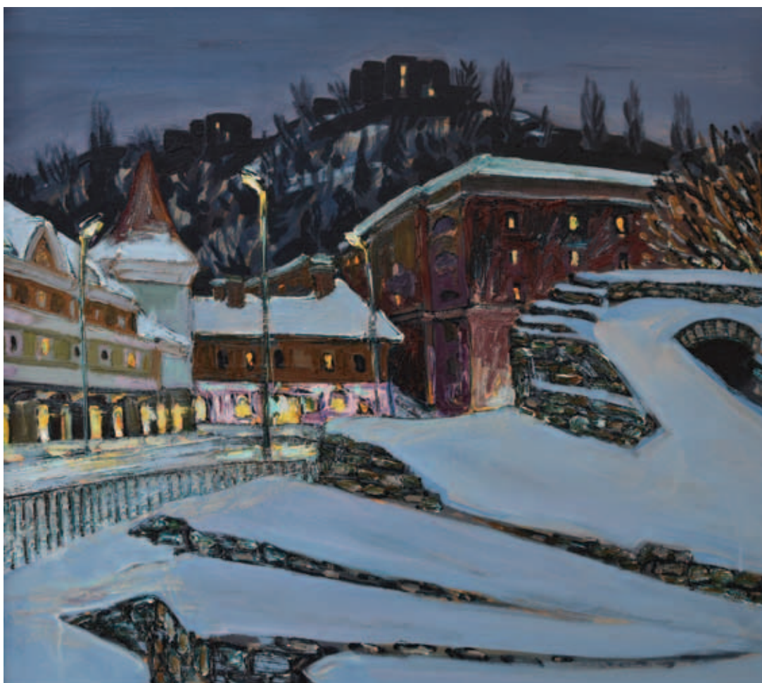
TENK LÁSZLÓ, ...és lent a város, tél, 1998, olaj, tempera, farost, 60x72 cm (mt.); Az amfiteátrum Óbudán, 1997, olaj, tempera, farost, 72x80 cm (mt.)