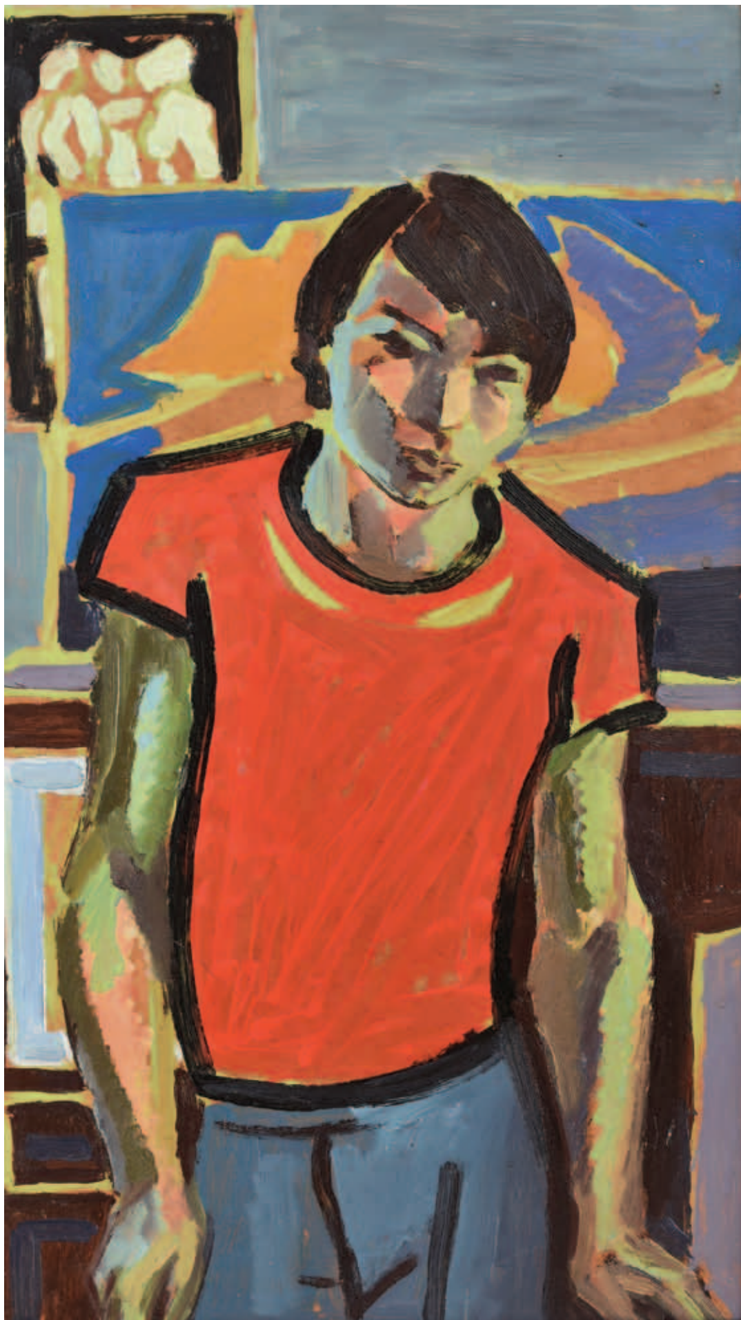
TENK LÁSZLÓ, Önarckép, 1973, olaj, tempera, farost, 69x39 cm