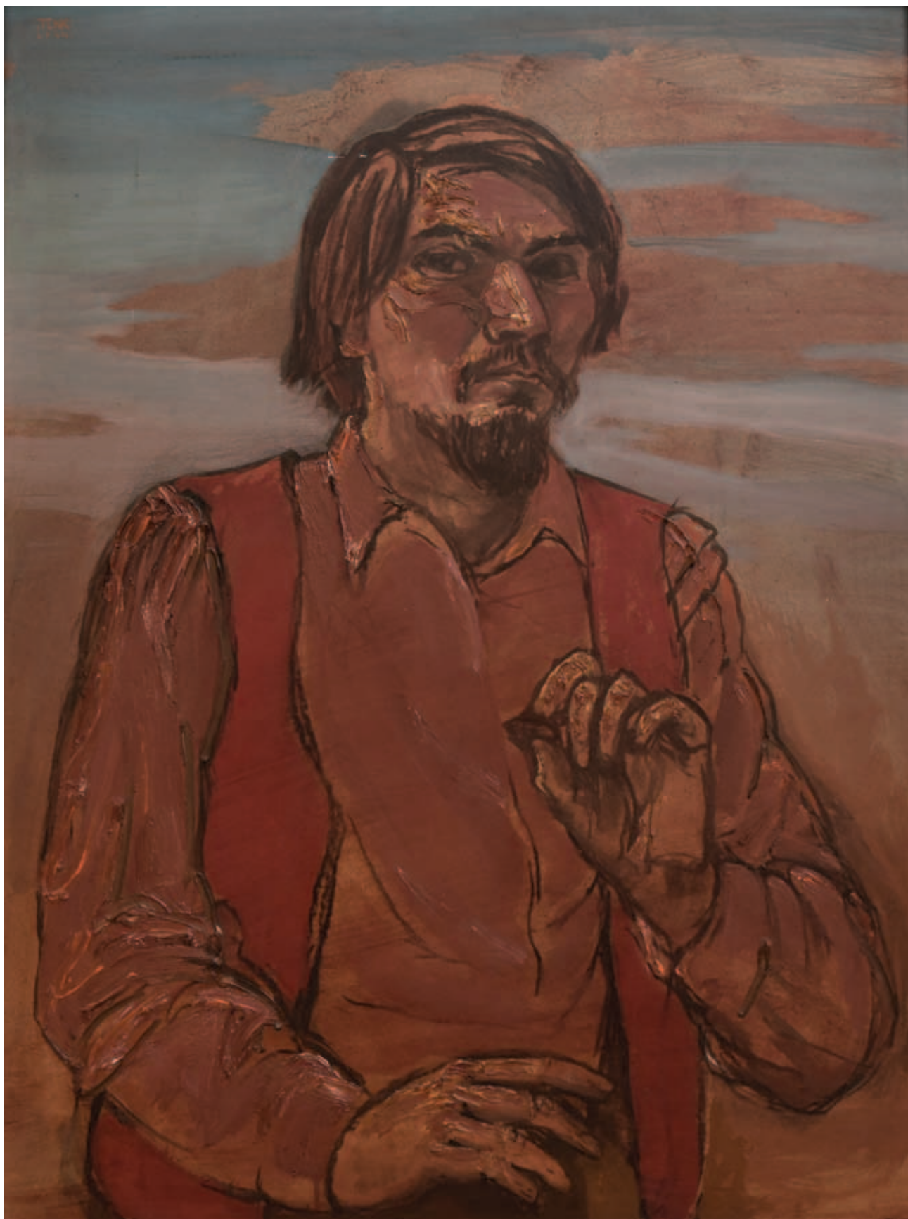
TENK LÁSZLÓ, Önarckép, 1985, olaj, tempera, farost, 90x68 cm