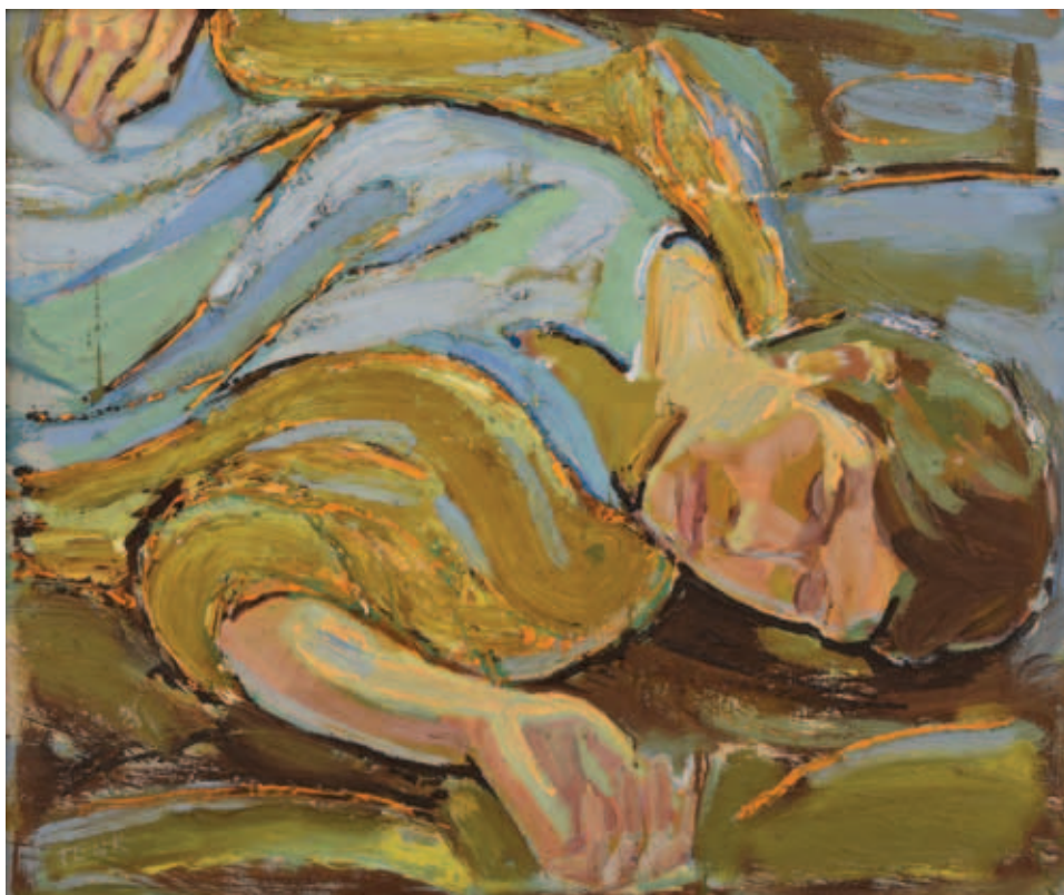
TENK LÁSZLÓ, Kint és bent, 1978, olaj, tempera, farost, 122x115 cm (Tenk Dániel tulajdona); Várandós alvó, 1970, olaj, farost, 59x72 cm