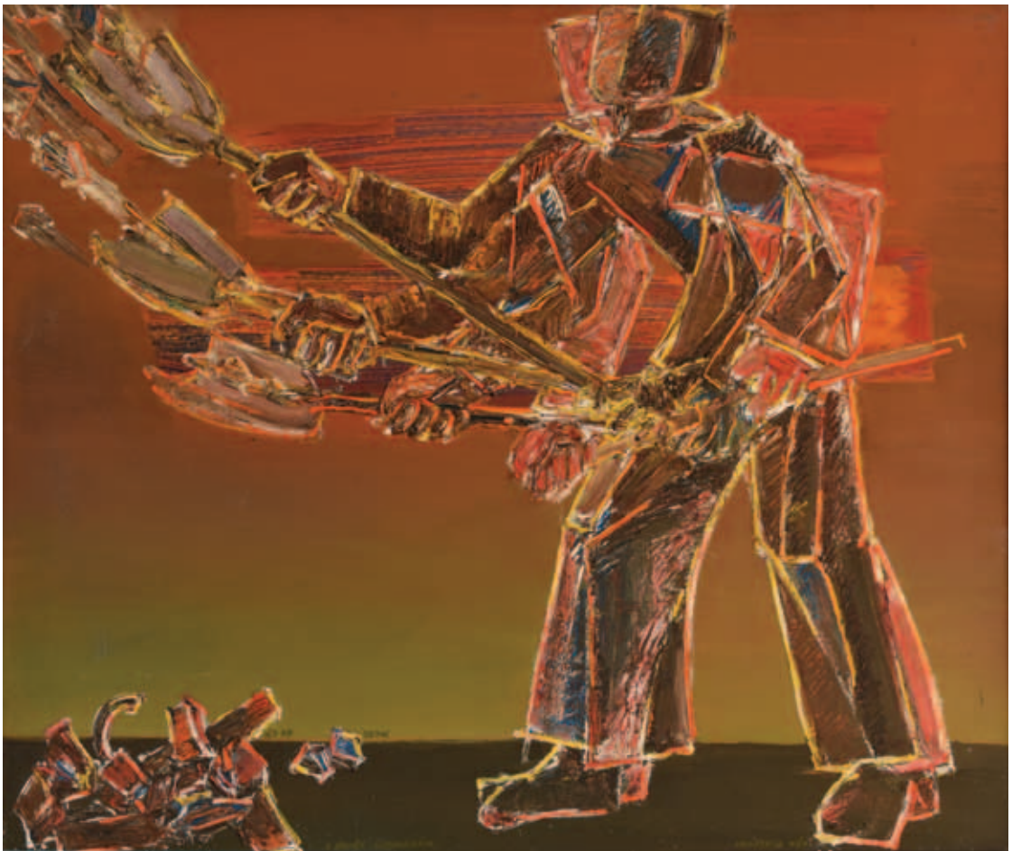
TENK LÁSZLÓ, A szemét eltakarítása, 1976, olaj, tempera, farost, 105x122 cm