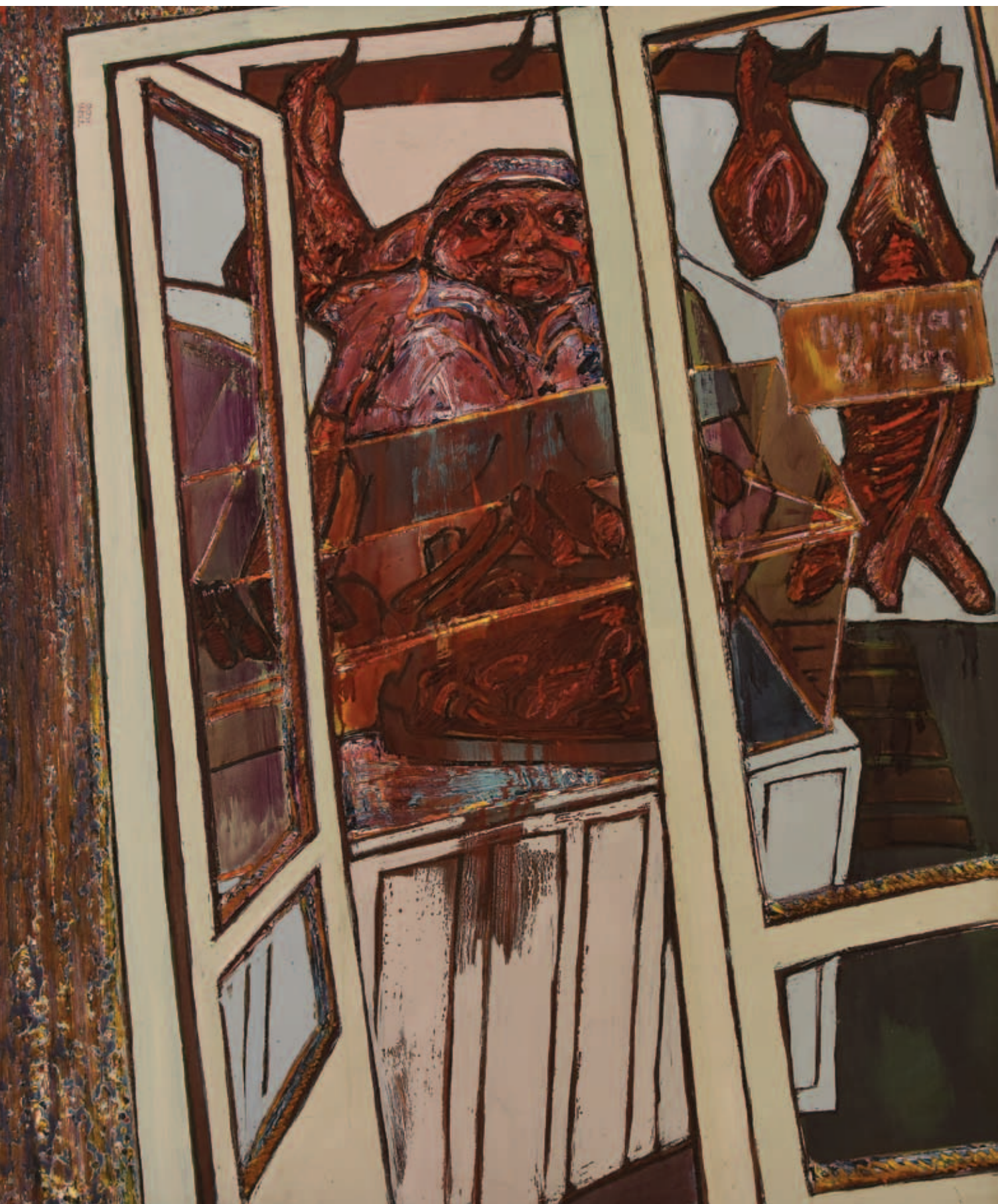
TENK LÁSZLÓ, Hús, 1977, olaj, tempera, farost, 150x125 cm (Déri Múzeum, ltsz. II.79.147.1.)