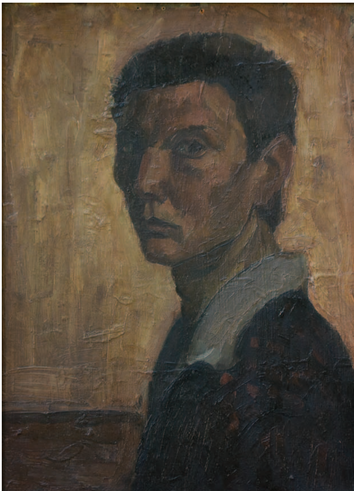
TENK LÁSZLÓ, Önarckép, 1962, olaj, farost, 45x33 cm (Birk család tulajdona)