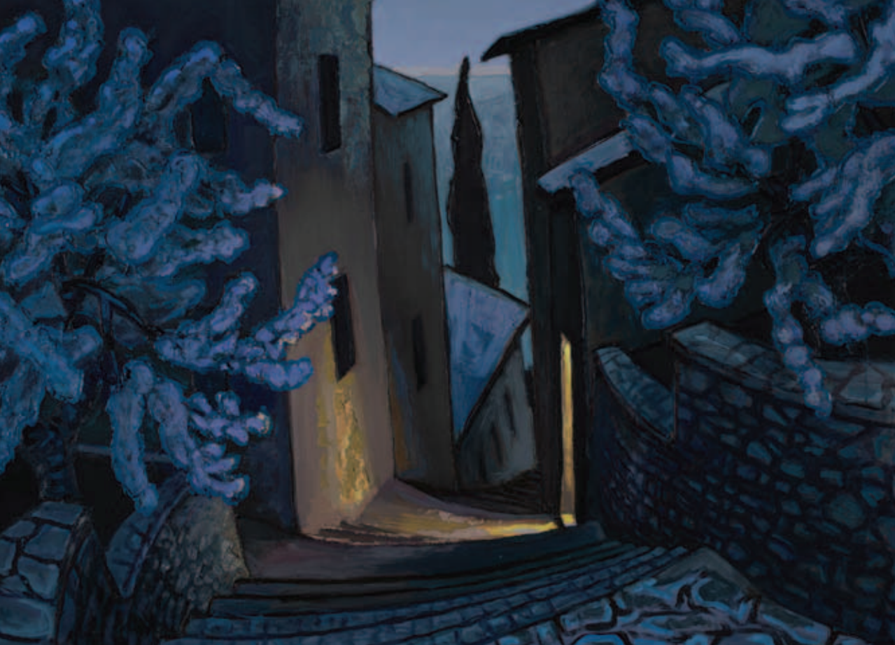
TENK LÁSZLÓ, Lépcső és virágzás, 2023, olaj, tempera, farost, 100x140 cm (Zentai-Schoblocher-gyűjtemény)