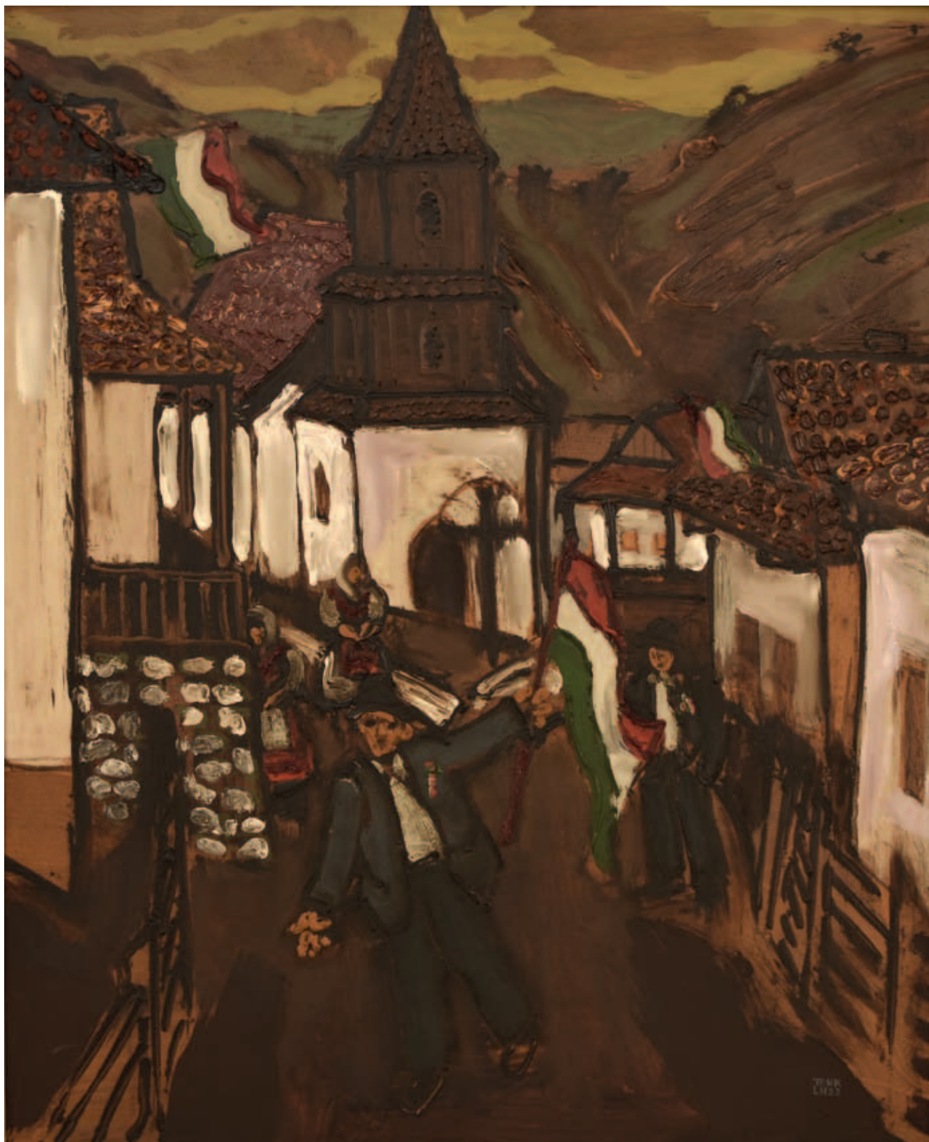
TENK LÁSZLÓ, Tavaszi ünnep Hollókőn, 1984, olaj, tempera, farost, 80x65 cm (Völgyi-Skonda-gyűjtemény)