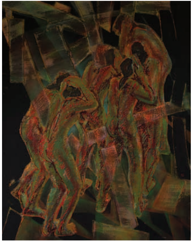
TENK LÁSZLÓ, Dózsa, 1975, olaj, tempera, farost, 122x81 cm; Elűzöttek, 1978, olaj, tempera, farost, 157x125 cm (Damjanich János Múzeum, ltsz. DM 80.47.1.)