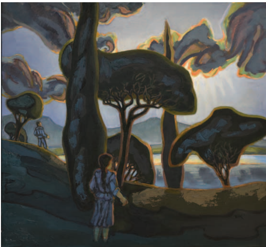
TENK LÁSZLÓ, Ég-szín-tér, 2023, olaj, tempera, vászon, 120x130 cm