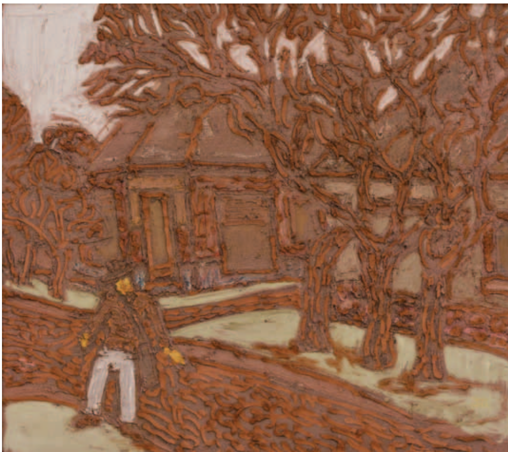
TENK LÁSZLÓ, Az újságkihordó hajnala, 1980, olaj, tempera, farost, 61x69 cm (T-Art Alapítvány tulajdona); Menekülő lány és trubadúr, 1980, olaj, tempera, farost, 58x75 cm (Tenk Éva tulajdona)