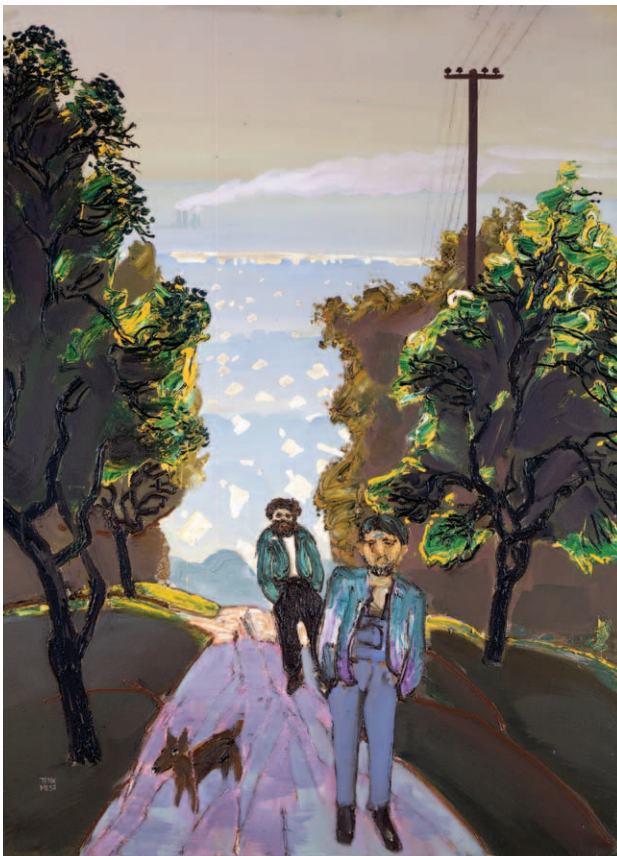
TENK LÁSZLÓ, Hajnali kódorgók, 1991, olaj, vászon, 150x110 cm (Damjanich János Múzeum, ltsz. DM 2001.7.1.)