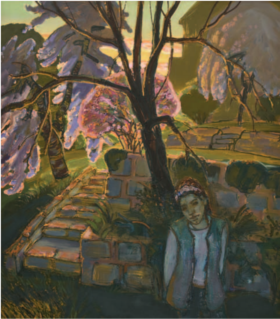
TENK LÁSZLÓ, Kert, lány, alkony, 1990, olaj, tempera, farost, 135x120 cm; Tavaszi este és egy filozófus, 1990, olaj, tempera, farost, 60x70 cm (Oláh András tulajdona)