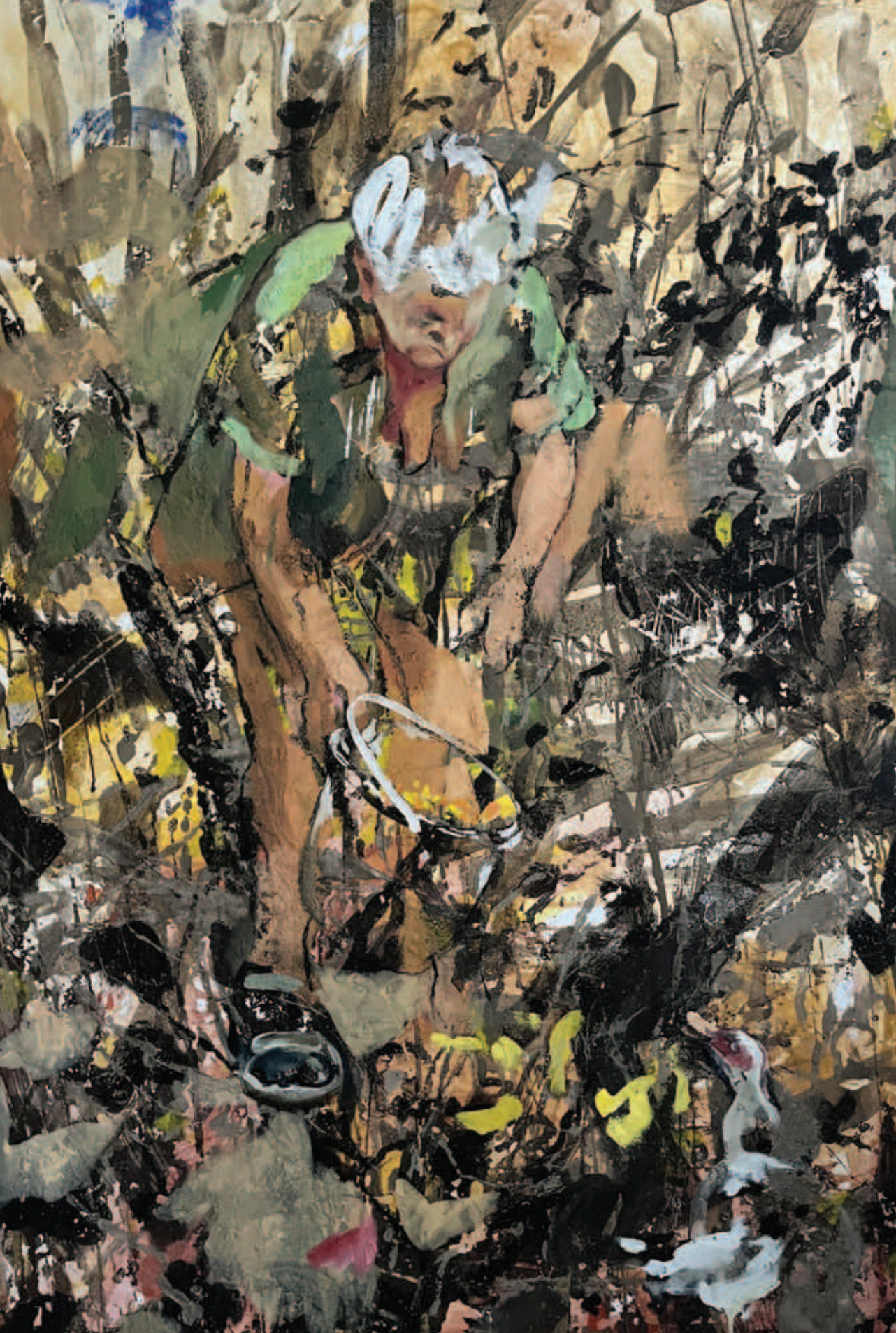
M. KISS MÁRTA, Anyu eteti a kiskacsáit, 2022, 150x100 cm ▲ Körike megtanított csibét forrázni, 2022, 150x100 cm ►