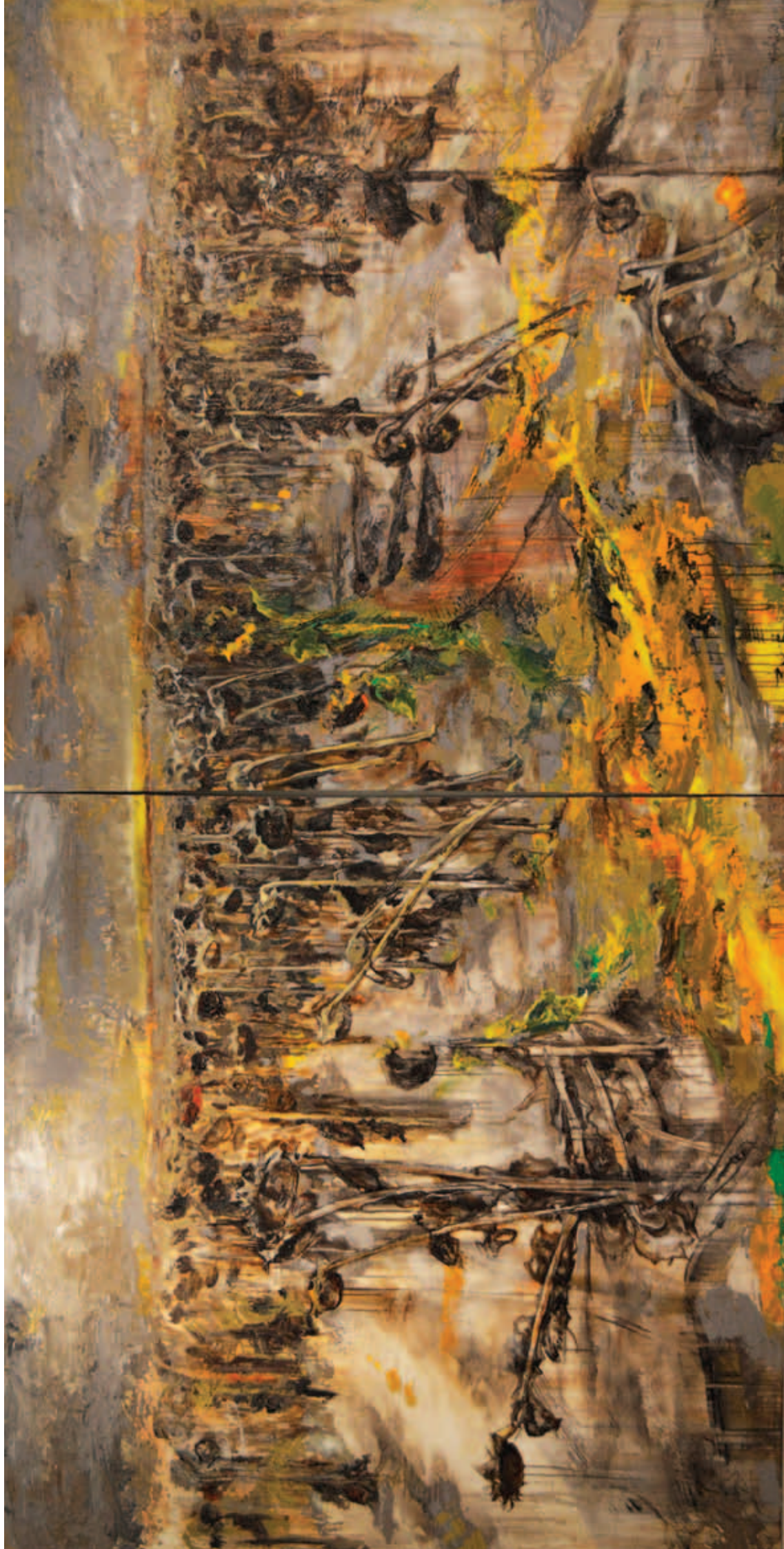
M. KISS MÁRTA, Remény, 2017, vegyes technika, vászon, 200x400 cm; Remény nélkül (LA [USA] utazás után), 2018, vegyes technika, vászon, 200x300 cm (51. oldal)