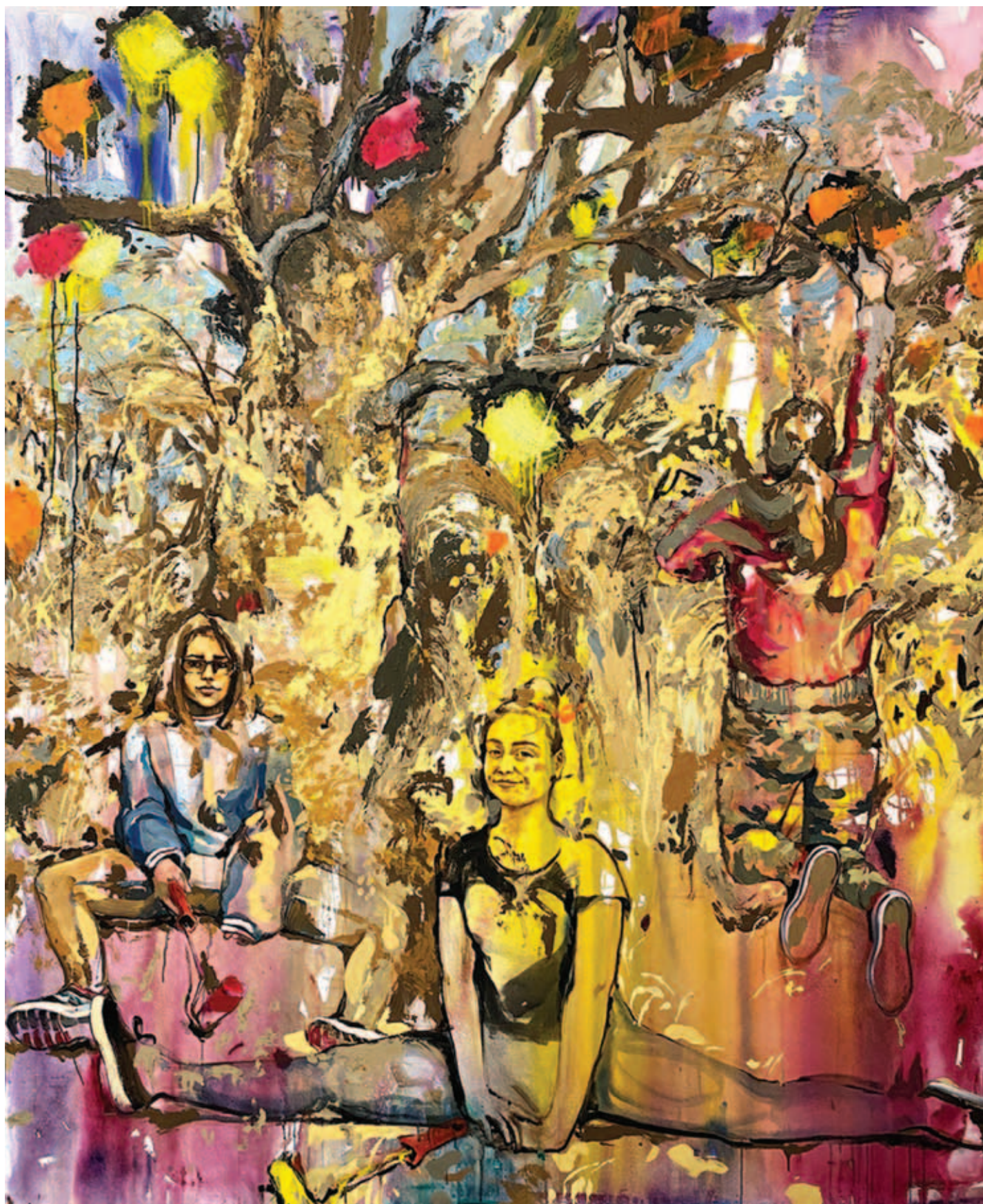
M. KISS MÁRTA, Készek vagyunk , 2021, vegyes technika, vászon, 240x200 cm