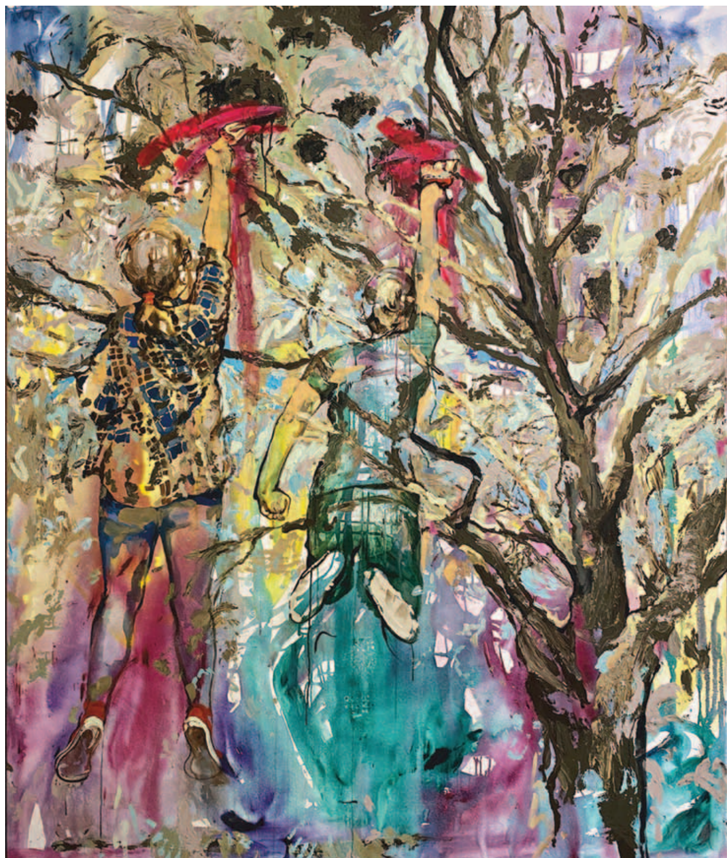
M. KISS MÁRTA, Elérjük!, 2021, vegyes technika, vászon, 240x200 cm