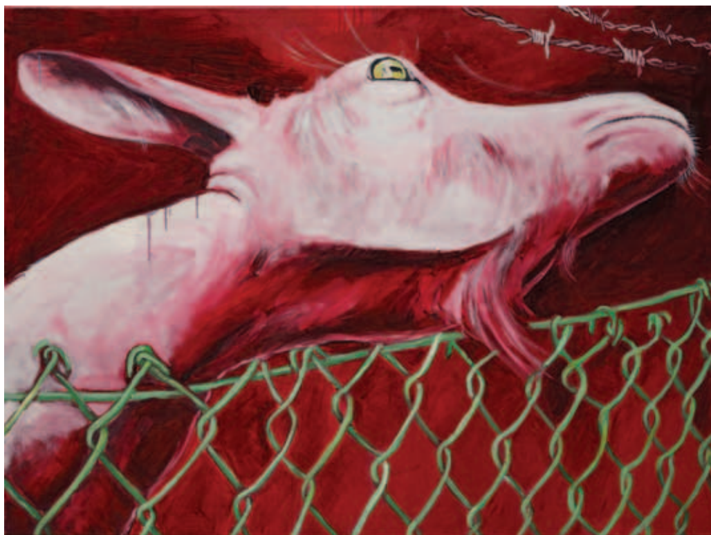
UTA HEINECKE, Építési intézkedés, 2019, olaj, vászon, 90x120 cm; Ezüst esküvő, 2019, olaj, vászon, 80x100 cm