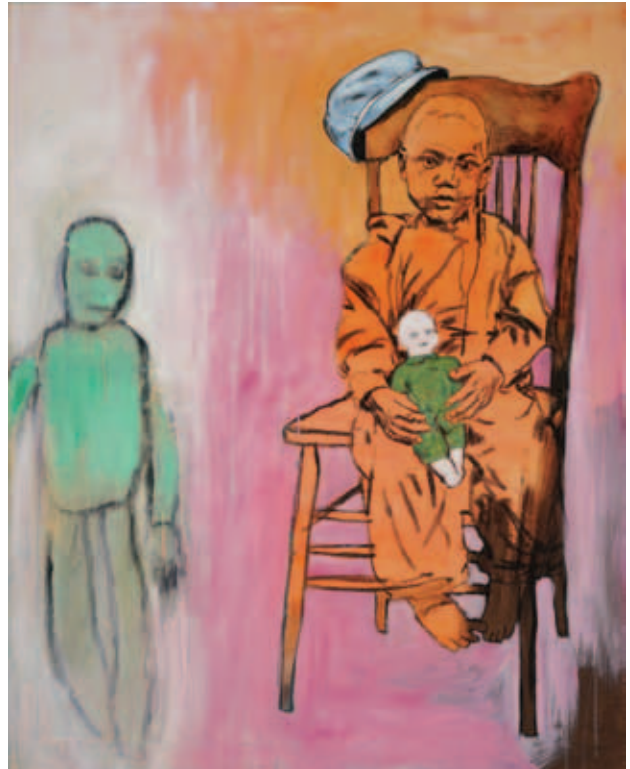
UTA HEINECKE, Drága barátom!, 2020, akril, vászon, 100x80 cm; A múlt idők szelleme, 2020, akril, vászon, 100x80 cm