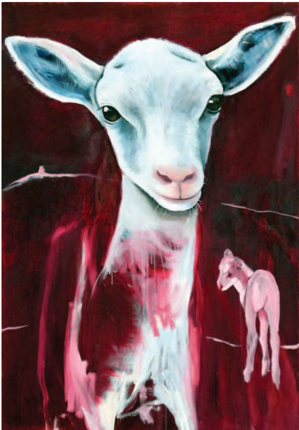
UTA HEINECKE, Ártatlan , 2019, olaj, vászon, 130x90 cm

◀ UTA HEINECKE, Virágzik az Encián , 2019, olaj, vászon, 155x110 cm