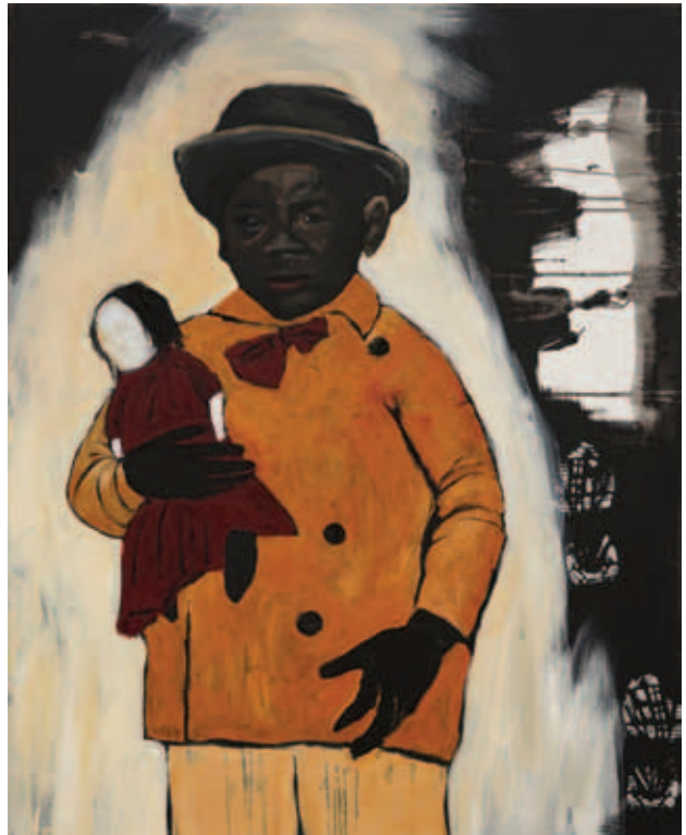
UTA HEINECKE, Játszótársak, 2020, akril, vászon, 100x80 cm; Johnny Boy, 2020, akril, vászon, 100x80 cm