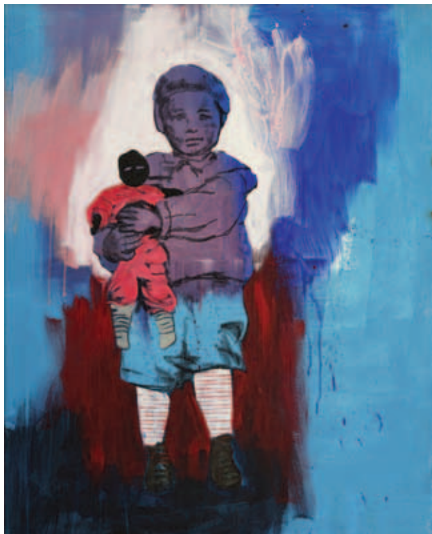
UTA HEINECKE, Hey Bro , 2019, akril, vászon, 100x80 cm; Ugyanolyan zoknink van , 2020, akril, vászon, 100x80 cm