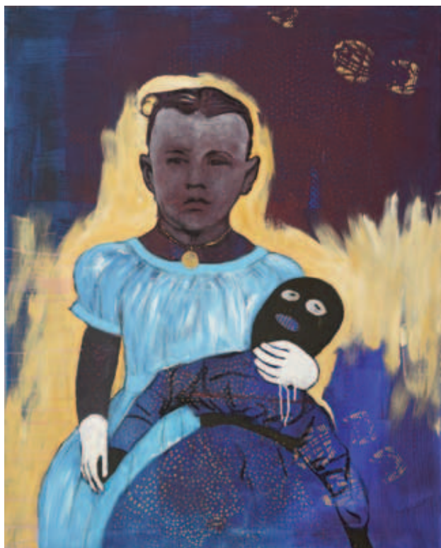
UTA HEINECKE, Kis Donald , 2020, akril, vászon, 100x80 cm; Magányos lány , 2020, akril, vászon, 100x80 cm