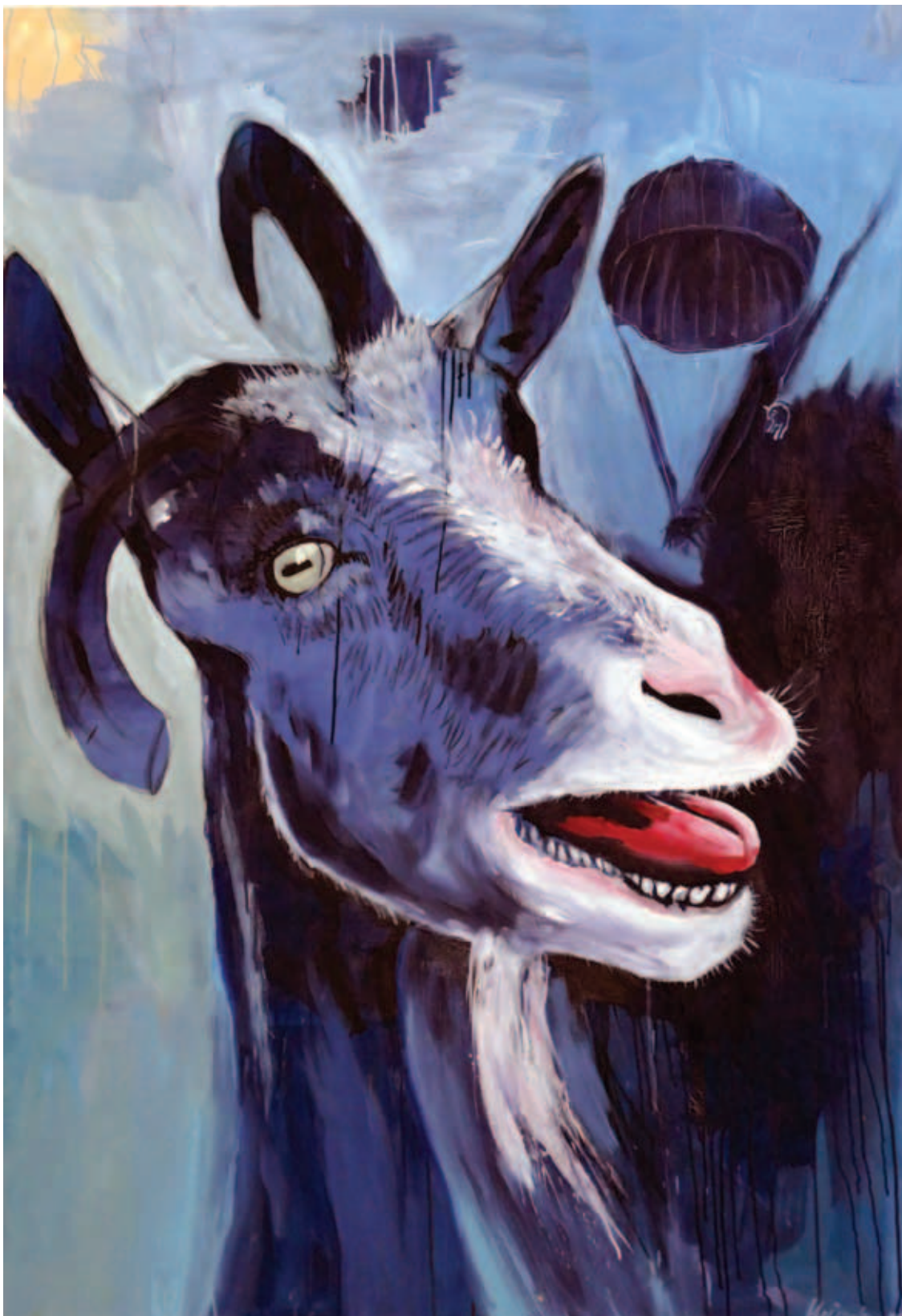
UTA HEINECKE, Önarckép, 2018, olaj, vászon, 160x110 cm