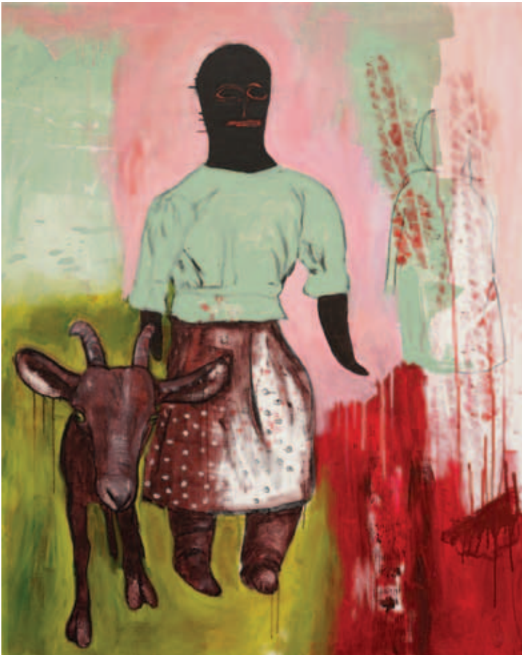
UTA HEINECKE, A hercegre várva, 2019, akril, vászon, 150x120 cm; Heidi és Péter, 2019, akril, vászon, 150x120 cm