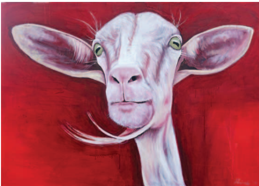
UTA HEINECKE, Azt látom, amit te nem látsz , 2019, olaj, vászon, 110x155 cm; Kék, kék, kék (Diptichon) , 2019, olaj, vászon, 240x340 cm