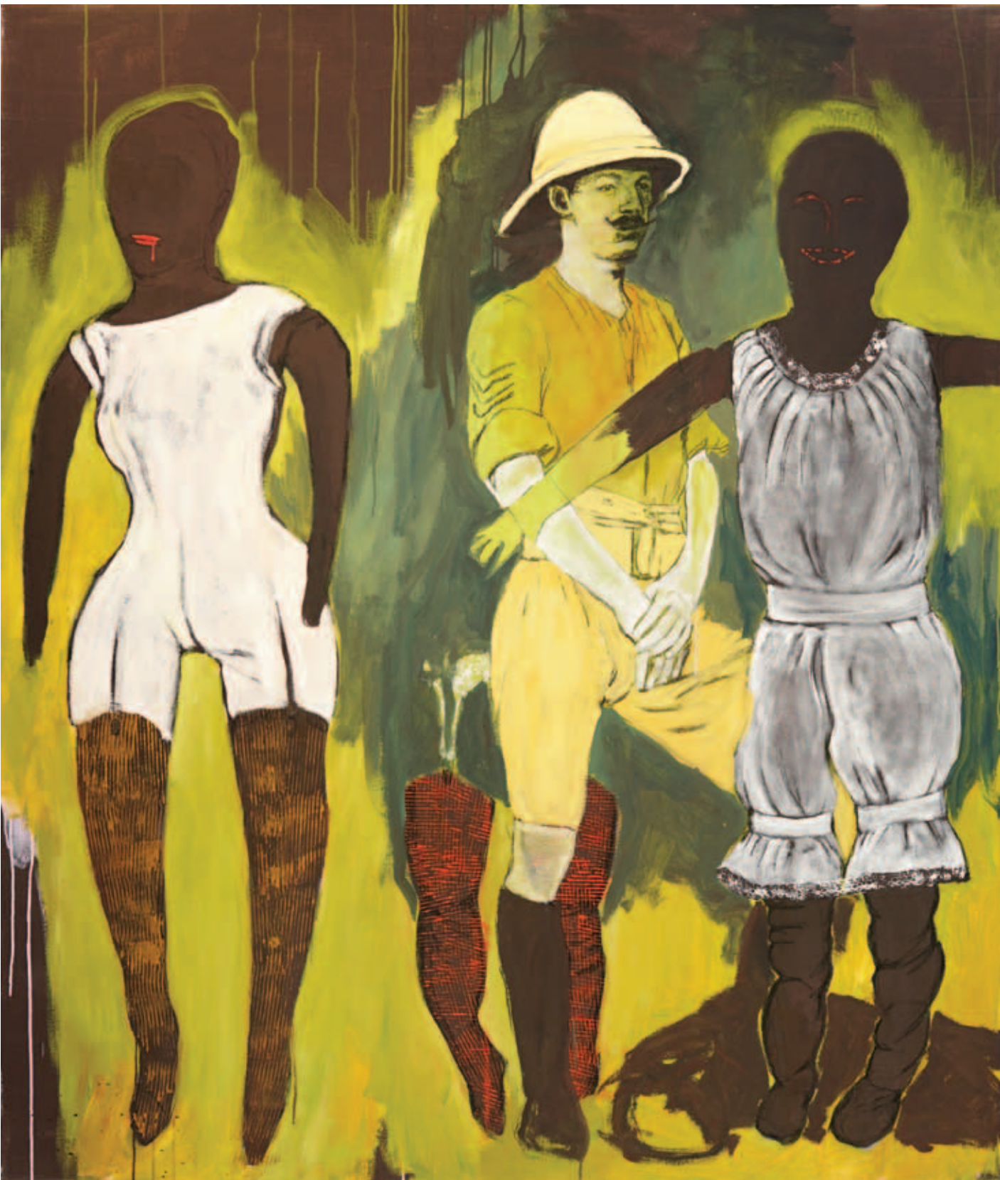
UTA HEINECKE, Nagyvad vadász, 2020, akril, vászon, 200x170 cm

◀ UTA HEINECKE, A besúgó, 2021, akril, vászon, 200x100 cm