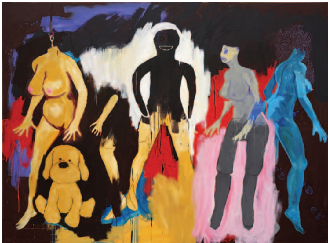
UTA HEINECKE, Játzóársak (szexbabák) , 2021, akril, vászon, 200x260 cm