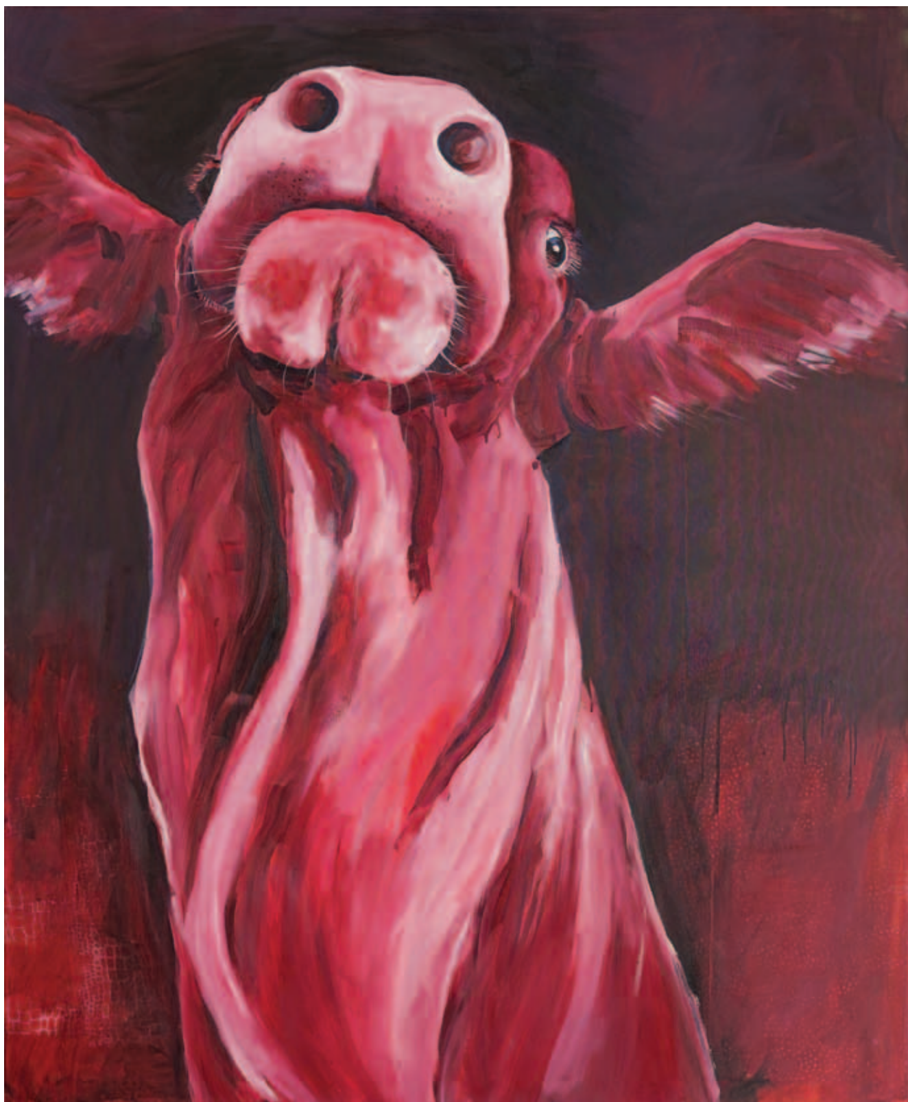
UTA HEINECKE, Lenézek rátok, 2021, olaj, vászon, 140x170 cm

UTA HEINECKE, Csókolj!, 2019, olaj, vászon, 155x110 cm ►