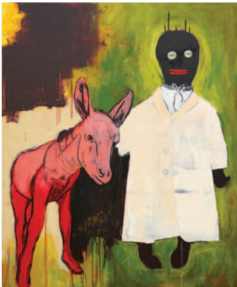
UTA HEINECKE, A dilis doktor, 2019, akril, vászon, 120x100 cm; Hentes, 2019, akril, vászon, 120x100 cm