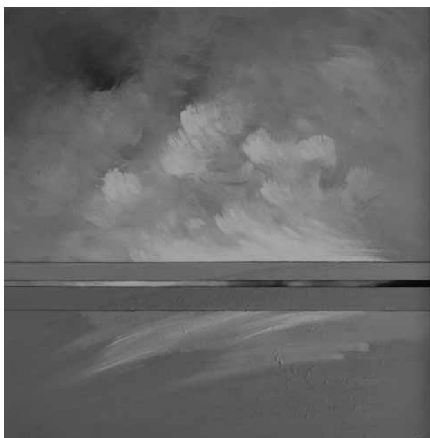
NAGY KÁLMÁN, Mistral, 2020, olaj, farost, 80x80 cm