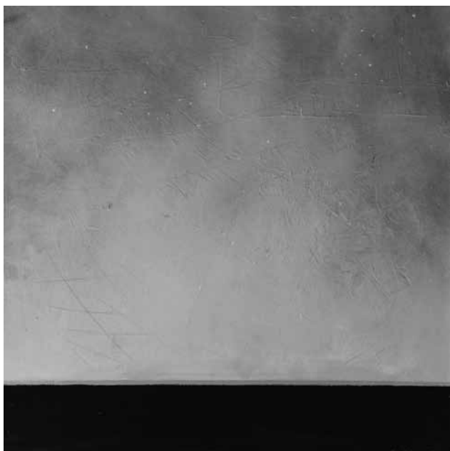
NAGY KÁLMÁN, Navigare, 2019, olaj, farost, 80x80 cm