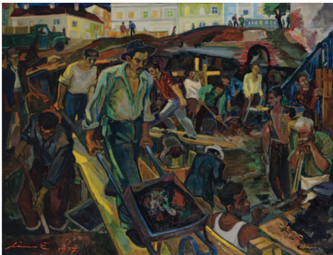
SIMON ENDRE, Építkezés, 1960/1977, olaj, vászon, 140 × 182 cm (a diplomamunka másolata)