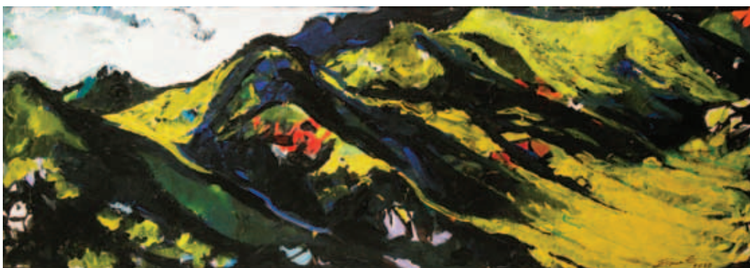
SIMON ENDRE, Kikötő; Amfiteátrum; Szikes táj; Sárga domboldal, (4 x) 2020, akril, farostlemez, 50 x 140 cm