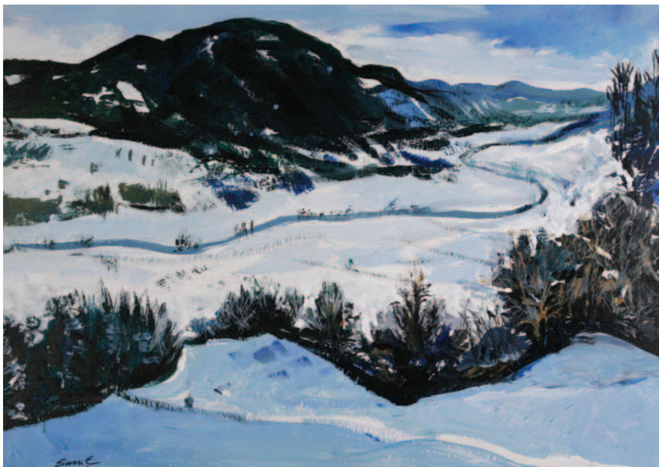
SIMON ENDRE, Ér mentén , 2020, akril, karton, 70 × 100 cm; Olvadás , 2020, akril, karton, 70 × 100 cm