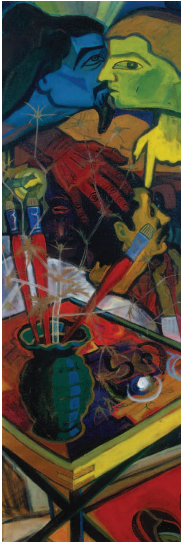
SIMON ENDRE, Az idő és én , 1962, olaj, karton, 100 × 35 cm; Intrika , 1962, olaj, farostlemez, 138 × 55 cm