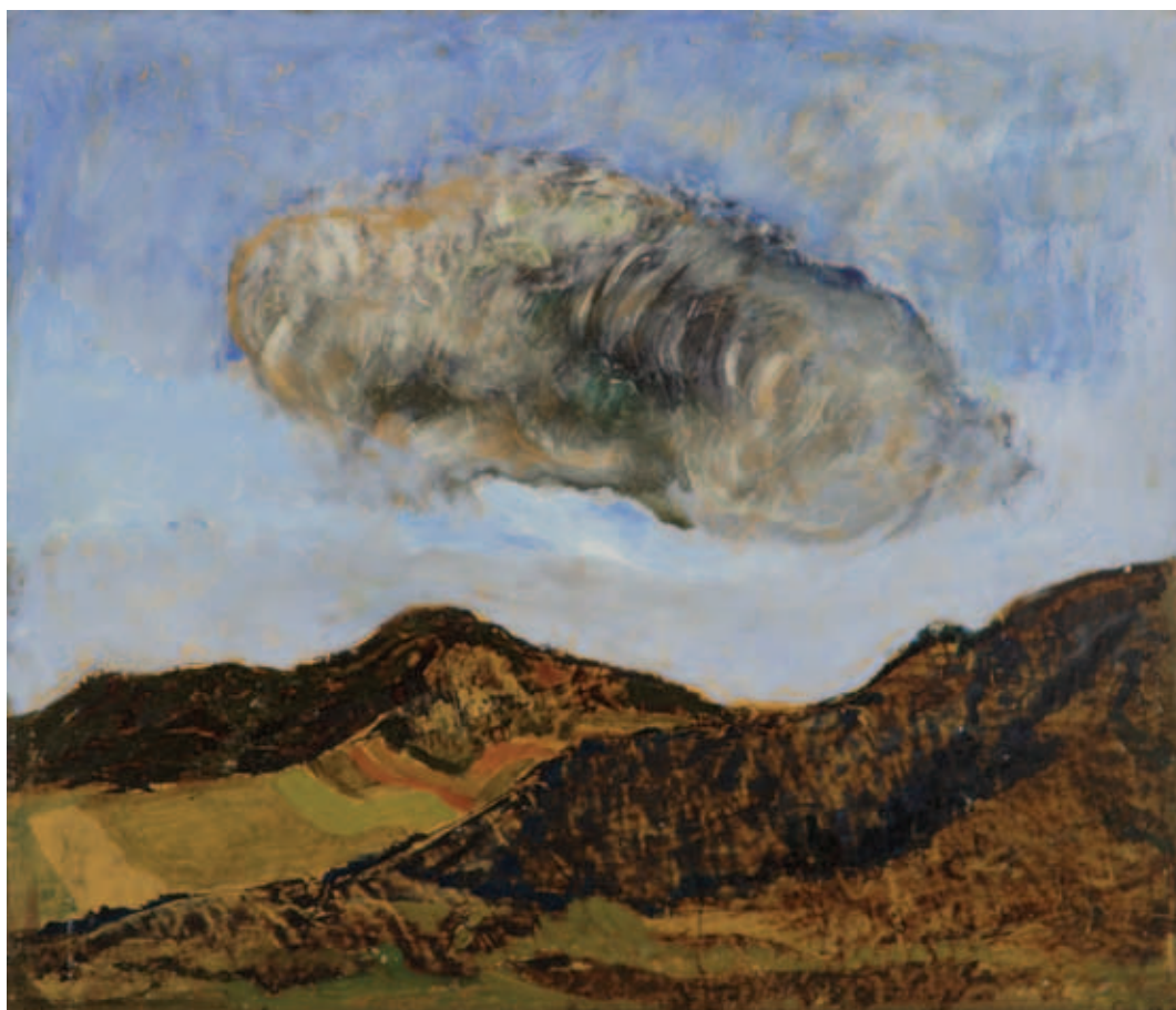
SIMON ENDRE, Felhő, 1998, olaj, farost, 48 x 56 cm; Ködben, 1980, olaj, farostlemez, 48 x 61 cm