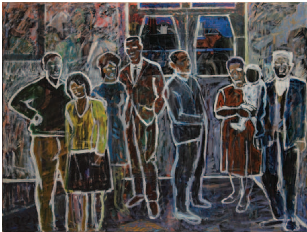
SIMON ENDRE, Családom a kapualjban, 1964, olaj, vászon, 138 × 181 cm