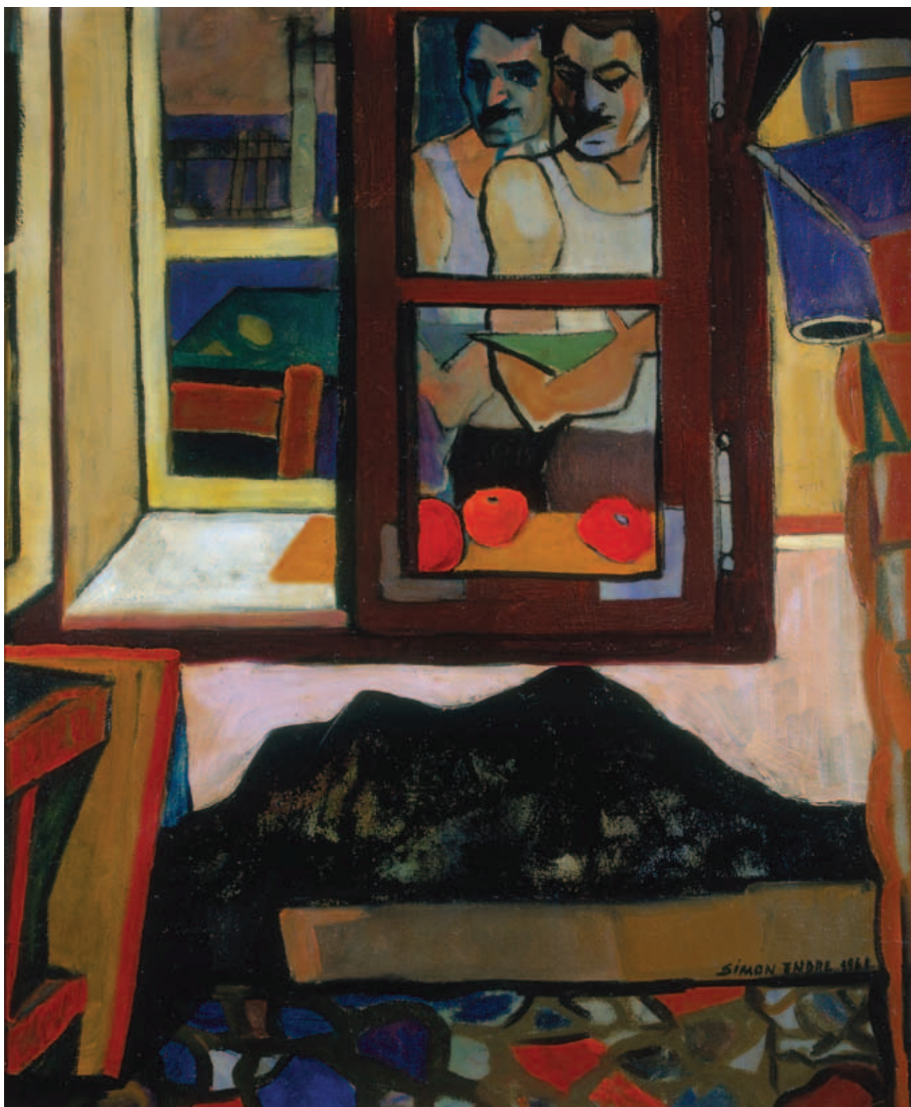
SIMON ENDRE, Önarckép egy öreg ház ablakából, 1961, olaj, vászon, 77 x 64 cm