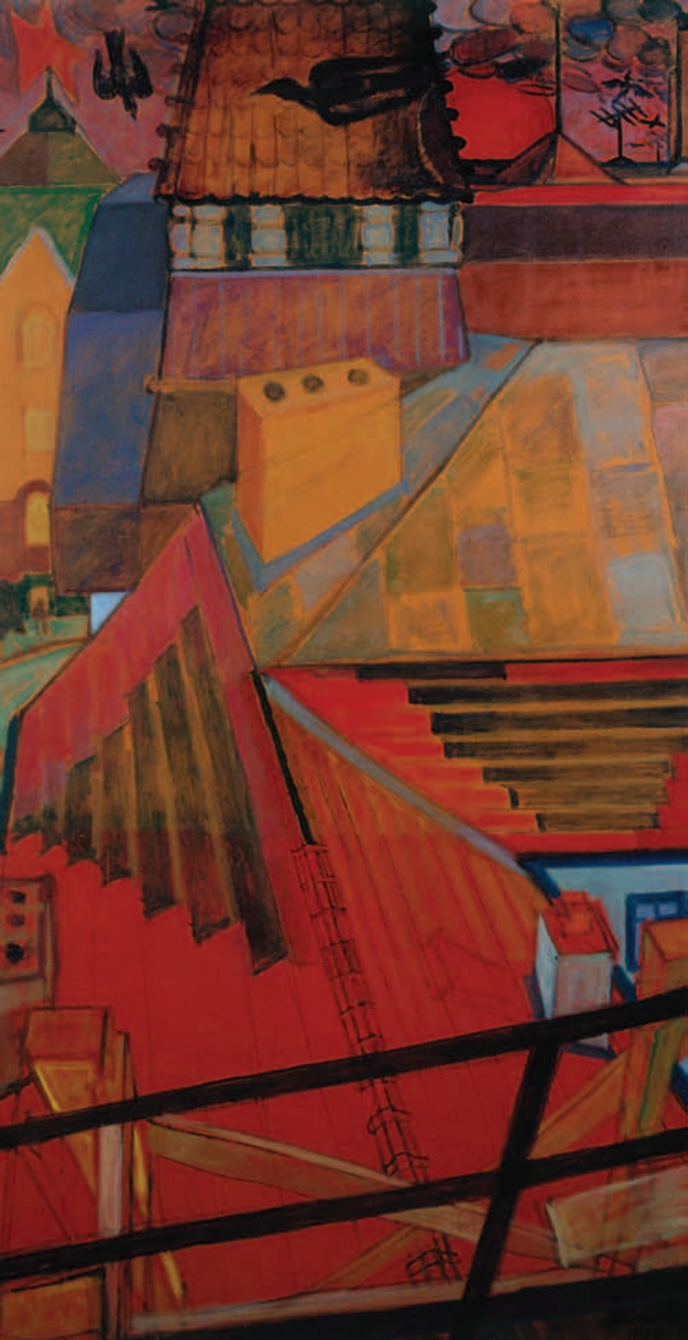
SIMON ENDRE, Rém madarak keringője, olaj, farostlemez, 160 x 91 cm