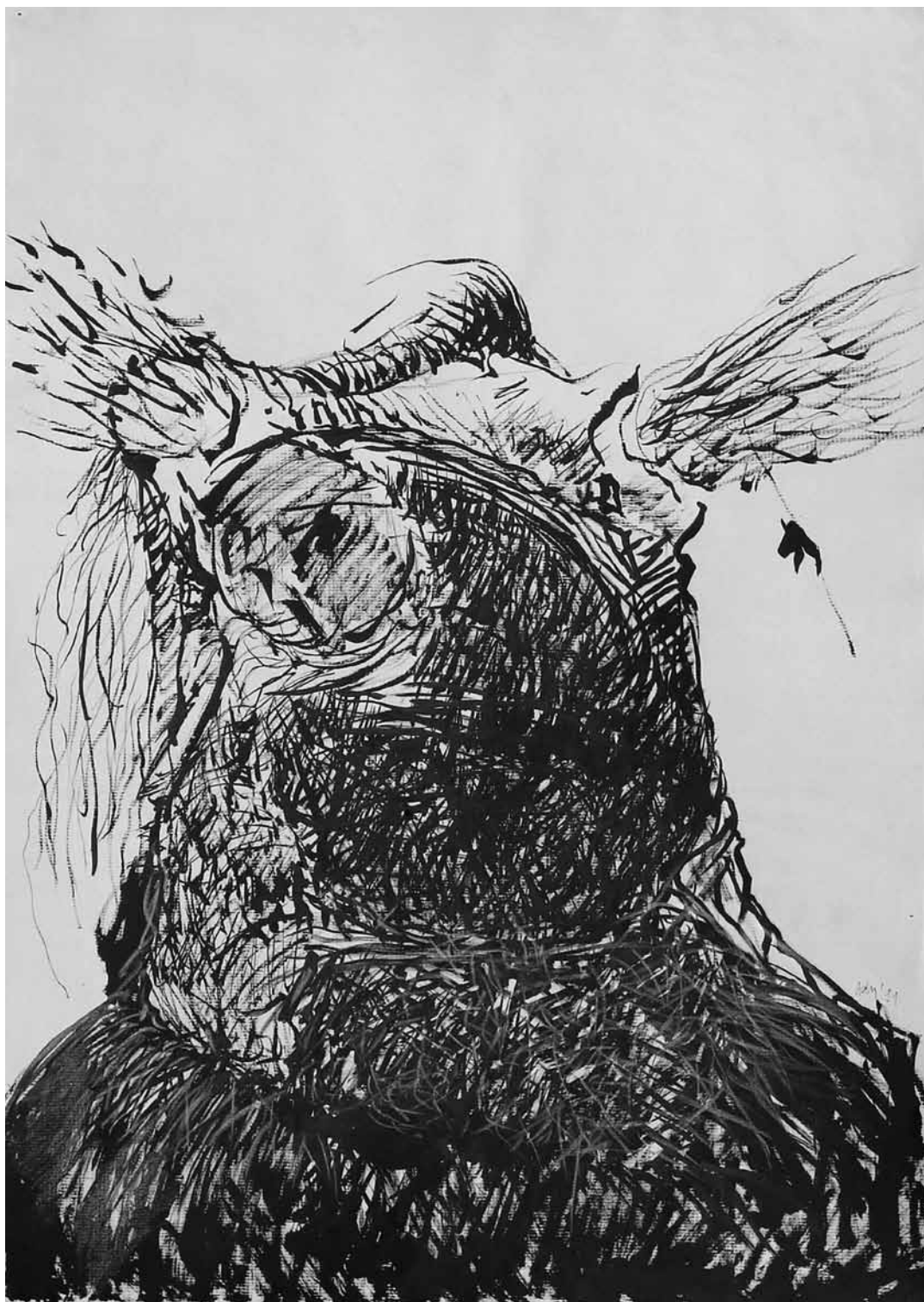
ADY JÓZSEF, Cím nélkül, 1990, egyedi vegyes technika

Ilyenkor álmodunk: hitehagyott, hitevesztett világunkban védelmezően borul fölénk Szent Márton karddal kettéhasított köpenyének egyik fele.