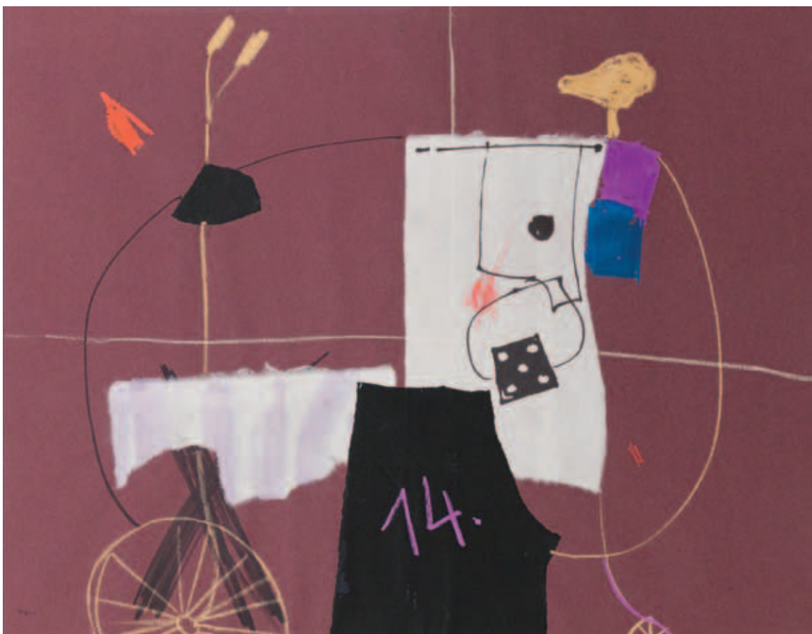
KONOK TAMÁS, Kollázs (Collage), 1969/3 (MAG); Vélo, 1969/2 (MAG)