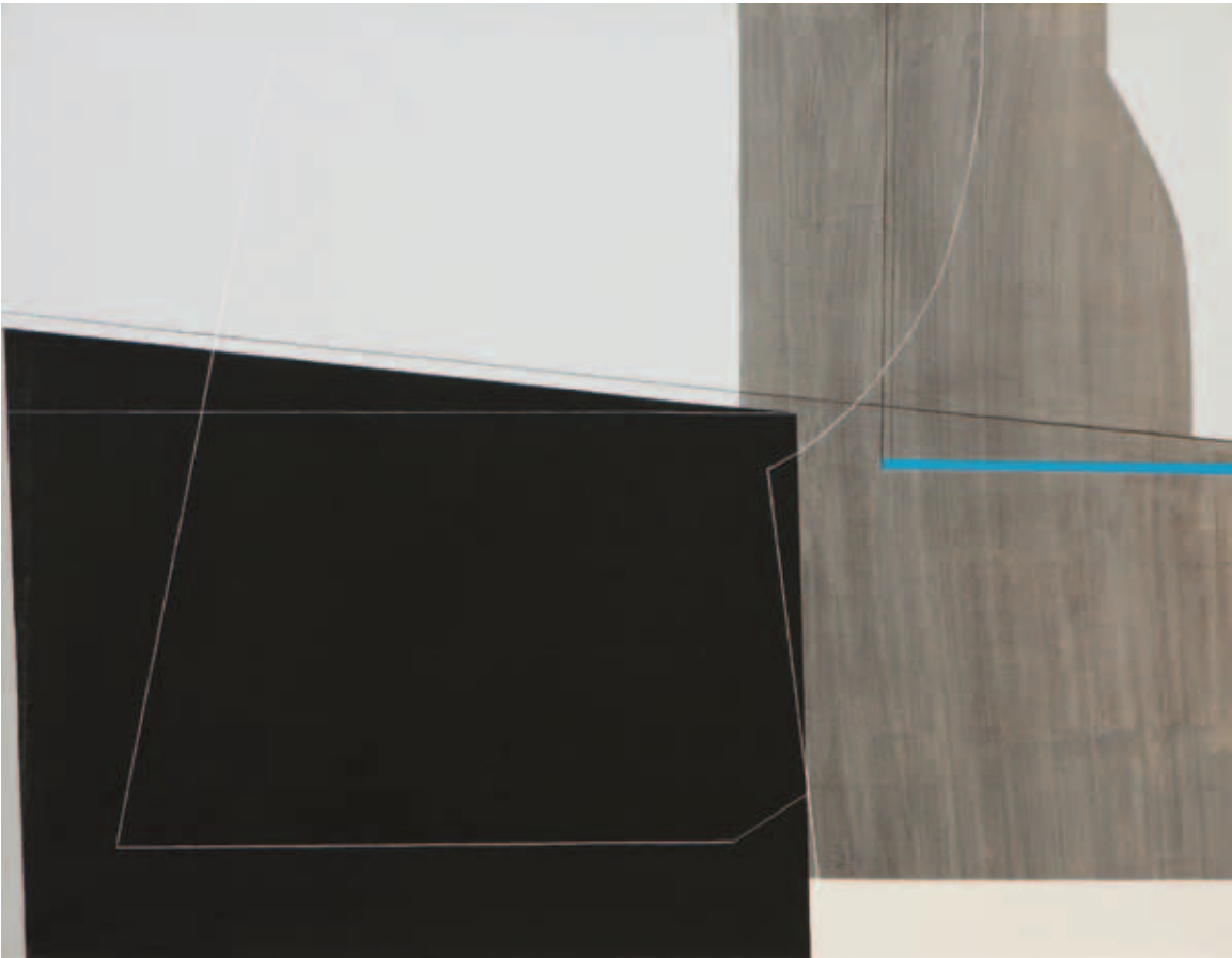
KONOK TAMÁS, Extension, 1975/43 (MAG); Espace descriptif, 1975.14 (MAG)