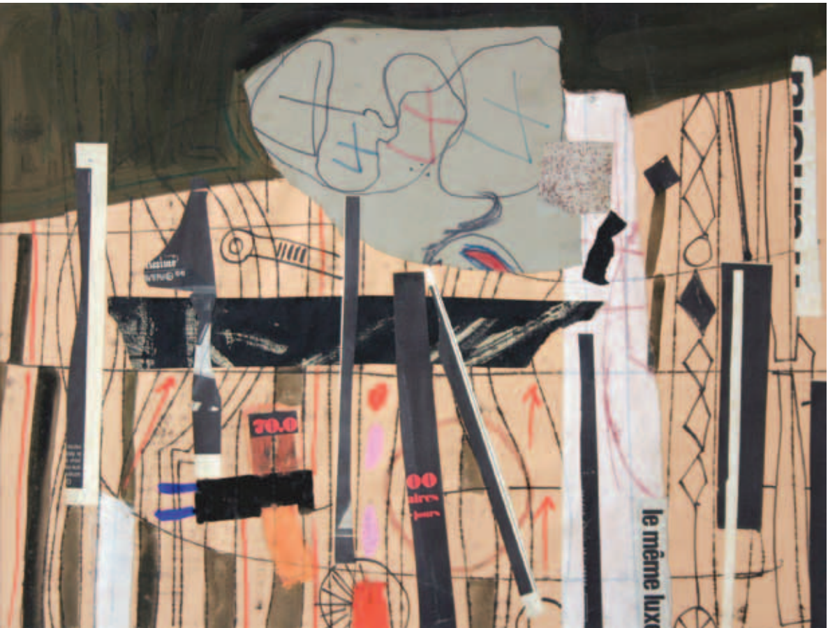
KONOK TAMÁS, Kollázs (Collage), 1969/25 (MAG); Le même lux, 1969/1 (MAG)