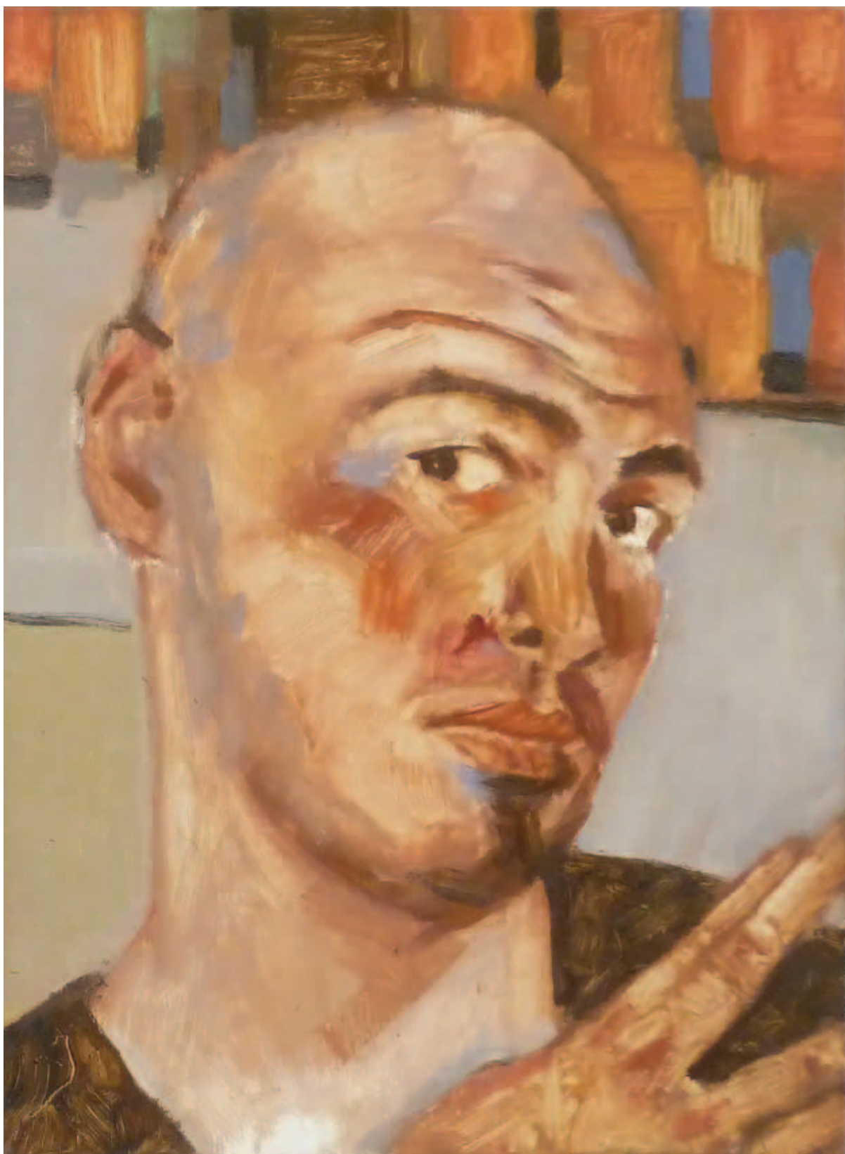
POSTA MÁTÉ, Így festetek ti (Schiele) , 2014

◀ POSTA MÁTÉ, Így festetek ti (Jacques-Louis David; van Gogh; Seurat; Klimt) , 2014