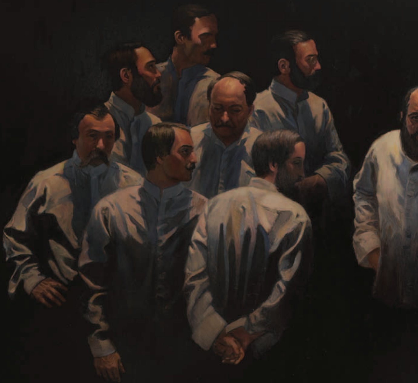
POSTA MÁTÉ, A 13 aradi vértanú, 2004, olaj, vászon, 200 × 400 cm (MTA Területi Akadémiai Bizottság Székháza, Debrecen)