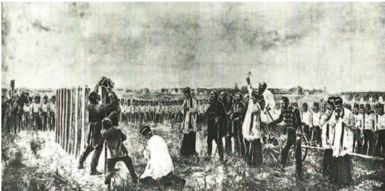
THORMA JÁNOS, Aradi vértanúk, 1892–1896, olaj, vászon, kb. 400 × 700 cm (a széleit a művész levágta, közepe a ma ismert Aradi vértanúk kép)