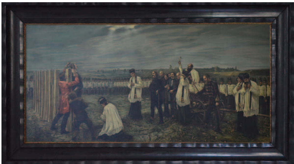
THORMA JÁNOS, Aradi vértanúk, 1892–1896, olaj, vászon, 350 × 640 cm, MNG ltsz. 3308