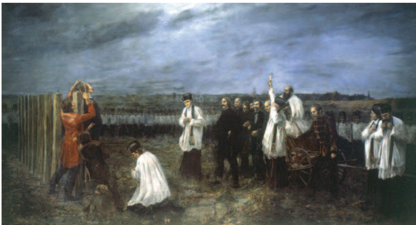
THORMA JÁNOS, Aradi vértanúk, 1892–1896, olaj, vászon, 350 × 640 cm, MNG ltsz. 3308