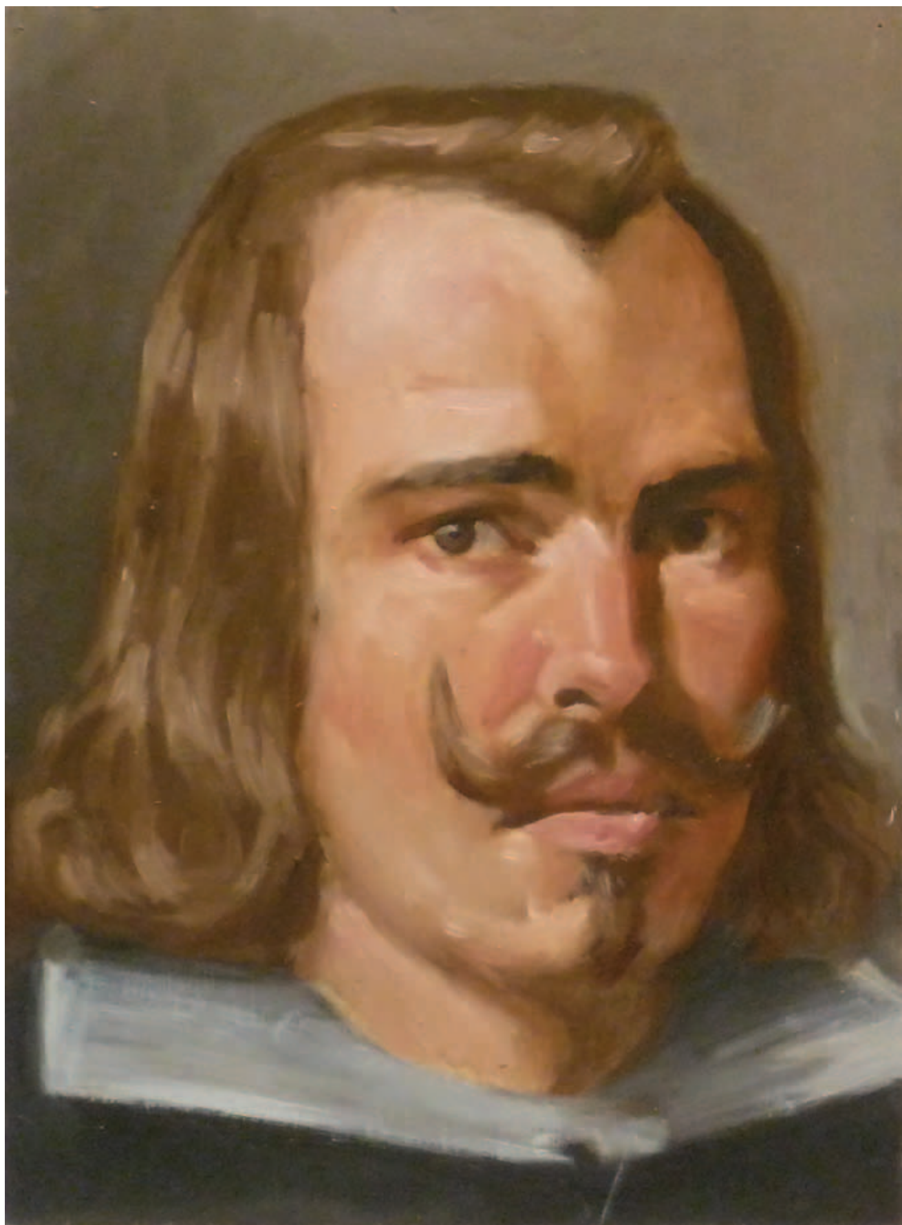
POSTA MÁTÉ, Így festetek ti (Velázquez), 2014