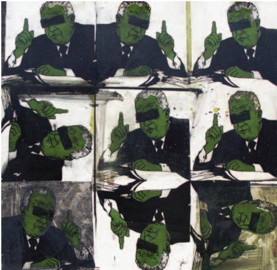
VESELY FERENC, Képregény, 1972; Bürokrata, 1973