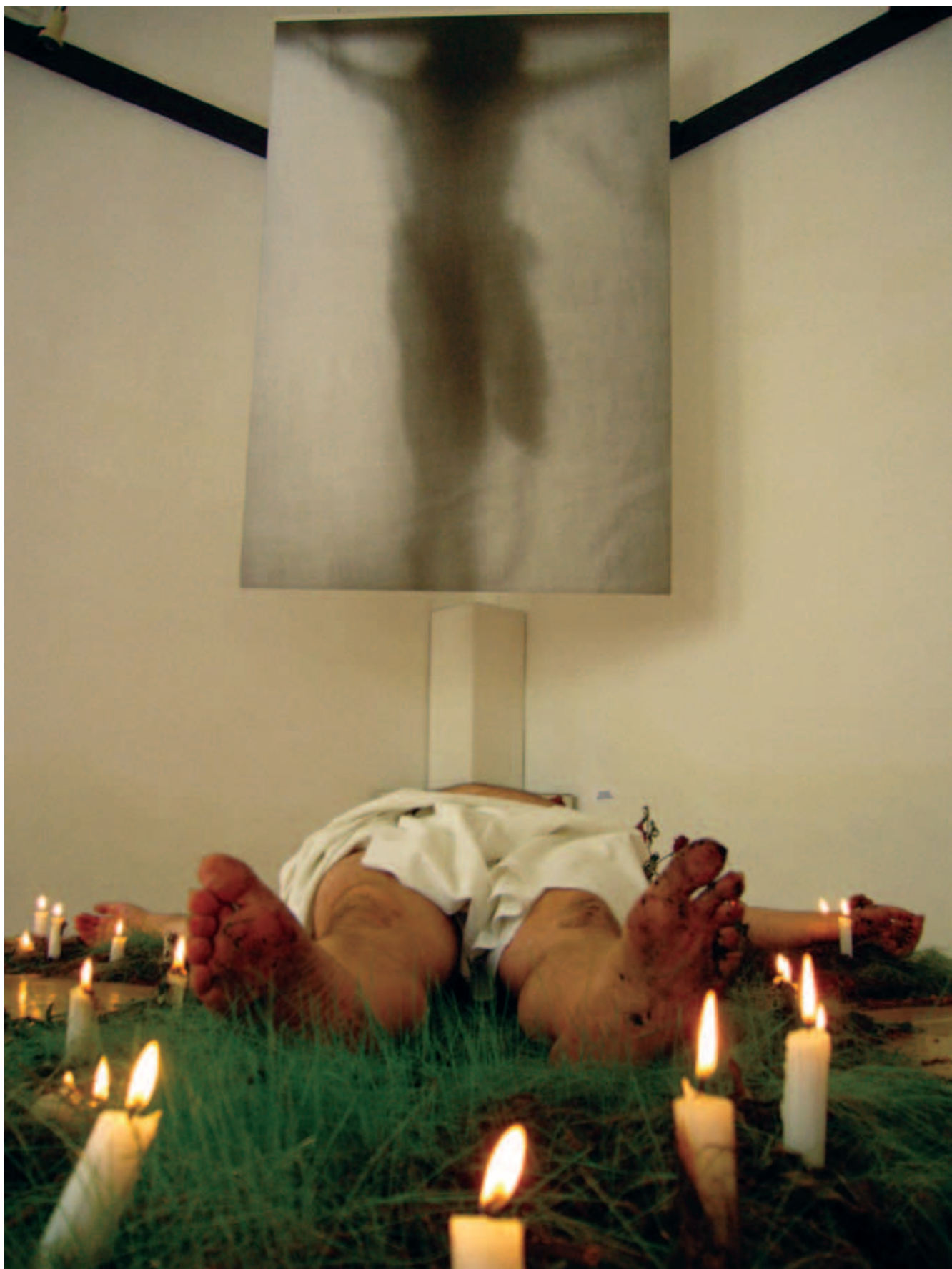
NÉMETH TESTVÉREK, a Mysterium carnale c. kiállítás performansa, Expanzió XIX. – „Pünkösöd”, Aszód, Petőfi Múzeum, 2007