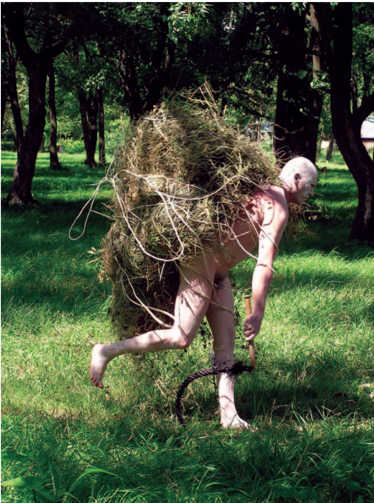
KOVÁCS ISTVÁN (KOVAAX), Szent Ferenc stigmatizációja, Expanzió XVI. – „Szent Ferenc”, Szécsény, 2004