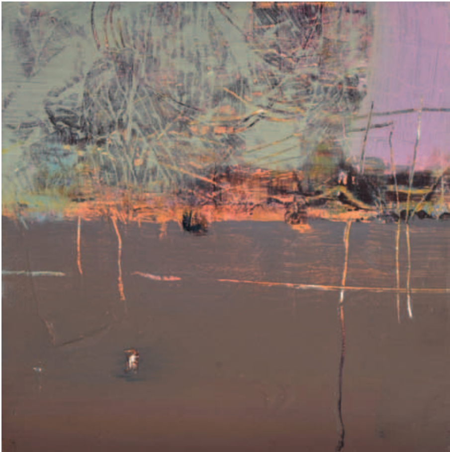
FELHÁZI ÁGNES, Apró történetek I-II., 2017