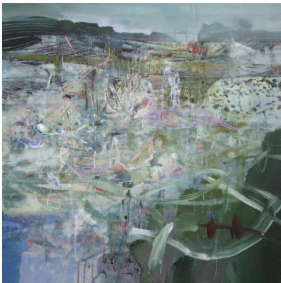
FELHÁZI ÁGNES, Egyfajta kék I-II., 2017