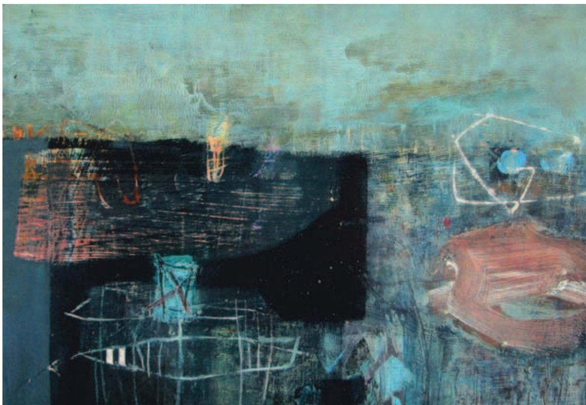
FELHÁZI ÁGNES, Mélységben ( Cs. A. emlékére), I-II., 2017