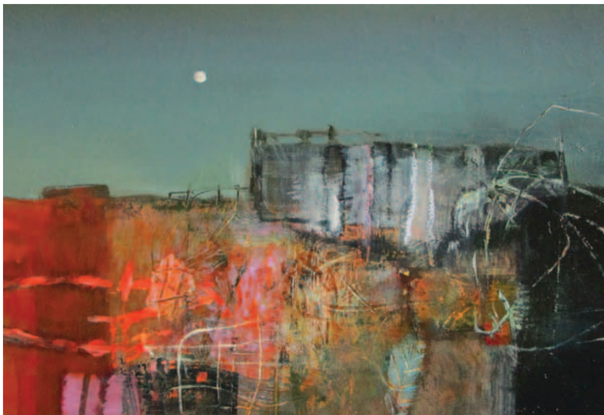
FELHÁZI ÁGNES, Mélységben ( Cs. A. emlékére), III-IV., 2017