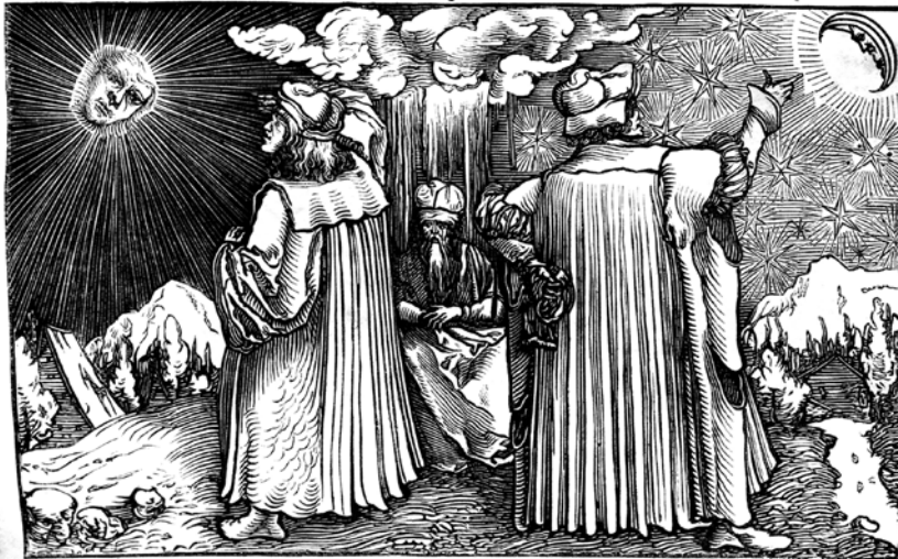
Fig. 234. — Les astrologues. Figure du XVI e siècle, attribuée à Holbein.

Na de vissza a főmederbe. Akkoriban, amikor Franciaországban szert tettem a Baltrušaitis-könyvre, megvettem a pesti Központi Antikváriumban az első igazi Flammarionomat is: Astronomie populaire , 1880-ban adták ki. Két vaskos, bőrbe kötött album. Hogy pontosan mikor tértem be az antikváriumba, arra legföljebb az első kötet utolsó lapján bejegyzett összegből lehet következtetni: I-II.: 800 Ft. Ha már kézbe vettem, át is lapozom. Több száz fekete-fehér kép, ropogós metszetek, kifogástalan magasnyomás. A második kötetben, az 543. oldalon találok egy meglepő képet: Fig. 234. – Les astrologues, figure du XVI e siècle attribuée à Holbein . Tényleg van némi „holbeines stichje” a metszetnek, na de korábban keljen, aki engem épp Holbeinből akarna megfogni. Ez nem Holbein! Ez Flammarion! Nyilván kitett maga elé néhány csillagászattal kapcsolatos Holbein-lapot (a jó baráttal, Nicholas Kratzerrel kooperálva Holbein több ilyen is készített), aztán csinált egy vadonatújat. A kép részletei, a Hold, a csillagok, a Nap (amit egyébként eléggé elcseszett) több hasonlóságot mutatnak a bizonyos nyolc évvel későbbi szellem-metszettel, mint bármelyik igazi Holbeinnel.