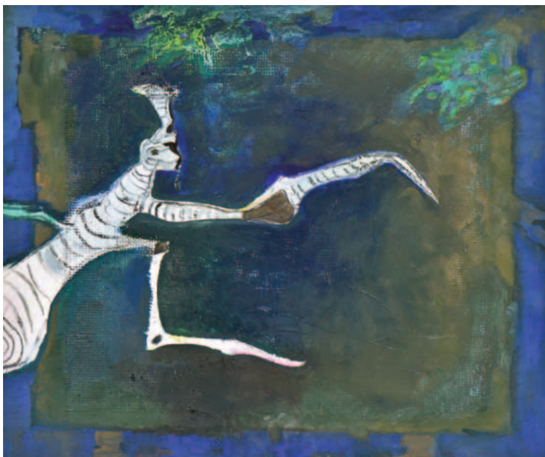
DÓCZI VIRÁG, Fény felé forduló, 2015; Féreg II., 2017