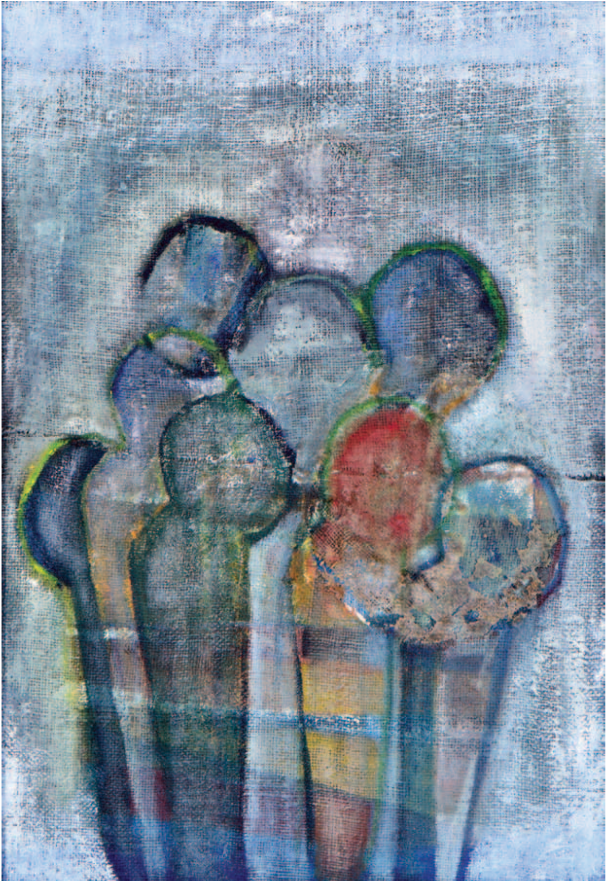
DÓCZI VIRÁG, Árnyak, 2011