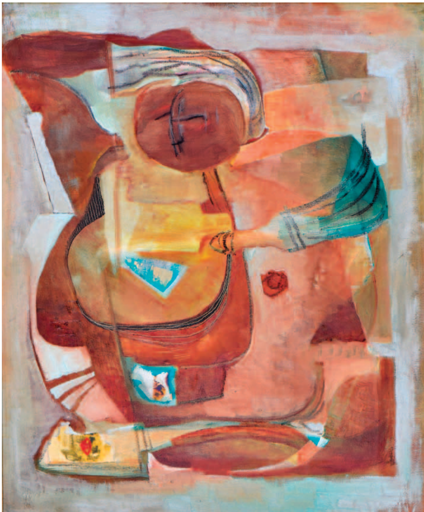
DÓCZI VIRÁG, Álmodozó, 2017