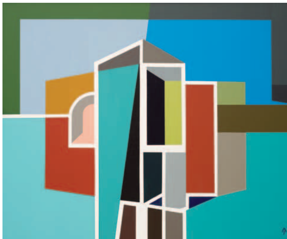
AKNAY JÁNOS, Emlék, 2016