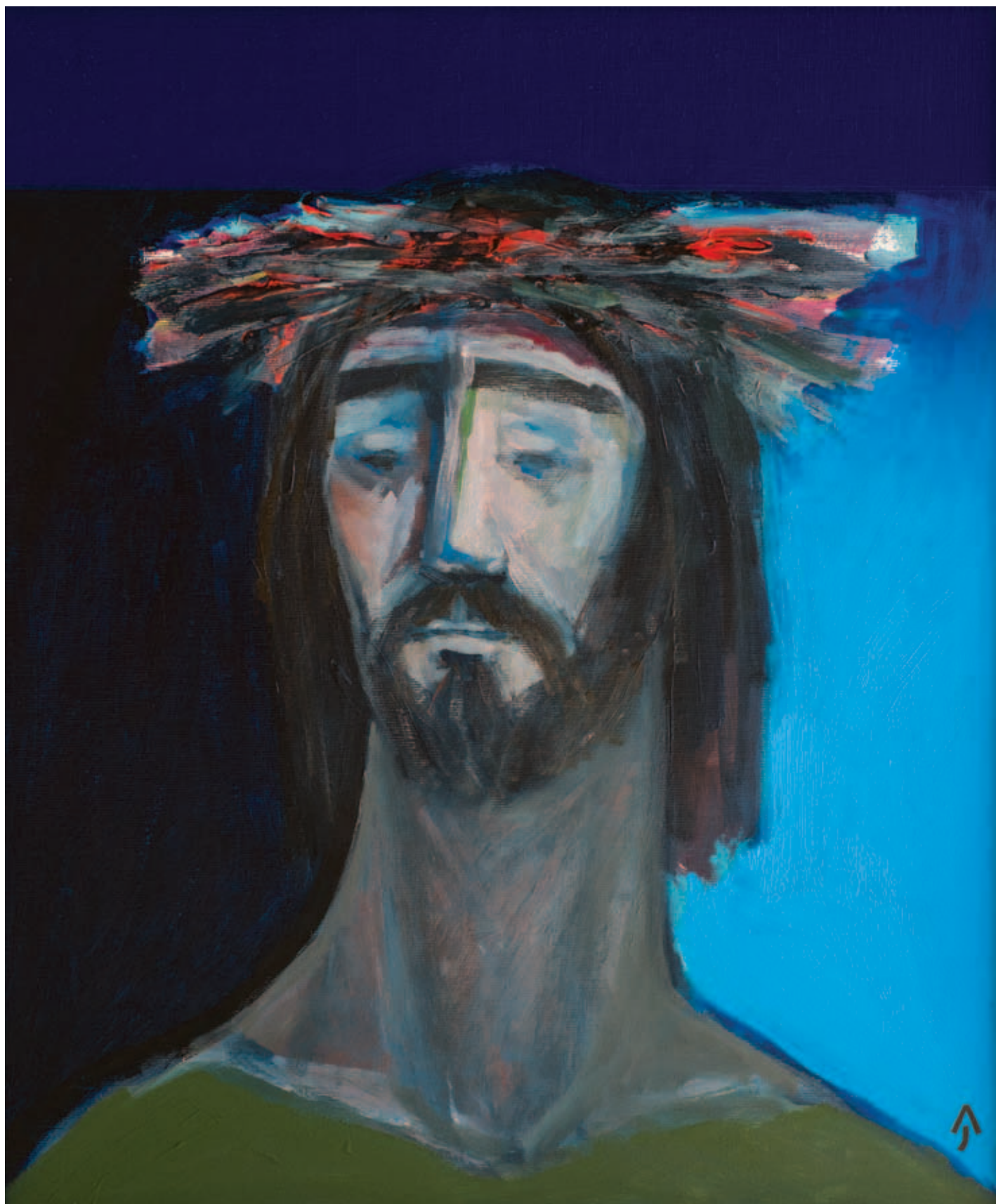
AKNAY JÁNOS, A megváltó Krisztus, 2017