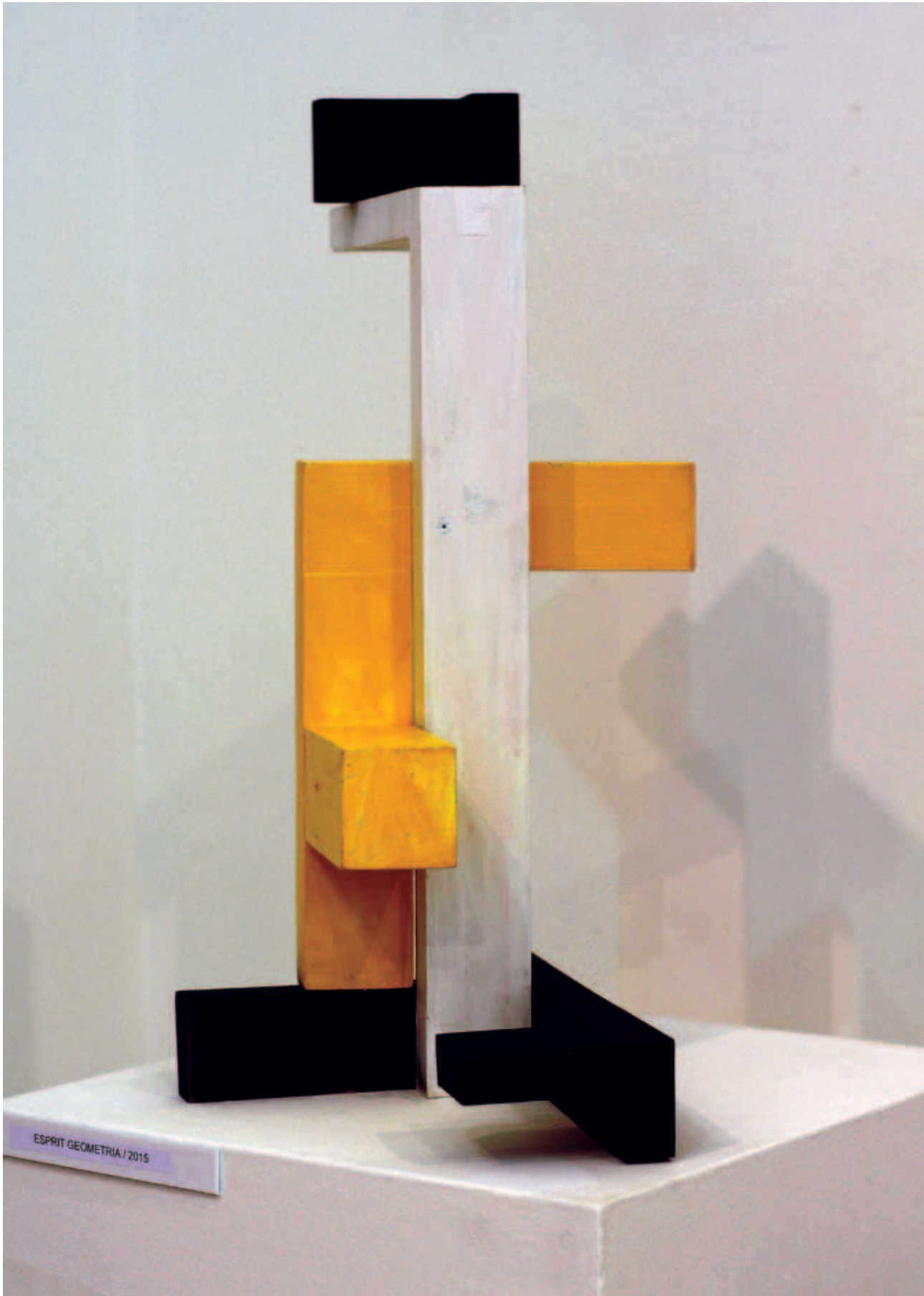
ÉZSIÁS ISTVÁN, Esprit geometria , 2015