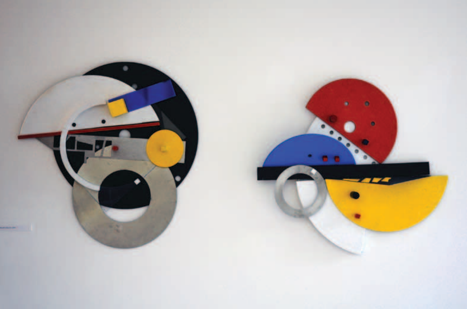
ÉZSIÁS ISTVÁN, MADI relief (Dallas), 2008 és Dinamikus relief, 2008