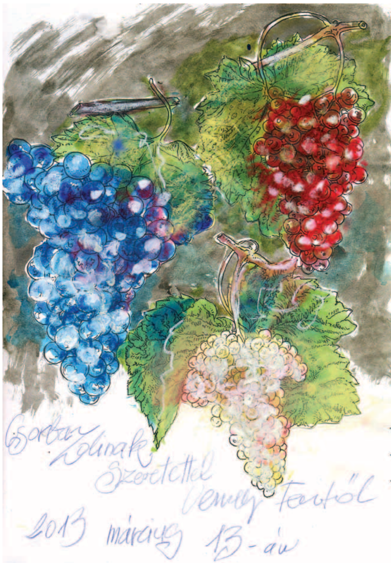
VESZELY FERENC, Cím nélkül, 2013