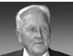
CZIGÁNY GYÖRGY (1931) Budapest