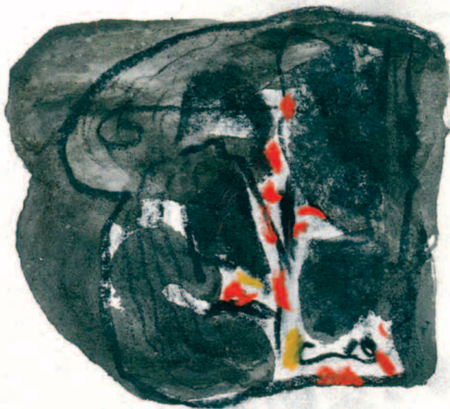
KLIMÓ KÁROLY, Marad vagy megszűnik a művészet, é. n.