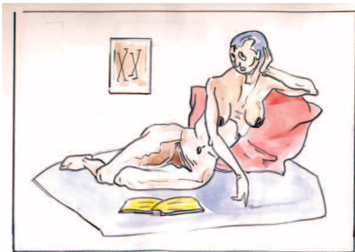
akt a XX. sz. első felének modorában