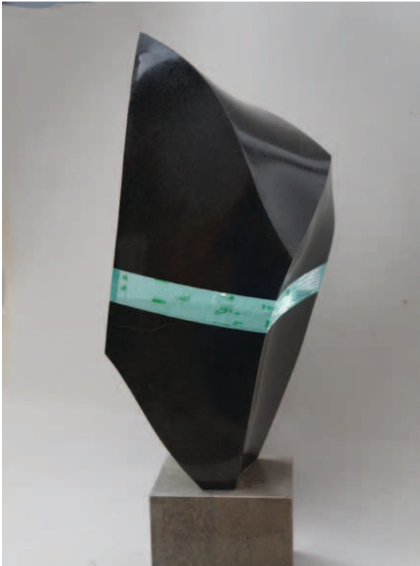
POPOVICS LŐRINC, Hegy felhőben, 2013; A fény őrzője, 2014