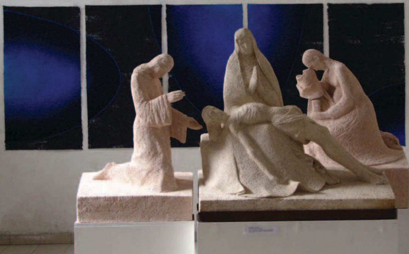
GVÁRDIÁN FERENC, Hommage à Avignoni Pietà, 2017