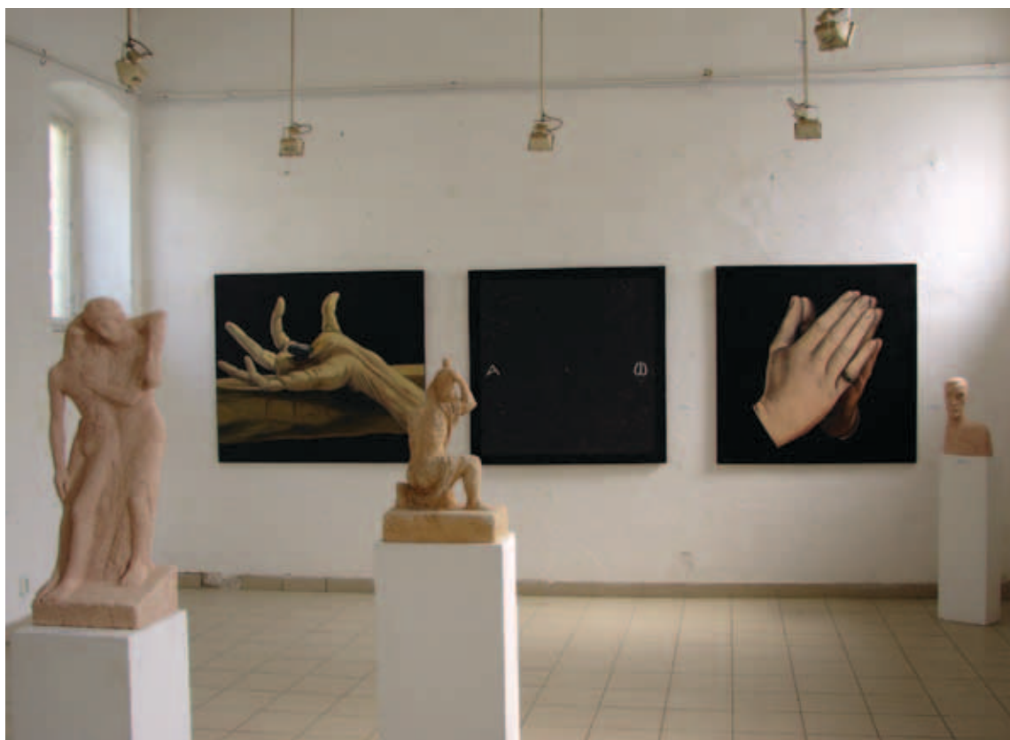
„KözeledjeteK...” III. című kiállítás, 2017, Zichy major, Budaörs (részlet II.)