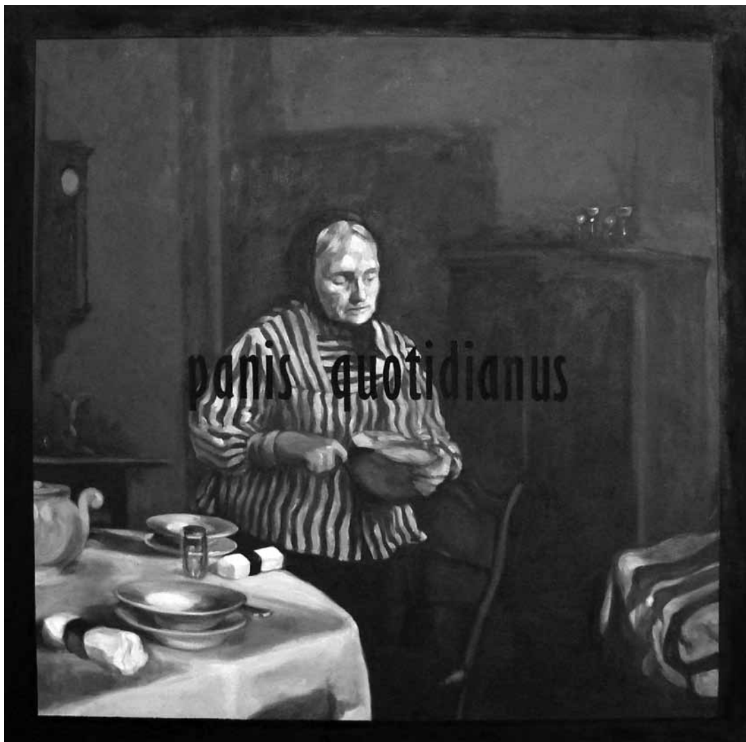
TÓTH CSABA, Emlékezés a régiekre, 2002