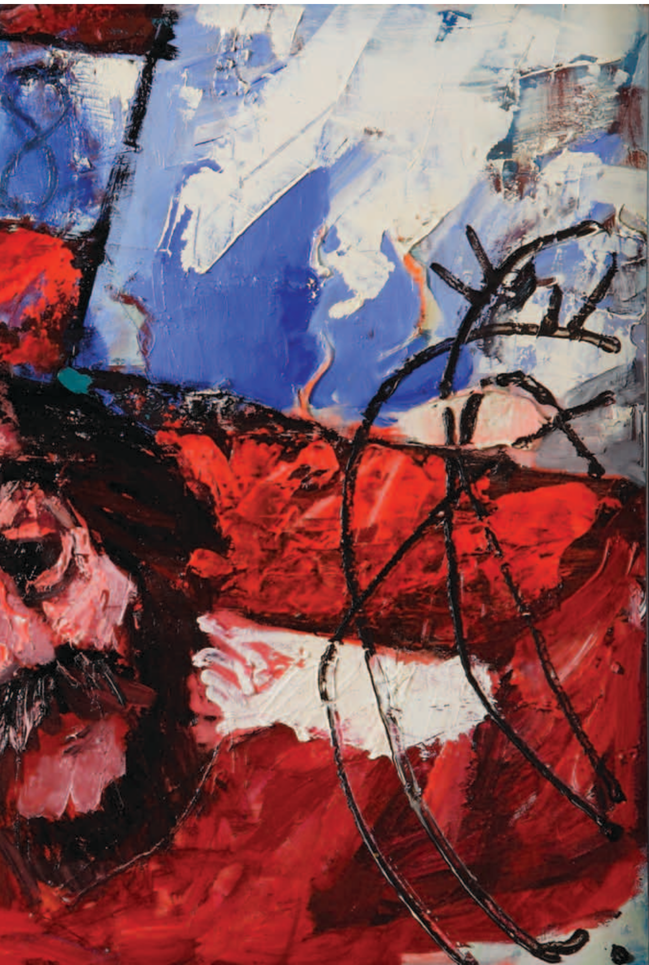
BÉNYI ÁRPÁD, Fájdalmas örökség , 2006