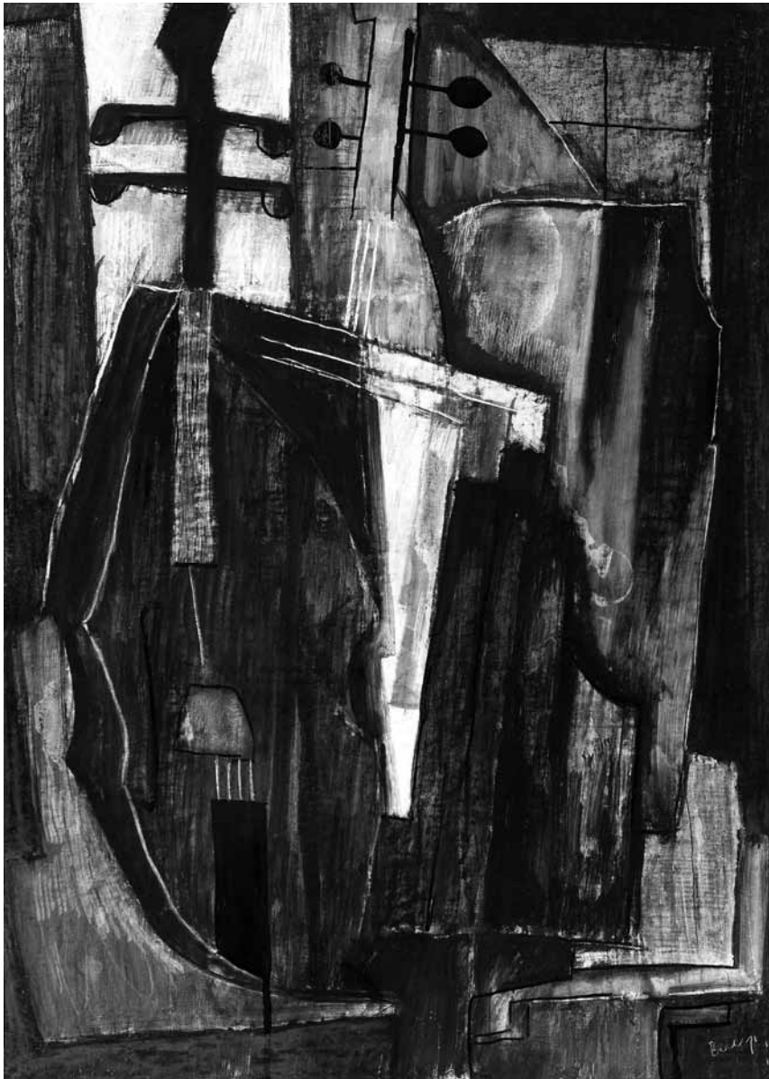
BÉNYI ÁRPÁD, Poros hangszerek, 1966

meg. Több mint négy méter magas gyerekszobám természetes ablakaival átellenben – srévizavé , ahogy nagyanyám mondaná – egy kápolna üveghomlokzata veri vissza a kicsiny ház alakját. Egyemeletes hajlék, kilenclakásos. A fehér rácsokat és a piros muskátlikat leszedték azóta. A kápolna karzatáról viszont még mindig nagyokat bólintgat öreg pálmafánk; a lakás eladásakor édesapámmal cipeltük át, hogy jótékonyan szabaduljunk meg tőle. Vasárnap kipattan szemem az orgonaszóra. Mise kezdődik a túloldalon; nagyanyám bundáskenyeret süt, hogy ha a kilenc órára már nem is, a tizenegyesre átérjünk. Ott kereszteltek meg, tanítottak hittanra, elsőáldoztam, nyertem el a betlehemes játékok valamennyi szerepálmát. Nincs többé mise, nagymama, és betöltendő szerepálom sincs többé. Nem sikerült családot alapítanom, hogy jelenemet, a Thököly út ötvenötöt összekössem múltammal, ahonnan útra keltem, és ahová álmaimban minden lánnyal visszatérek ölelkezni, mert meddő szerelmeim ugyanabból az álomból szövődnek, összebújunk a levegőtlen galérián, matracomon, és eggyé válunk vele, a Táltos utca tizenhárommal.