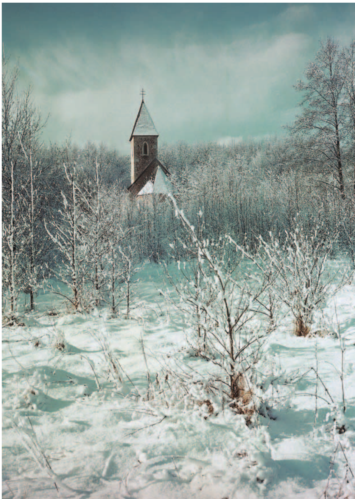
OLASZ FERENC, Szentháromság-templom, Velemér, 1973