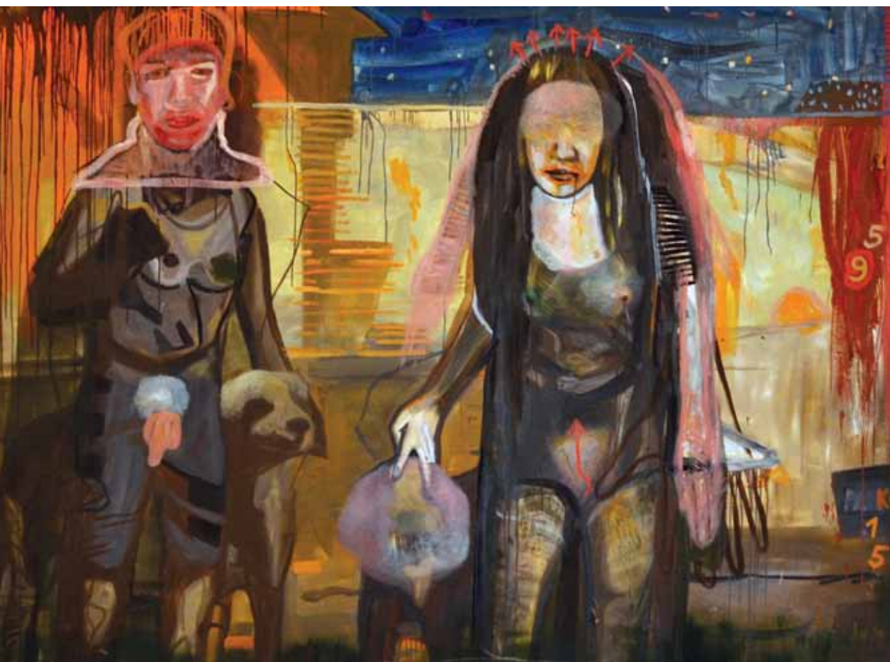
Az első felszín, 2016