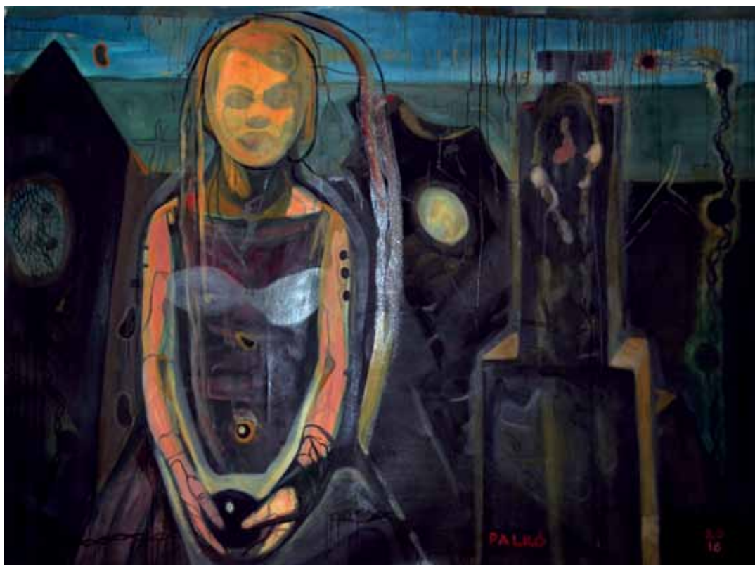
A játék vídám birodalma, 2016