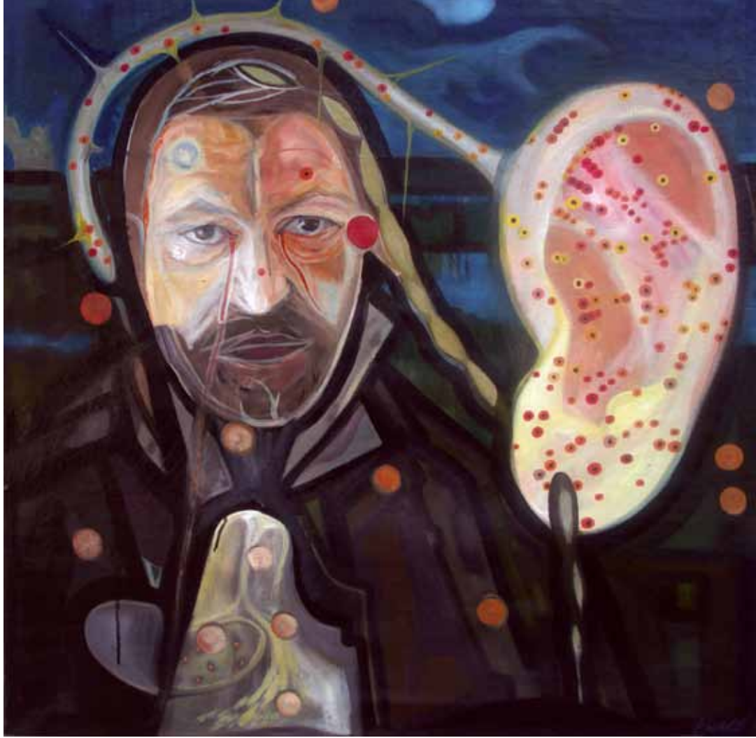
Kertben történt dolgok, 2007