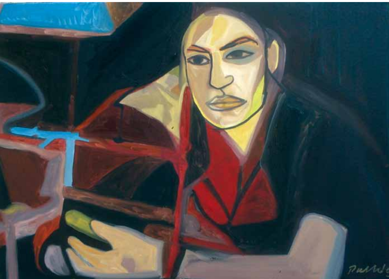
Valaki eltűnt, 2010