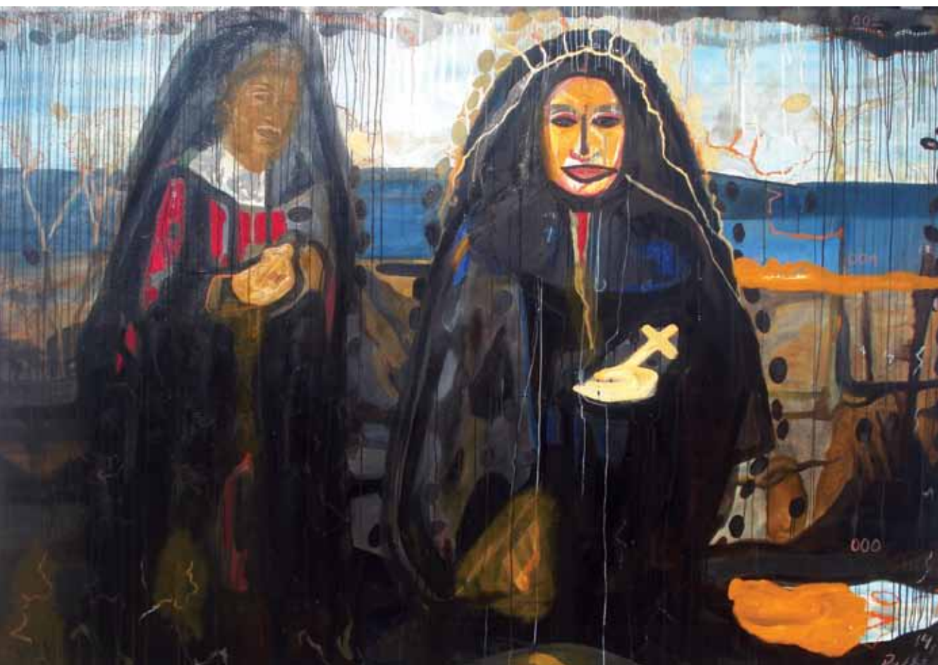
Második felszín, 2015