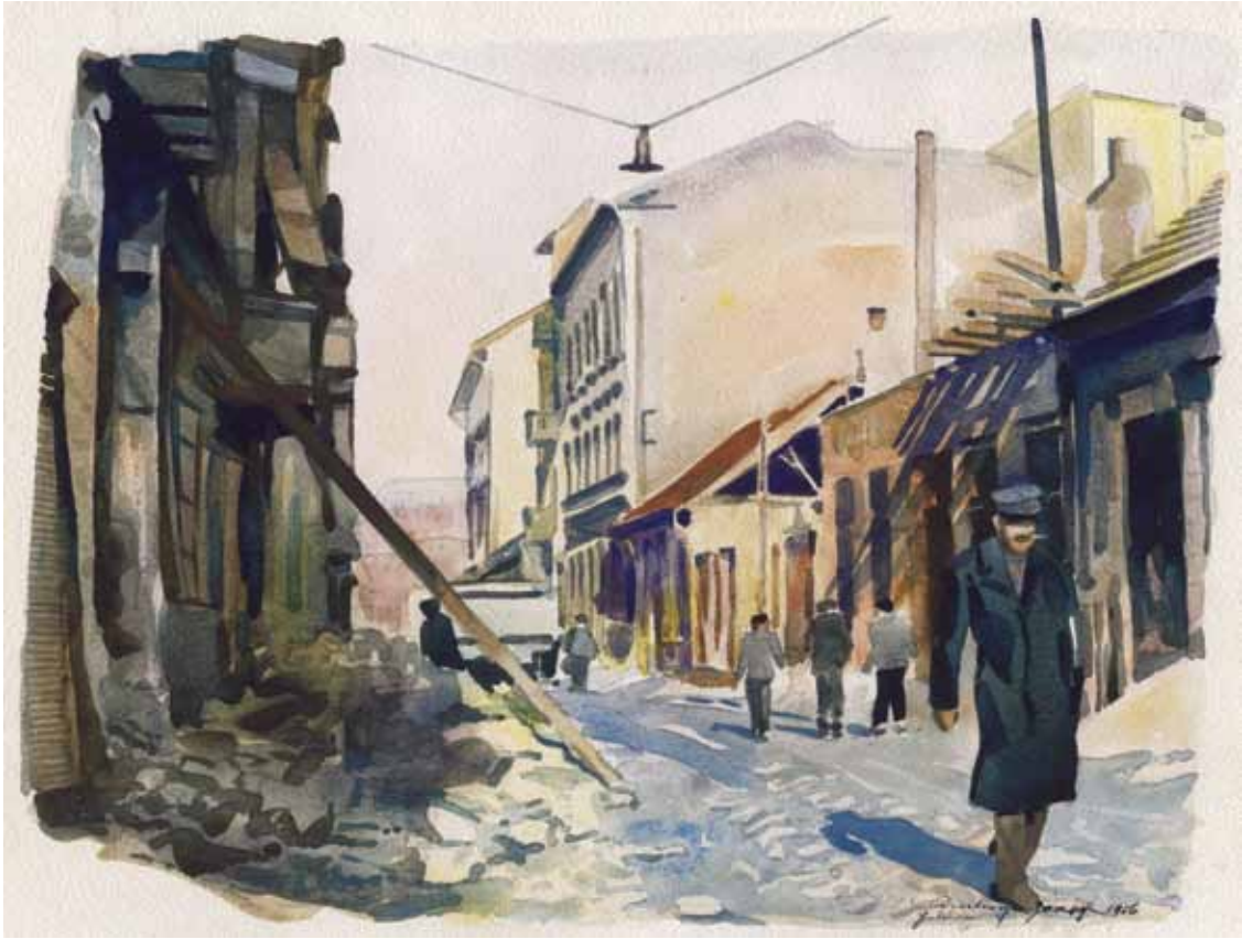
VIII. kerület, Futó utca, 1956. december 8., akvarell