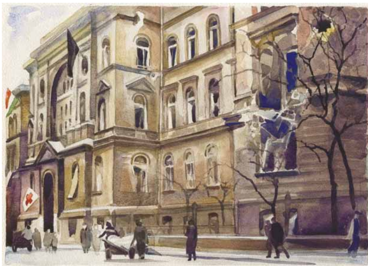
I. sz. Nőgyógyászati klinika Baross utcai frontja, 1956. november, akvarell