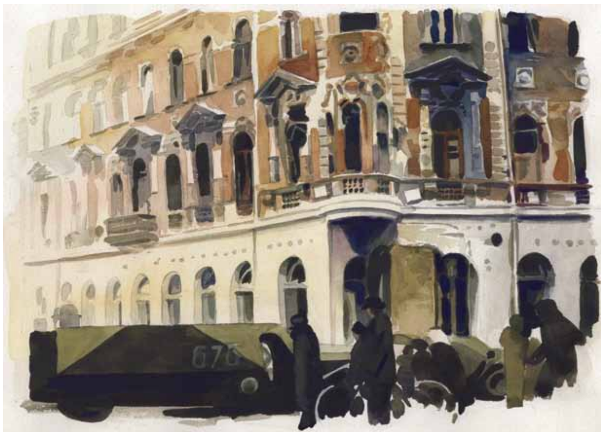
Rákóczi út és Akácfa utca sarok, 1956, akvarell