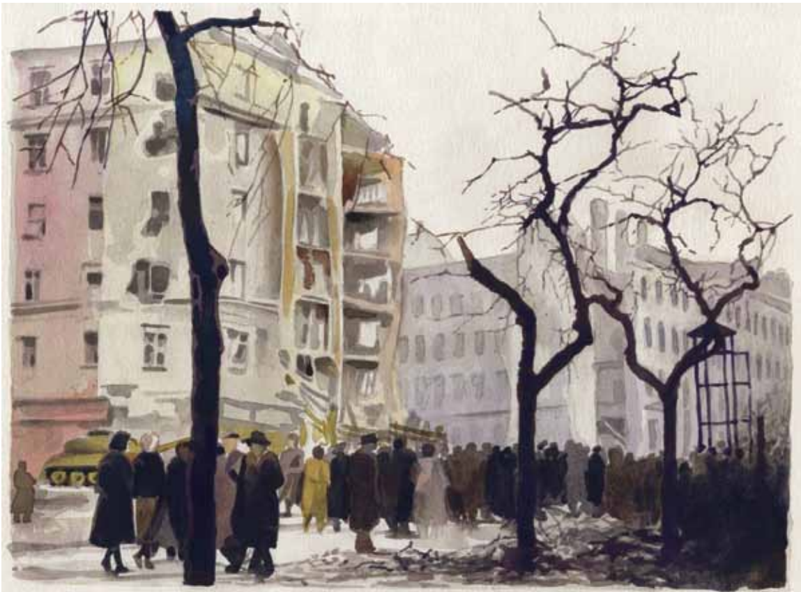
József körút, Ferencz körút és Üllői út sarok, 1956, akvarell