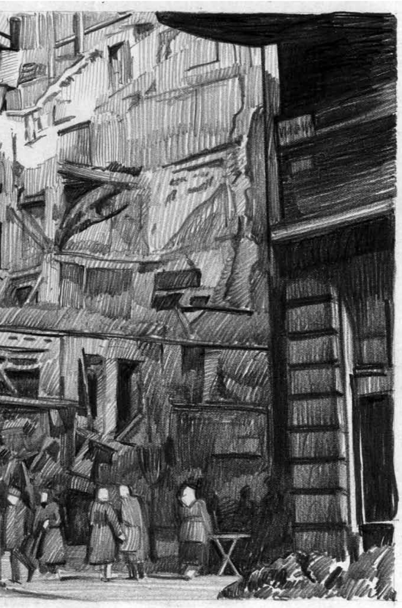
Rákóczi út, Divatcsarnok, 1956. december 8., ceruza