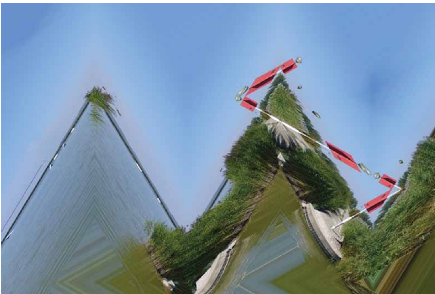
HAÁSZ ÁGNES, Tájvetület piros objektel, 2015