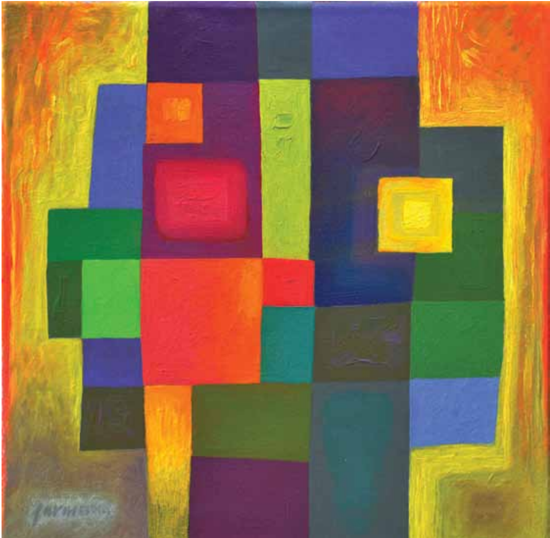
A Nap zúzmarás oldalán Z., 2011