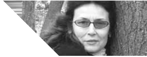
FINTA ÉVA (1954) Sárospatak

Beregszász egykori megyeszékhely ma is kisváros, amolyan igazi „porfészek”, mivel az északkelet és délkelet felől körülfogó, mára már szelíd vulkanikus hegyek légörvénye a táj minden szemetét, porát az egykori Verbőczy, majd Felszabadulás, jelenleg Kossuth téren rakja le, állandóan gondoskodva az utcaseprők mindennapi feladatáról, ha betevőjéről nem is feltétlen. Talán ennek köszönhető, hogy ebben a légörvényben mindig is nyitottan hagyták ezt a teret, amely a város főtengelyének egyik csomópontja, a Széchenyi és a Mozi utca metszéspontja is lett, s melynek derékszögvonala áll az egykori zsinagóga. Jól kirajzolódik a települések keletkezését meghatározó keresztvonal is: a sok utcanévvel ellátott kelet–nyugati főtengelyt észak–déli irányban a Vérke patak szeli át. A Vérke hídjának túloldalán a város legpatinásabb építészeti ékessége, a gótikus római katolikus templom nagy hivatástudattal hirdeti, hogy ez itt a városmag, az egykori szent negyed, a domonkos és ferences rendbéliek lakhelye, melynek már kövei is mélyen alámerültek az idő iszapjába. Alapítása I. (Nagy) Lajos király édesanyjának, Lokietek Erzsébetnek köszönhető, aki itt udvarházat is tartott a 14. században, s gyakran töltötte benne nyarait.