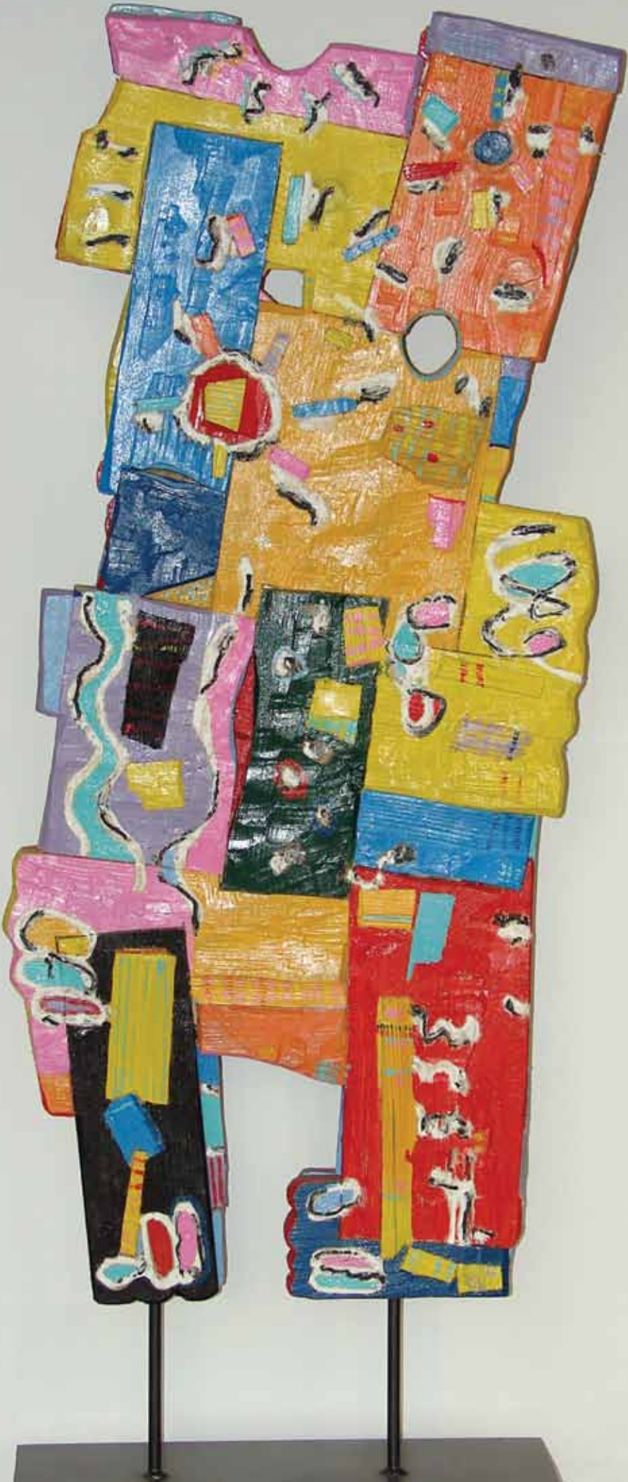
Sikplasztika, labakon, 2015