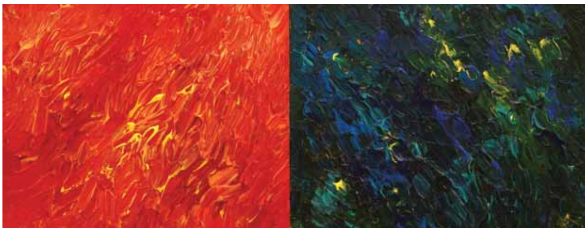
PATAKI FERENC, Páros, 2014