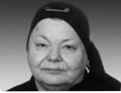
KISS ANNA (1939) Budapest