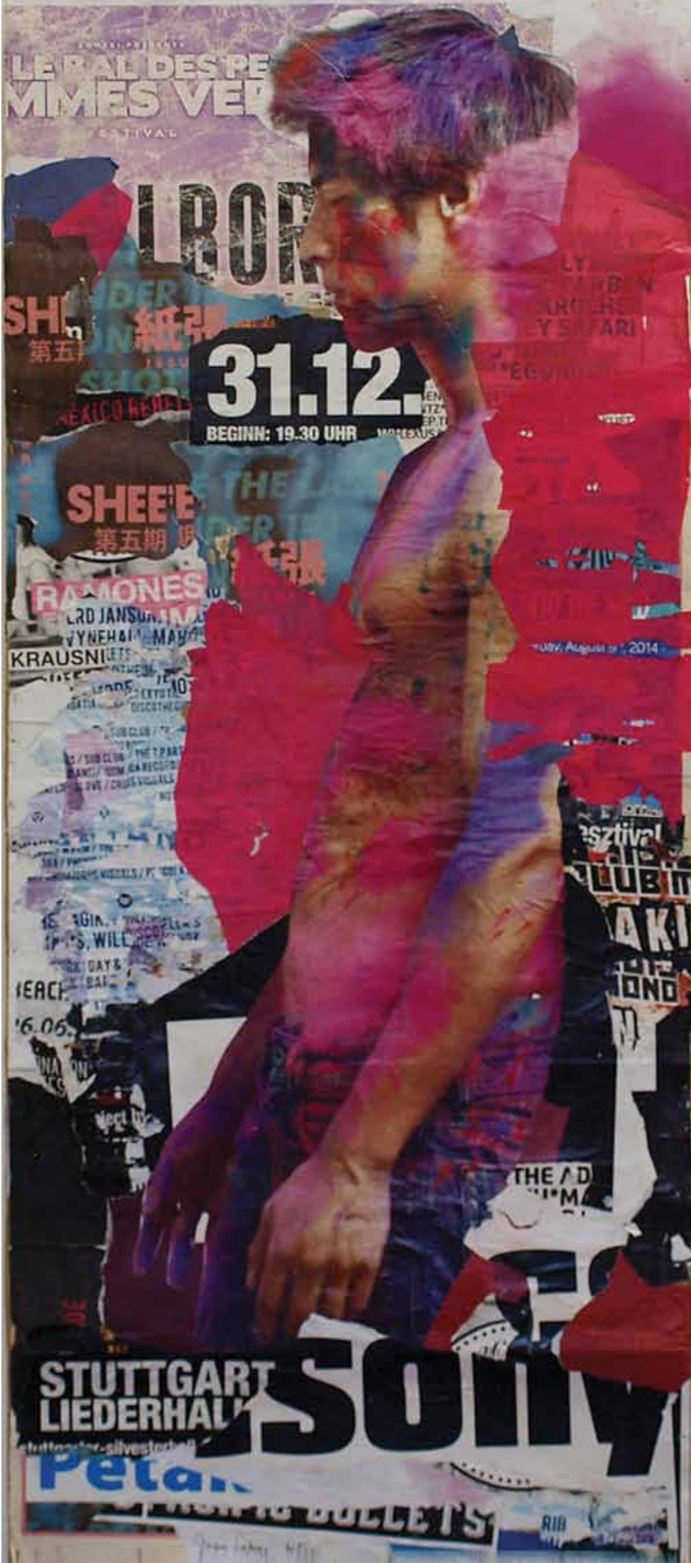
LAKNER ZSUZSA, Godot, 2015