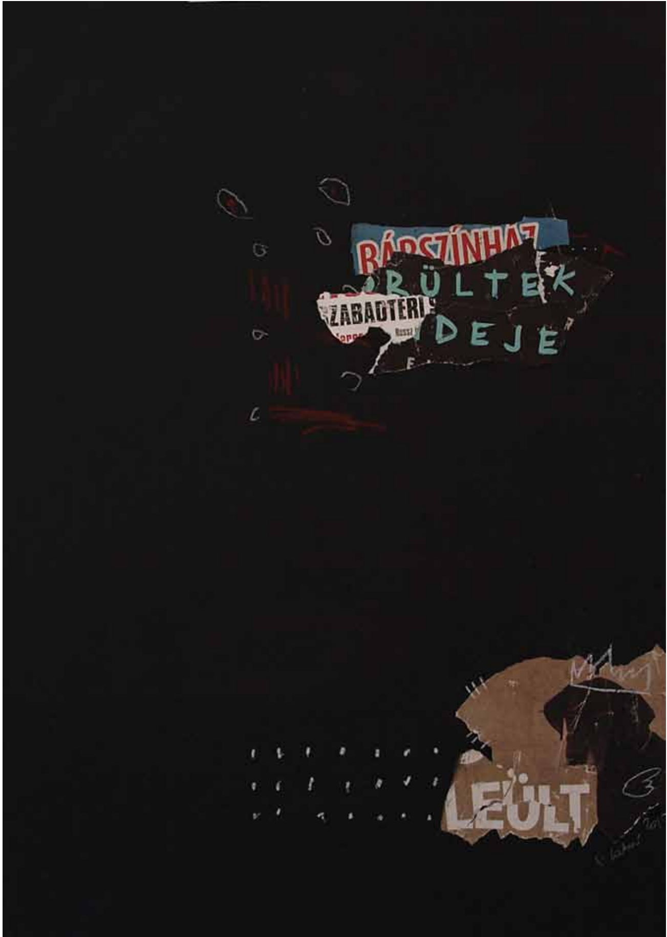
LAKNER ZSUZSA, Szabadtéri örültek ideje, 2015