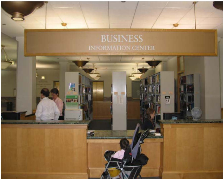
Business Information Center (BIC)

A munkamegosztás szerint egyik kolléga a helyben fölött kérdésekre válaszol, illetve biztosítja a hozzáférést a helyi adatbázisokhoz. A többiek rendezvényt szerveznek, és írásban tájékoztatnak, valamint egyéb – „back office” – tevékenységet végeznek.