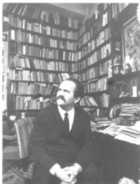
Bod Péter Társaság 2001

A füzetek a könyvtárostánárok továbbképzésein elhangzott előadásokat, pályázatok szövegét, továbbgondolásra szánt véleményeket, megírásra váró témák munkanyagát vagy vázlatát tartalmazzák.