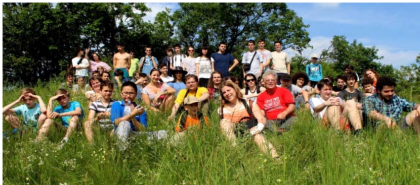
9. ábra. Életkép a kirándulásról.

Határozottan úgy érezzük, az önképzőkör és a tábor bevált. Bátran ajánljuk mindenkinek a kipróbálását, egy hasonló, saját arculatra formált program megvalósítását. Nem állítjuk, hogy könnyű vagy egyszerű, de mégis megéri! Mind a munkaközösség, mind a diákközösség számára összekovácsoló, tanulságos, ösztönző!