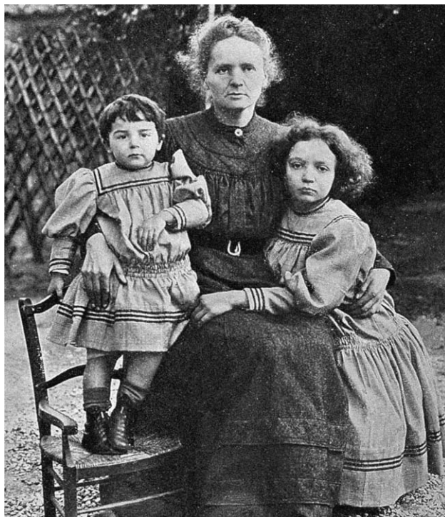
4. kép. Marie Curie és leányai 1908-ban.

1921-ben két lánya kíséretében nagy sikerű utat tett az Egyesült Államokban, ahol Warren B. Harding elnök (6. kép) az amerikai nők által gyűjtött pénzből vásárolt 1 grammnyi rádiumot ajándékozott neki [8]. Marie Curie sok előadást tartott, főleg Bel-