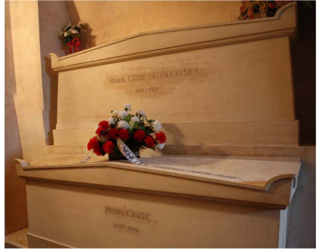
7. kép. Marie Curie-Skłodowska és férje, Pierre Curie sírja a párizsi Pantheonban.

A Curie-házaspár tiszteletére határozták meg a radioaktivitás egyik mértékegységét (curie, jele Ci). Pierre és Marie Curie után három radioaktív ásványt neveztek el: curite, sklodowskite és cuprosklodowskite. Lublinban a Maria Curie-Skłodowska Egyetem, Varsóban pedig a Maria Skłodowska-Curie Rákkutató Intézet van. A Curie-házaspár úttörő munkássága tette lehetővé a nukleáris energia széleskörű alkalmazási lehetőségeit. A maghasadás és a láncreakció felfedezését személyesen ugyan nem érthette meg, de Irène lánya és férje tevékeny szerepet játszott a francia atomerőművek kifejlesztésében és létrehozásában.