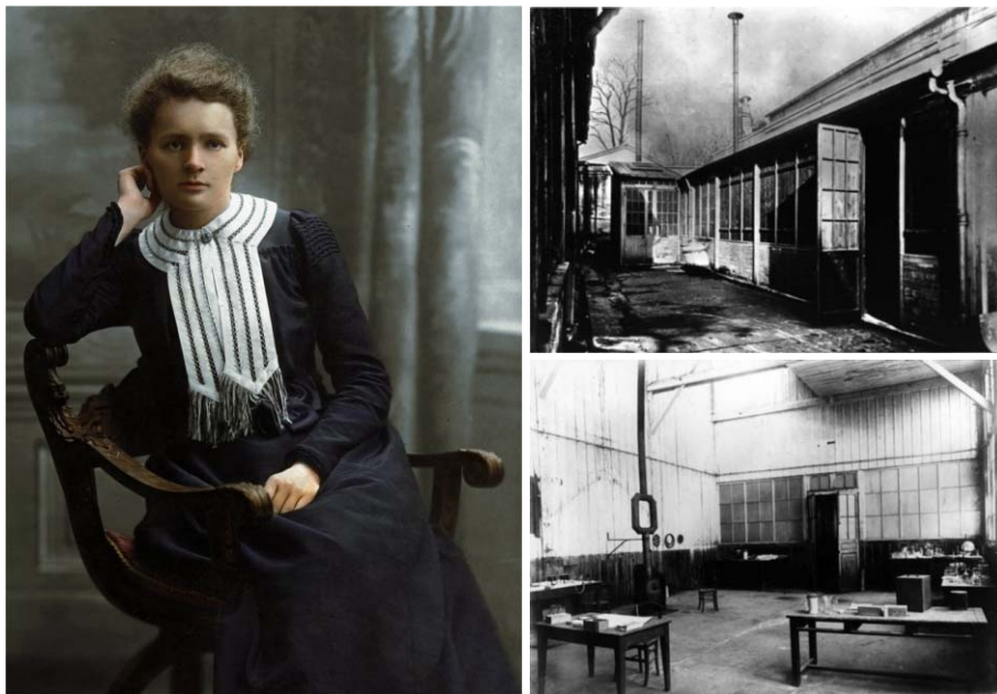
2. kép. Marie Curie az 1900-as évek elején és első laboratóriuma.

mért ionizációs árammal tekintett arányosnak – mérte meg (3. kép).