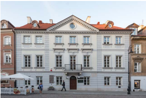
8. kép. Marie Curie szülőháza Varsóban.

Marie és Pierre Curie munkássága új korszakot nyitott a fizikában és a kémiában, a radioaktivitás vizsgálatának terén nagy lendületet adott a kortársaknak és a későbbi kutatóknak. A nukleáris tudomány eredményeit az élő és élettelen természettudományok szinte minden területén alkalmazzák, annak motorja volt a 20. században. Ezt a tudományterület által elnyert 57 darab Nobel-díj is igazolja [9]. A 96-os rendszámú elem a Curie-házaspár után kapta a kúrrium nevet, vegyjele Cm.