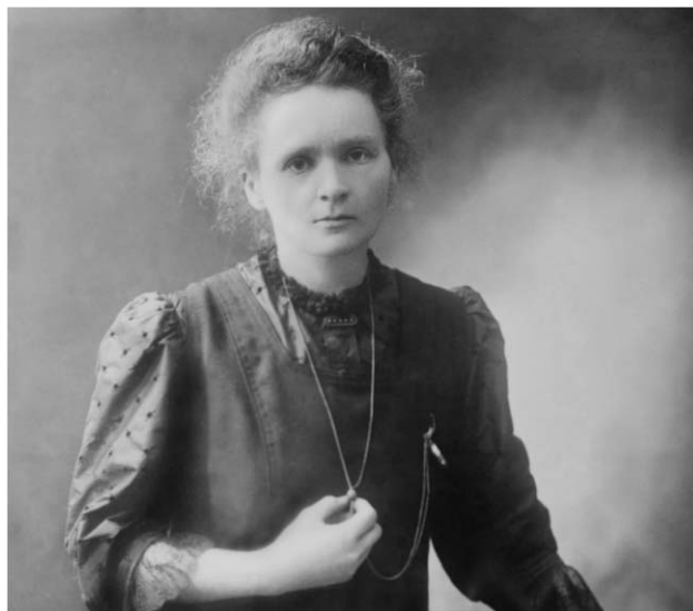
1. kép. Az ifjú Maria Salomea Skłodowska.

Maria később, varsói házitanítósága alatt kezdte meg tanulmányait a Varsói Ipari és Mezőgazdasági Múzeum által szervezett kémiai analitikai tanfolya-