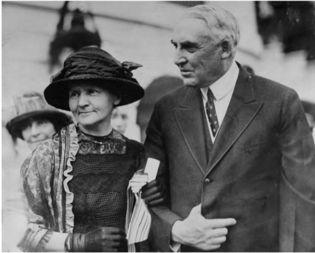
6. kép. 1921-ben az Egyesült Államokban Warren B. Harding elnökkel a Fehér Házban.

ték el, majd hatvan évvel később, 1995. április 20-án Marie és Pierre Curie földi maradványait a párizsi Pantheonban helyezték el (7. kép).