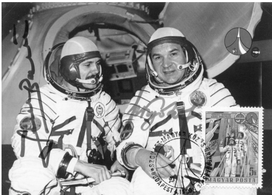
V. N. Kubászov parancsnok és Farkas Bertalan az első magyar űrhajós 1980. május 26-án indult a Szojuz-36 kétszemélyes szállító űrhajóval a Szaljut-6 űrállomásra. A magyar űrhajós az 5. Interkozmosz-űrrepülésen vett részt. A kutatóprogram sikeres zárása után a két űrhajós a Szojuz-35 űrhajóval 1980. június 3-án tért vissza a Földre.