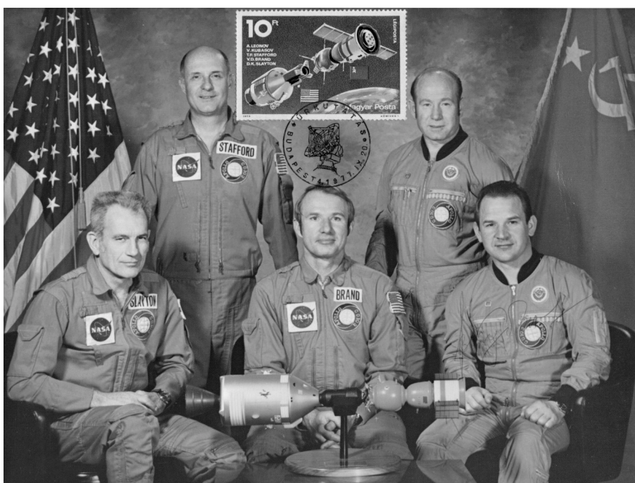
Az első közös szovjet-amerikai űrrepülés legénysége (balról jobbra): D. K. Slayton, T. P. Stafford az amerikai egység parancsnoka, V. D. Brand, A. A. Leonov a szovjet egység parancsnoka és V. N. Kubaszov fedélzeti mérnök. A Szozuz-19 (1975. július 15-én indult és 5 nap 22 óra 30 perccel repült) és az Apollo-21 (1975. július 15-én indult és 9 nap 1 óra 25 perccel repült) űrhajó 1975. július 17-én összekapcsolódott, majd T. P. Stafford parancsnok és D. K. Slayton átszálltak a szovjet űrhajóba.