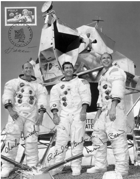
C. Conrad parancsnok, R. F. Gordon és A. L. Bean 1969. november 14-én indult az Apollo-12 fedélzetén 10 nap 4 óra 36 perces űrrepülésre. Conrad és Bean leszálltak a Holdra a Viharok tengerében.