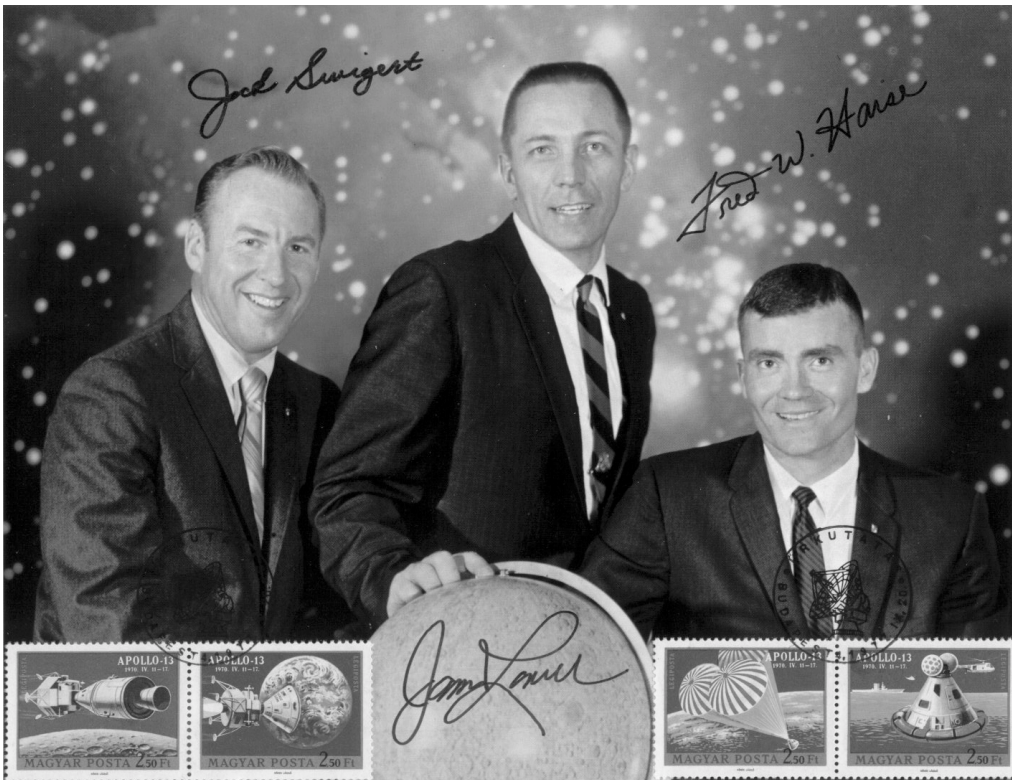
J. L. Swigert, J. A. Lovell parancsnok és F. W. Haise 1970. április 11-én indult az Apollo-13 fedélzetén 5 nap 22 óra 54 perces űrrepülésre. Április 14-én a Földtől 329.000 km-re felrobbant az egyik oxigéntartály, amely megrongálta az űrhajtórendszer műszaki egységét. Végül az űrhajósok 87 óra bizonytalanság után szerencsésen Földet érték.