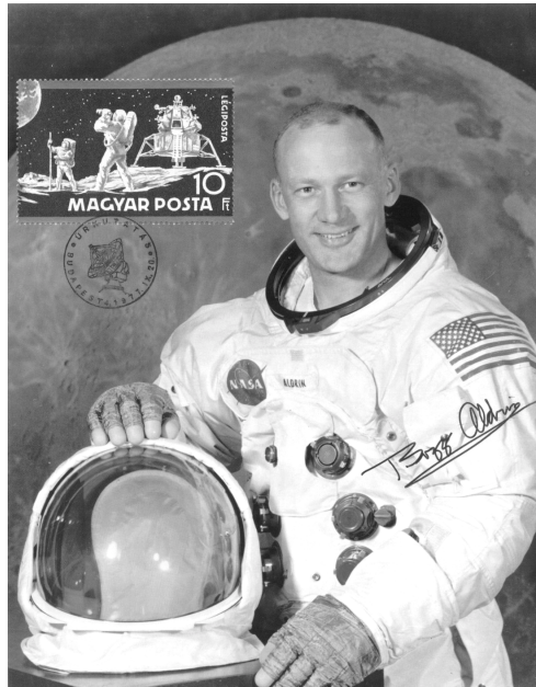
E. E. Aldrin az Apollo-11 holdexpedícióban a holdkomp pilótája volt. Armstrongot követve második emberként lépett a Hold felszínére.