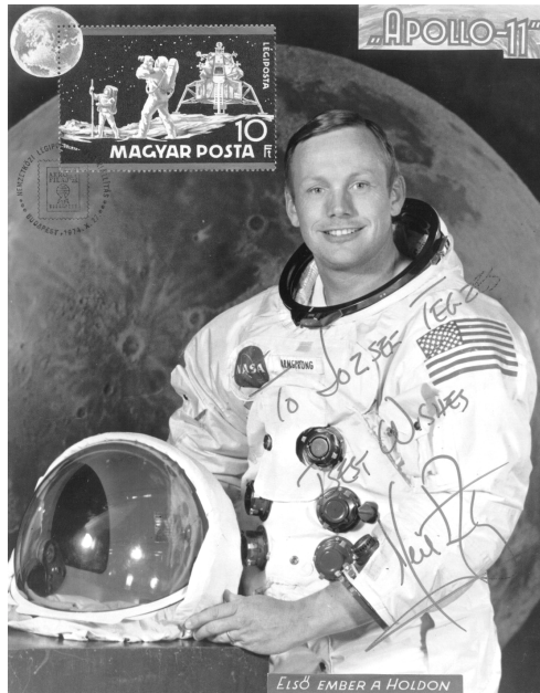
N. A. Armstrong 1969. június 16-án indult társaival az Apollo-11 fedélzetén 8 nap 3 óra 18 perces űrrepülésre. 21-én első emberként lépett a Holdra.