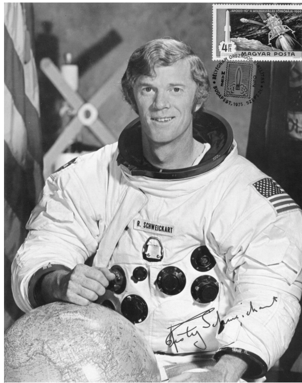
R. L. Schweickart, az Apollo-9 egyik űrpilótája.