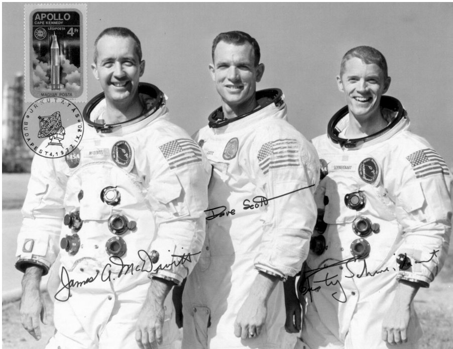
J. A. McDivitt parancsnok, D. R. Scott és R. L. Schweickart 1969. március 3-án indult az Apollo-9 fedélzetén 10 nap 1 óra 1 perces űrrepülésre. A holdra szállás szimulációja volt a feladatuk.