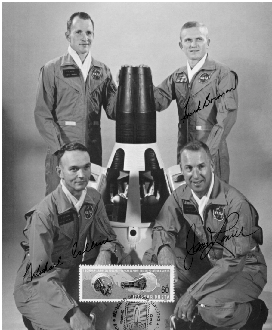
A Gemini-6 indításának elhalasztását követően a Gemini-7 1965. december 4-én startolt F. Borman parancsnokkal ( jobbra felül ) és J. A. Lovell másodpilótával ( jobbra alul ) a fedélzetén. A képen a segédzsemélyzet tagjai is láthatóak: E. H. White ( balra felül ) és M. Collins ( balra alul ).